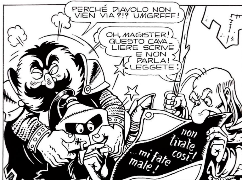
Figura 13: Capitan Golia toglie l'elmo al cavaliere silenzioso

Il cavaliere è così silenzioso che deve scrivere la sfida sul proprio scudo con un gesso, ma non soltanto — continua infatti a usare questo modo di comunicazione per commentare la situazione e, alla fine, per arrendersi. La velocità con cui scrive e l'apparente stabilità della sua mano anche durante condizioni non-ideali (per esempio, mentre Capitan Golia sta aggressivamente tentando di togliergli l'elmo) (fig. 13) 215 sono egualmente umoristiche come il contenuto dei suoi messaggi (dopo la sfida, mentre la compagnia discute su cosa fare, c'è una transizione per mostrare il cavaliere nero tutto minaccioso sul suo cavallo scontroso, e il testo sul suo scudo legge «... e allora?»). 216