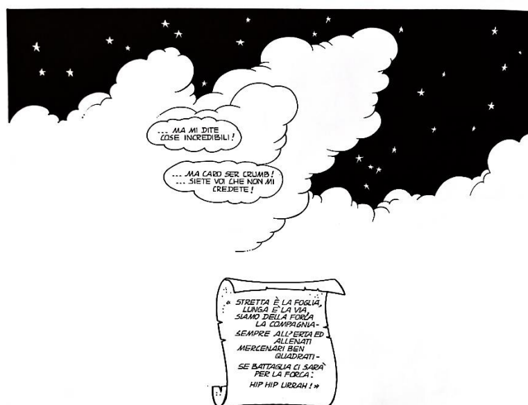
Figura 2: la fine dell'ultimo episodio

Ci trova posto anche la canzone cantata più volte dalla Compagnia: «Stretta è la foglia, lunga è la via / Siam della forca la compagnia... / Sempre all'erta ed allenati / Mercenari ben quadrati... / Se battaglia ci sarà... Per la forca hip hip urrah!» In una occasione, Bertrando aggiunge dopo il verso «Mercenari ben quadrati» la battuta «Mal pagati!» ma viene zittato. 64 La canzone diventa emblematica della Compagnia, un simbolo della vittoria e della solidarietà, e l'inno della serie come tale. Infatti, è appunto con la canzone che finisce l'ultimo episodio (fig. 2).