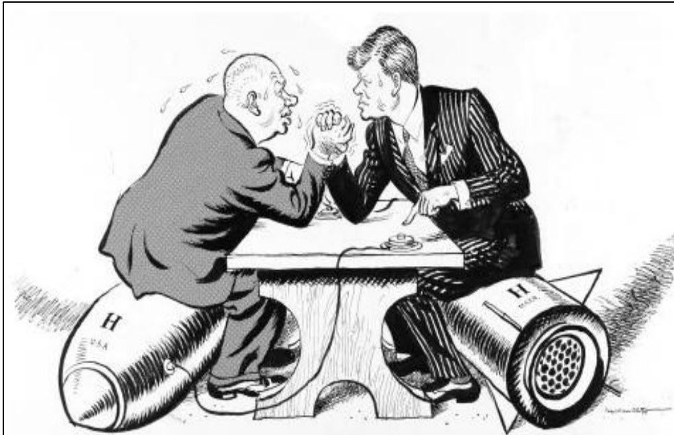
Slika 4. Karikatura sukoba između Kennedyja i Hruščova – Kubanska raketna kriza

Izvor: Ng, Justin, Cuban Missile Crisis – Cartoon Analysis , 2019. https://www.jchistorytuition.com.sg/jc-history-tuition-notes-cuban-missile-crisis-cartoon-analysis/ (posjećeno 22. kolovoza 2023.)