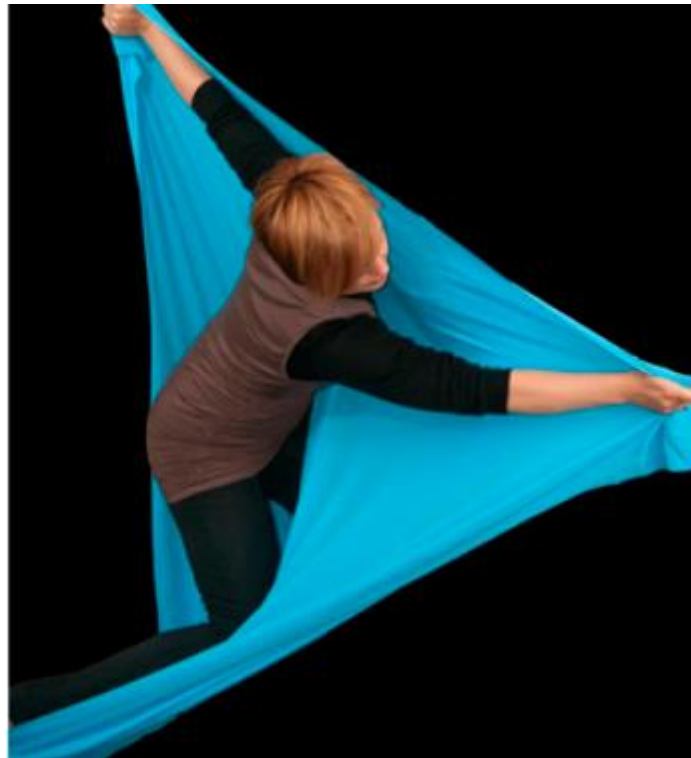
Slika 2. Terapija plesom i pokretom 3

razvojne i humanističke psihologije te kognitivno-bihevioralnih tehnika pri radu s različitim populacijama. Studij traje četiri semestra tijekom kojeg studenti stječu 120 ECTS bodova te akademsko zvanje – sveučilišni specijalist kreativne terapije. Pravo upisa stječu pristupnici koji imaju završen diplomski ili preddiplomski studij društveno-humanističkog, umjetničkog ili zdravstvenog smjera (ples, gluma, likovna kultura, glazba, socijalna pedagogija, psihologija, edukacija i rehabilitacija, pedagogija, logopedija, medicina itd). Pristupnici koji upisuju program specijalističkog studija Terapije plesom i pokretom uz uvodni motivacijski razgovor prolaze audiciju na kojoj se provjeravaju plesne sposobnosti, uz obvezno prethodno iskustvo amaterski ili profesionalno (Akademija za umjetnost i kulturu – službena web-stranica).