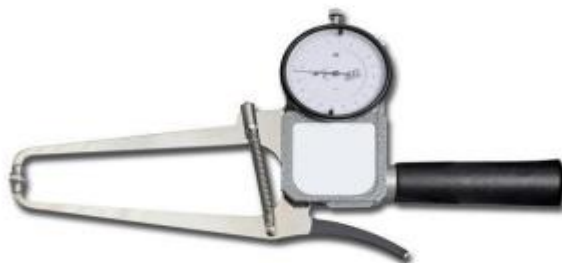
Slika 6. Kaliper