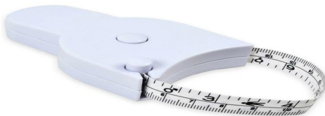
Slika 7. Centimetarska traka

Kada je riječ o mjerenju opsega različitih dijelova tijela, koristi se centimetarska traka duljine 150 ili 200 cm, s preciznošću od 0,1 cm. Poželjna je opcija metalna centimetarska traka, iako je prihvatljiva i plastificirana alternativa. Međutim, platnena traka se ne preporučuje zbog sklonosti pretjeranom istezanju. Centimetarska traka prikazana je na slici 7.