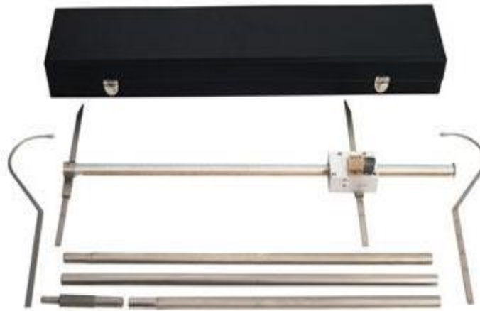
Slika 2. Antropometar

Izvor: Struna – hrvatsko strukovno nazivlje (n. d.). Antropometar . Dostupno na: http://struna.ihjj.hr/naziv/antropometar/20706/ (pristupljeno 22. 2. 2024.)