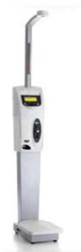
Slika 1. Digitalna vaga

Izvor: Vana d.o.o. Beograd (n. d.), Profesionalna vaga za merenje visine, težine i indexa telesne mase (BMI) Vendy V2 . Dostupno na: https://www.vana.co.rs/product/profesionalna-vaga-za-merenje-visine-tezine-i-indexa-telesne-mase-bmi-vendy-v2/ (pristupljeno 22. 2. 2024.)