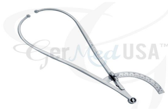
Slika 3. Pelvimetar

Kako bi se dobila specifična poprečna mjerenja, koristi se pelvimetar. Taj se instrument sastoji od dva spojena zakrivljena kraka, a na spoju se nalazi mjerna skala raspona 60 cm. Točnost tog alata također je u 0,1 cm (Mišigoj-Duraković i sur., 2008). Pelvimetar je prikazan na slici 3.