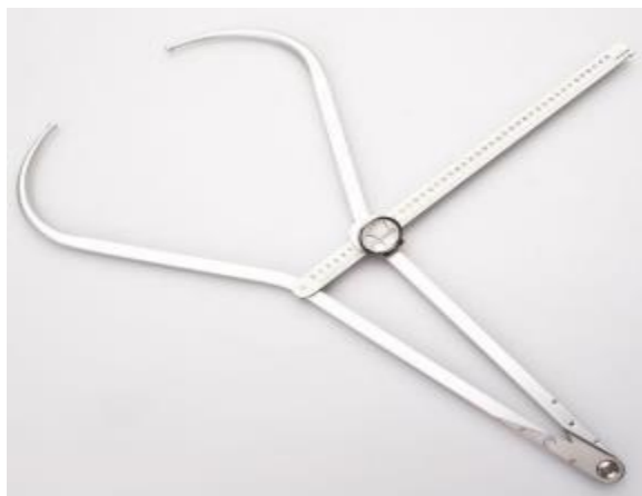
Slika 4. Kefalometar