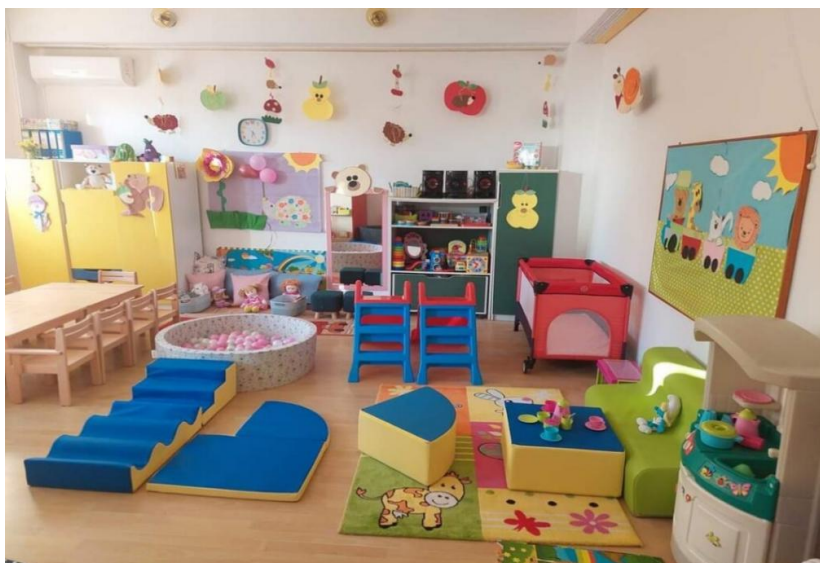
Slika 3. Prikaz uređenja prostora za dječje jaslice.

Stoljećima je igra smatrana kao potrebnom, ne samo kod djece, već i kod ljudi u odrasloj dobi i životinja. Ljudima je urođena potreba za istraživanjem, stvaranjem, kao i kretanjem. Igra bi se mogla smatrati i pripremom za budući život. Svrha igre je sama igra, sama po sebi kao proces, u kojem nije bitan cilj, nego put i sve vještine i spoznaje koje dijete stječe tim putem. Tako je i u Nacionalnom kurikulumu za rani i predškolski odgoj i obrazovanje (2015) naznačeno da je dječji vrtić mjesto igre djece rane i predškolske dobi. Tako u jaslicama možemo razlikovati simboličku igru, pokretne igre, igre prstićima, igre raznim prirodnim i nedovršenim materijalima kao što su voda, pijesak, sirova tjestenina i sirove žitarice. Igra doprinosi kvaliteti razvoja djece, za psihički i fizički razvoj. Odabir igre kod djeteta uvjetovan je razvojnou mogućnošću djeteta kao i poticajima koji su mu ponuđeni. Odabir igre u najranijoj dobi temelj je za izgradnju djeteta kao osobe. Dijete na igru ima slobodu izbora, takva igra podiže djetetovo samopouzdanje, pruža mu radost i zadovoljstvo, omogućuje mu istraživanje i zadovoljavanje znatiželje (Malić, 2022). Došen -Dobud (2016) nabraja mali tobogan, strunjače, bazen s lopticama, tunele i mostove kao obavezne poticaje u uređenju dječjeg vrtića.