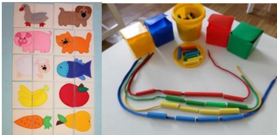
Slika 6. Prikaz materijala za igru s djecom u dobi od 24 do 36 mjeseci.

Igre puzzle za vrtičku dob djeteta mogu se zamijeniti spajanjem sličica od 2 do 4 dijela životinja i poznatih predmeta za djecu, kao i pridruživanjem sličica iste boje. Ova igra može se proširiti jednostavnom igrom memory , a broj parova može se povećavati prema sposobnosti i dobi djeteta. Igra potiče vizualnu percepciju, radnu memoriju, pamćenje, kao i pažnju. Izrezivanjem različitih geometrijskih oblika koji se lijepe na podlogu na kojoj su nacrtani oblici geometrijskih likova, npr. kuća, vježba se vizualna percepcija te predmatematičke vještine. Igra kojom možemo vježbati zvučnu percepciju te pažnju jest igra pronalaženja skrivenih predmeta. U toj igri osoba se može sakriti te dozivati dijete ili može sakriti neki predmet koji proizvodi zvuk te dijete mora prepoznati odakle dolazi zvuk kako bi pronašlo ono što traži. Okusni pupoljci mogu se vježbati igrom pogađanja onog što se nosi u ustima. Dijete ima povez preko očiju, a u usta se stavi komadić hrane koju dijete voli te pogađa što je to.