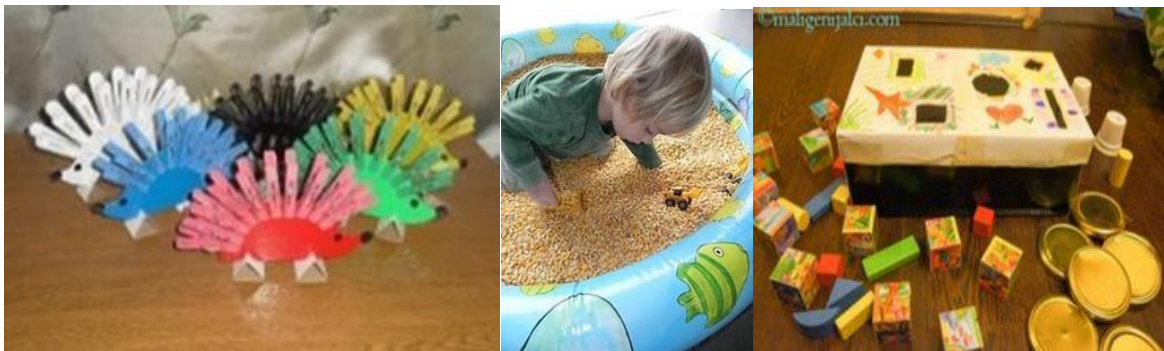
Slika 5. Prikaz materijala za igru s djecom u dobi od 12 do 24 mjeseci.

Igra plastelinom, odnosno tijestom koje se lako napravi kod kuće, odlična je za samoregulaciju pokreta, razvoj jačine dodira, razvoj kreativnosti te taktilnu osjetljivost. U tijestu, riži ili pijesku možemo sakriti i razne predmete koje djeca trebaju pronaći. Igra potiče taktilna iskustva. Tijekom igre važno je biti u komunikaciji s djetetom, verbalizirati aktivnosti i poticati izražavanje djece. 2