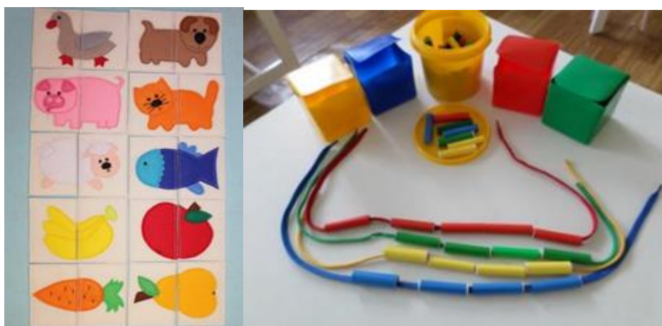
Slika 6. Prikaz materijala za igru s djecom u dobi od 24 do 36 mjeseci.

Igre puzzle za vrtičku dob djeteta mogu se zamijeniti spajanjem sličica od 2 do 4 dijela životinja i poznatih predmeta za djecu, kao i pridruživanjem sličica iste boje. Ova igra može se proširiti jednostavnom igrom memory , a broj parova može se povećavati prema sposobnosti i dobi djeteta. Igra potiče vizualnu percepciju, radnu memoriju, pamćenje, kao i pažnju. Izrezivanjem različitih geometrijskih oblika koji se lijepe na podlogu na kojoj su nacrtani oblici geometrijskih likova, npr. kuća, vježba se vizualna percepcija te predmatematičke vještine. Igra kojom možemo vježbati zvučnu percepciju te pažnju jest igra pronalaženja skrivenih predmeta. U toj igri osoba se može sakriti te dozivati dijete ili može sakriti neki predmet koji proizvodi zvuk te dijete mora prepoznati odakle dolazi zvuk kako bi pronašlo ono što traži. Okusni pupoljci mogu se vježbati igrom pogađanja onog što se nosi u ustima. Dijete ima povez preko očiju, a u usta se stavi komadić hrane koju dijete voli te pogađa što je to.