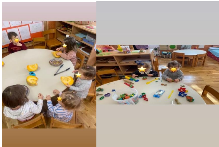
Slika 1. Prikaz materijala koji su ponuđeni djeci jasličke dobi

Kod upoznavanja sa svijetom djeca vole koristiti svoja tijela. Prvi dio tjelesnog razvoja djece jest fizički rast djece, koji ovisi o prehrani. To je prirodni rast i razvoj kod svakog djeteta. Drugi dio bi bio razvoj fizičkih mogućnosti koji uključuje učenje savladavanja prepreka kao i korištenja mišića, pokreta, snage za izvršavanje zadataka (Szanton, 2005).