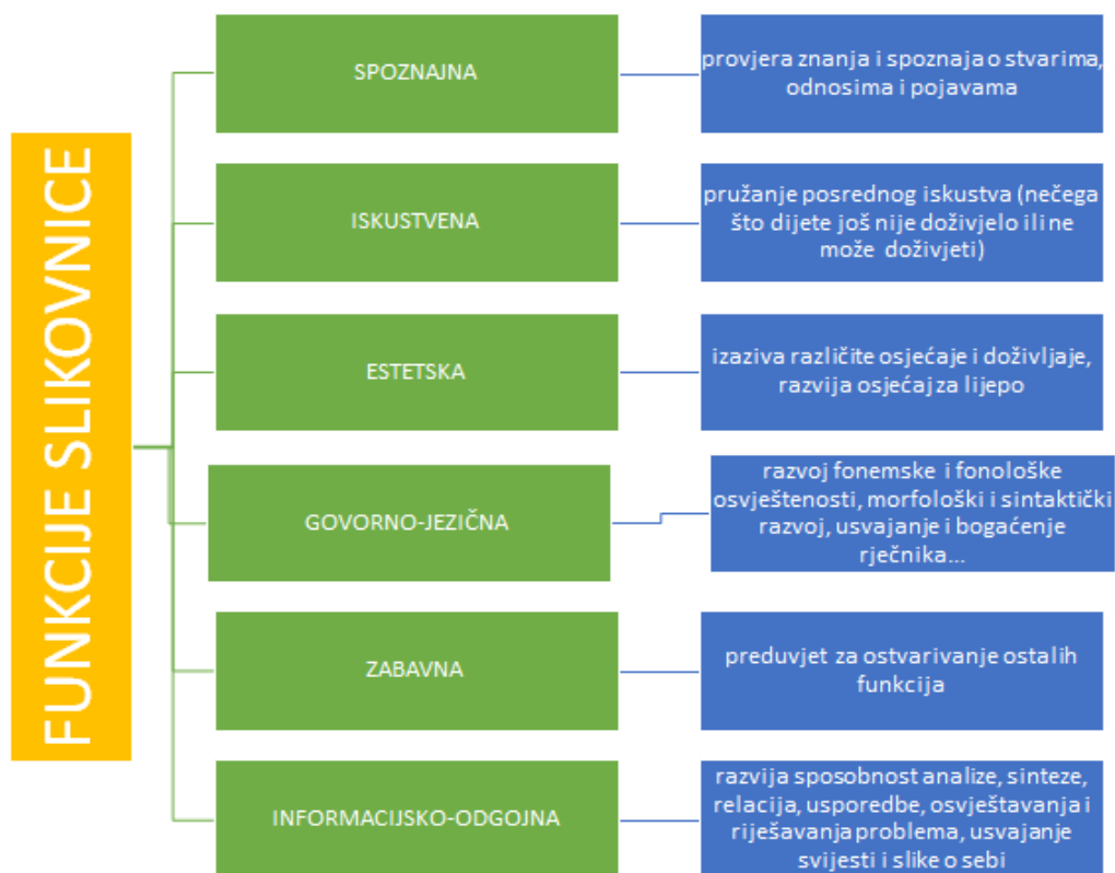
Slika 8.: Grafički prikaz funkcija slikovnica prema: Čačko (2002) i Nikolajeva (2003) 14