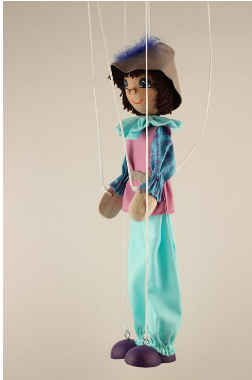
Slika 3. Marioneta