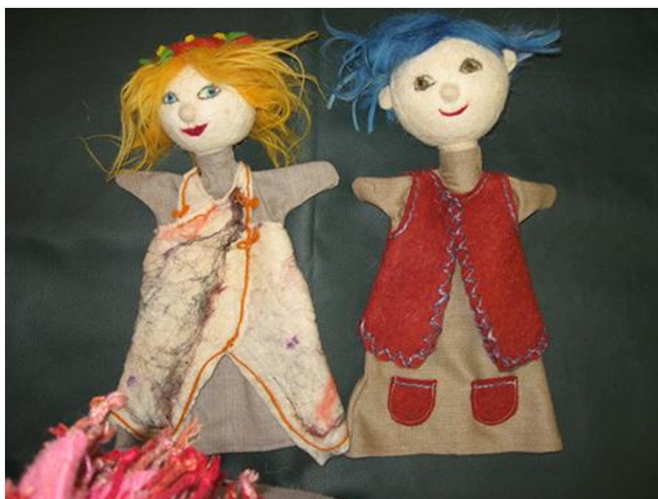
Slika 1. Prikaz ginjol lutke