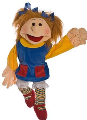
Slika 2. Lutka zijevalica