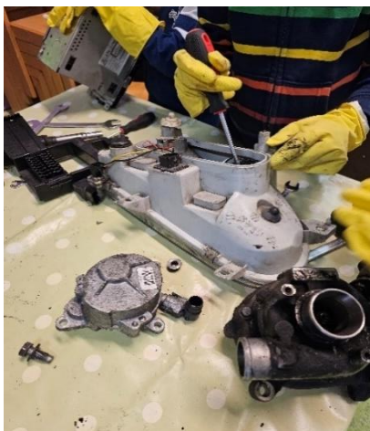
Slika 7. Manipuliranje alatima