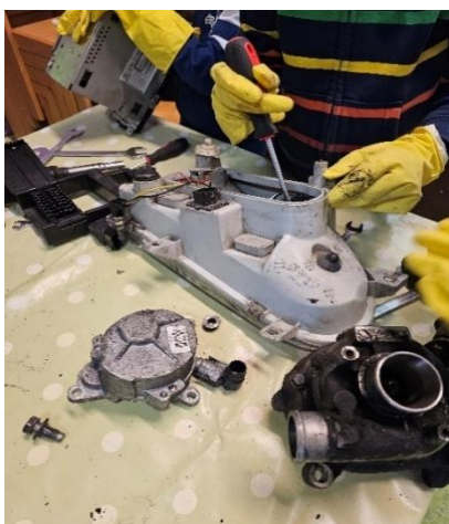
Slika 7. Manipuliranje alatima