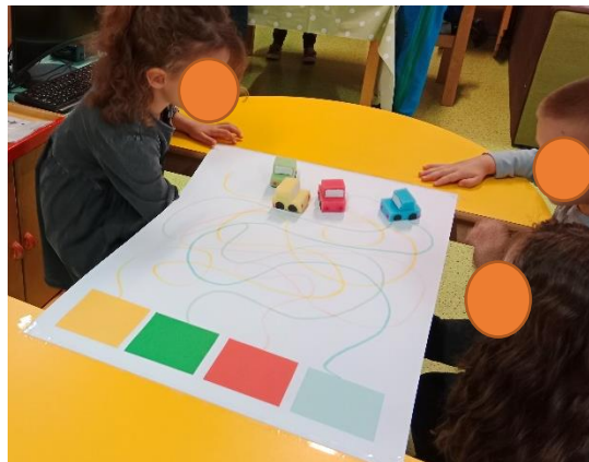
Slika 13. Istraživanje magnetizma kroz igru „Parkiralište“

Primjer iz osobne prakse: U stolno-manipulativnom centru djeci sam ponudila igru „Parkiralište“. Poticaj je koncipiran na način da sam na hamer-papir nacrtala parking-mjesta različitim bojama, dok su na drugoj strani bili automobili izrađeni od spužve koji su na donjem dijelu imali magnet. Zamisao je bila da djeca, prateći boje automobila i ucrtanih putanji „parkiraju“ automobil na odgovarajuću boju. Djeca su manipulirala automobilima na način da su u ruci, ispod hamer-papira držala magnet koji je privlačio magnet na automobilu omogućavajući njegovo pokretanje.