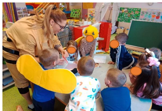
Slika 12. Pečenje medenjaka