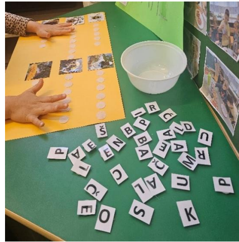
Slika 3: Primjer igre slovima