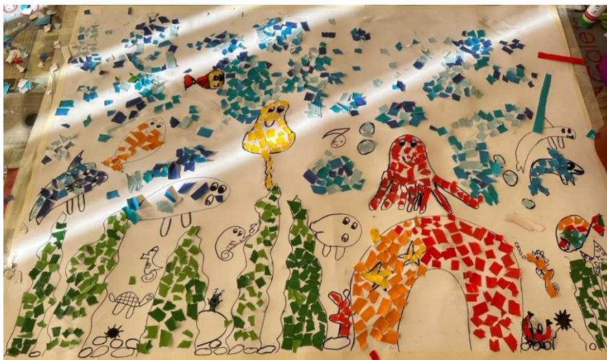
Slika 1. DV „Veseli patuljci“ – Stanovnici mora, grupni rad

Praktični primjer: U okvirima stručno-pedagoške prakse imala sam priliku djeci ponuditi kolaž, ljepilo i škare, da bi grupno izradili scenografiju mora i morskih stanovnika. Tome je prethodila dramsko-lutkarska predstava „Ribica Srebrica“ koja je bila snažan poticaj djeci za produbljivanje interesa za more te za likovno izražavanje.