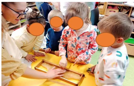
Slika 11. Istraživanje saća