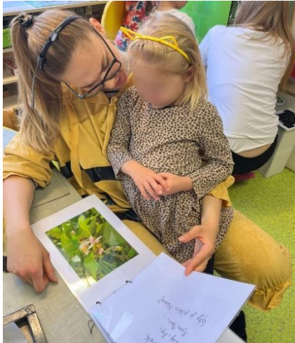
Slika 2: Slikovnica kao poticaj