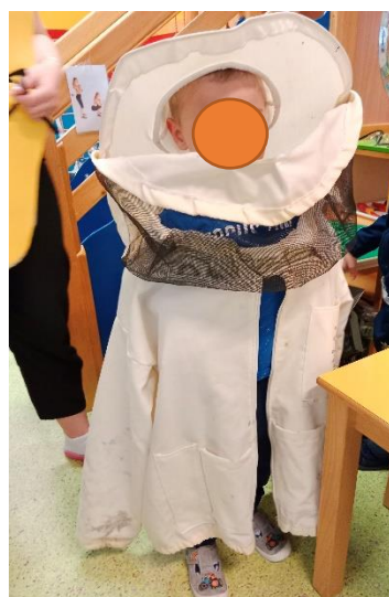
Slika 10. Oblačenje u zaštitno odijelo