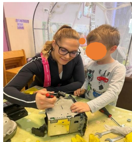
Slika 8. Uloga partnera u aktivnosti