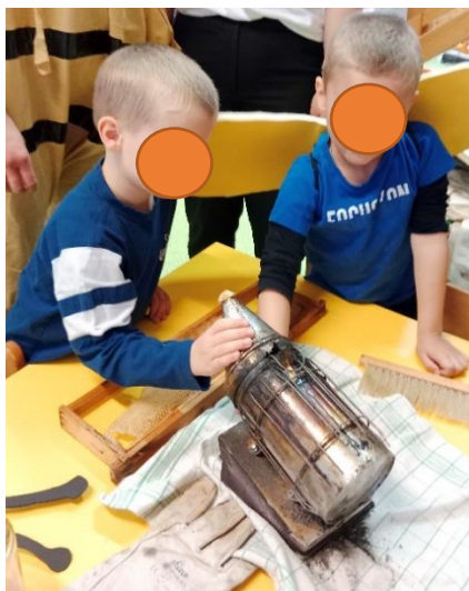
Slika 9. Susret s dimilicom

Drugi je bio pčelarski centar . Povod njegovog formiranja bilo je proljeće jer se u vrtiću prožimala ta tematika, a djeca su iskazivala interes za svijet životinja. Točnije, bili su opčinjeni puževima te su ih tražili, nosili u vrtić te proučavali. S obzirom na to da sam trebala provesti aktivnost iz kolegija Integrirani kurikulum 4, odabrala sam temu „Pčele“, koju sam implementirala u postojeće centre te formirala novi. U pčelarskom centru ponudila sam autentičnu pčelarsku opremu (zaštitno odijelo, dimilicu, saće, alat, četku i med za kušanje) te su djeca uživala isprobavajući mogućnosti poticaja. Osim toga, obukla sam se u kostim pčele i djeci donijela prikladne rekvizite (perike i krila) da bi im iskustvo bilo raznoliko. Što se tiče ostalih centara i povezivanja s temom pčela, u stolno-manipulativnom centru zajedno smo mijesili medenjake, oblikovali ih i stavljali na pleh za pečenje, u centru za ranu pismenost ponudila sam im plakat sa slikama i nazivima pojmova vezanih za temu te isti takav plakat sa slovima „na čičak“ na kojem su sami pokušali naljepiti slova i formirati naziv po uzoru na prvi plakat (Slika 3. ) te slikovnicu (Slika 2.). U matematičkom centru sam ponudila igru sortiranja i kombiniranja sa zadacima (Slika 4.).