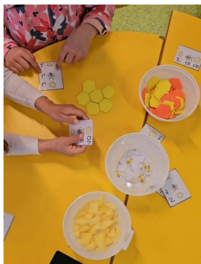
Slika 4. Poticaj za razvoj predmatematičkih vještina

Primjer iz vlastite prakse: U već spomenutoj samostalnoj aktivnosti u vrtiću ponudila sam djeci tri vrste materijala te kartice sa „zadacima“.