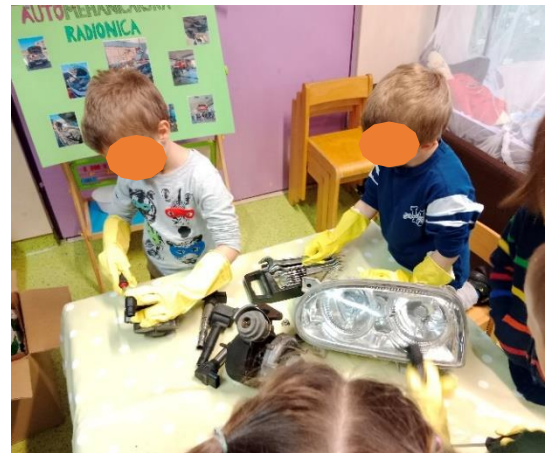
Slika 6. Istraživanje poticaja