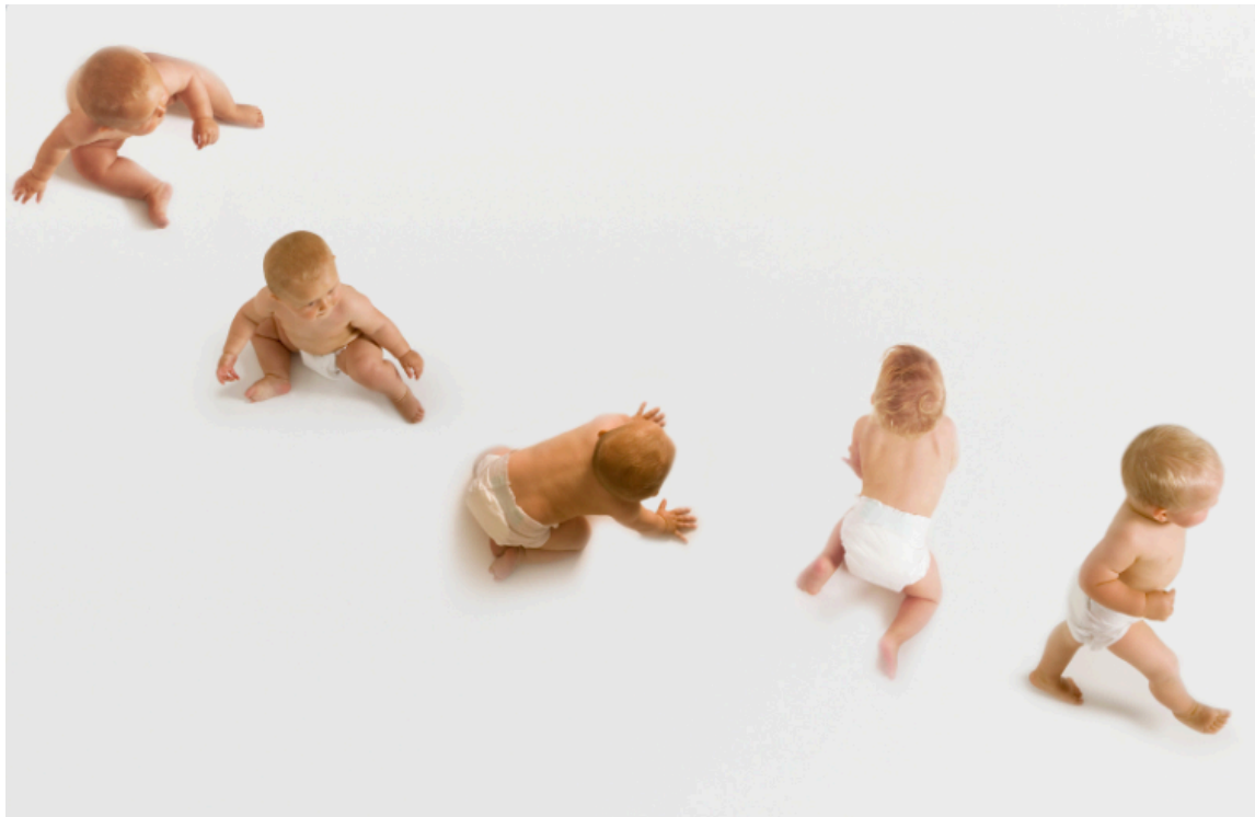
Slika 1. Prikaz motoričkog razvoja ( Group Of Babies stock photo )

otvorenošću prema druženju i komuniciranju s vršnjacima i odraslima te njegovim tendencijama i interesima da sudjeluje u zajednici i zajedničkim odlukama. Kako bih dijete uspješno funkcioniralo i razvilo socijalne vještine, potrebno je poticati ostvarivanje socijalne dobrobiti. One uključuju: razumijevanje i prihvaćanje drugih i njihovih različitosti, usklađenost s normama i zahtjevima zajednice, razvijanje i održavanje kvalitetnih odnosa djeteta s drugom djecom i odraslima, aktivno sudjelovanje, pregovaranje i konstruktivno rješavanje konfliktnih situacija, zajedničko djelovanje s drugima, solidarnost i tolerancija djeteta u komunikaciji s drugima, mogućnost prilagodbe djeteta novim situacijama i okolnostima, percepciju sebe kao važnog dijela zajednice, osjećaj prihvaćenosti i pripadanja, percepciju sebe kao člana zajednice koji ima priliku i mogućnosti pružanja doprinosa zajednici (Nacionalni kurikulum za rani i predškolski odgoj i obrazovanje, 2015).