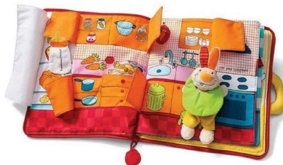
Slika 2. Prikaz interaktivne slikovnice za djecu rane dobi

Kod djece rane dobi iznimno je važna materijalna kvaliteta slikovnice, odnosno da nisu lako potrošne te da ne sadrže otrovne boje zbog oralne faze u kojoj se dijete nalazi (Šišnović, 2021). Što je dijete manje, tekst slikovnice treba biti kraći i jednostavniji, a slova krupnija i jednostavna po obliku (Šišnović, 2011). Ilustracije u toj dobi trebaju biti velike i realne s malo detalja zbog djetetove kraće koncentracije (Pažin i Franolić, 2022) i ograničene percepcije. Nakon djetetove navršene prve godine, poželjno je koristiti interaktivne slikovnice (slikovnice koje sadrže prozorčice, ogledala, oblike) radi djetetova senzornog i motoričkog razvoja (Pažin i Franolić, 2022). „Kako djeca rastu, sve su spremnija za složenije sadržaje, koncentriranija za pomna gledanja i duže pripovijedanje“ (Pažin i Franolić, 2022:62).