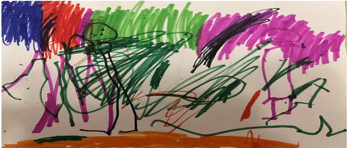
Slika 6, R.H (3.5 godine)

Dijete u likovnom radu koristi tehniku flomastere. Crtež sadrži nekoliko dominantnih boja i linija koje se međusobno prepliću i preklapaju. Linije na crtežu kreću se u različitim smjerovima. Iako su neke pretežno okomite i ravne, druge su valovite i zakrivljene. Dijete koristi primarne (plava i crvena) i sekundarne (zelena, ljubičasta i narančasta) boje. Prostor na crtežu je ispunjen bojama i linijama bez puno praznog prostora. Kompozicija crteža je vrlo spontana i slobodna, što je uobičajeno za dječje crteže u ovoj dobi. Iako dijete identificira ljubičastu figuru kao Medu Paddingtona te crnu figuru kao sebe, figure su stilizirane i apstraktne. Ostali oblici su također nedefinirani. S obzirom na to da dječak kroz razgovor otkriva kako na svom crtežu prikazuje Medu Paddingtona na način koji mu je u tom trenutku poznat, uz dodatak figure sebe koja se ne pojavljuje u crtanom filmu, može se primijetiti suptilan, ali vidljiv utjecaj medija.