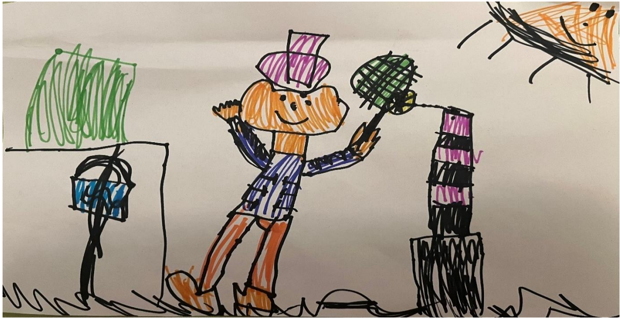
Slika 3, Z.B (7 godina)

Dijete u likovnom radu koristi tehniku flomastere. Crtež prikazuje scenu iz crtanog filma "Medo Paddington," u kojoj Medo igra tenis. Linije koje dijete koristi za ispunjavanje oblika pretežno su ravne i okomite, dok crnim debljim linijama ističe obrise likova i predmeta. Trava je dočarana valovitim linijama. Prostor je prikazan u jednoj ravnini. Medvjedić Paddington se nalazi u središtu crteža, dok su ostali elementi smješteni oko njega. Boje na crtežu su žive i raznolike, što pridonosi razigranoj i veseloj atmosferi. Korištenje crne, koja je neutralna boja, za konture i detalje pruža strukturu i jasnoću, dok primarne i sekundarne boje, poput narančaste, ljubičaste, plave i zelene unose energiju i dinamičnost. Crtež sadrži nekoliko detalja koji obogaćuju ukupnu sliku. Medvjedić Paddington ima prepoznatljive detalje poput kape i plave majice. Teniska mreža detaljno je prikazana s crnim i ljubičastim prugama i mrežastim uzorkom. Na crtežu se jasno očituje snažan utjecaj medija, jer su motivi i detalji precizno preuzeti iz crtanog filma.