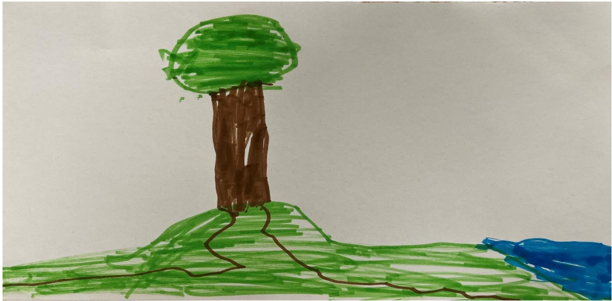
Slika 11, V.R (6 godina)

Dijete u likovnom radu koristi tehniku flomastere. Crtež prikazuje stablo, travu te vodenu površinu, vjerojatno rijeku ili jezero. Drvo je prikazano pomoću okomitih linija koje oblikuju deblo, dok su grane i krošnja predstavljeni vodoravnim zelenim linijama. Korijenje drva je prikazano valovitim linijama koje se protežu kroz travu. Upotreba boja odgovara prirodnim bojama objekata u stvarnom svijetu. Smeđa boja je korištena za deblo i korijenje, dok je zelena korištena za krošnju i travu. Plava boja na desnoj strani prikazuje vodenu površinu. Drvo zauzima centralni dio crteža, dok je prizemni prostor ispunjen travom i korijenjem koje se prostire prema vodi. Perspektiva je ravna, bez izražene dubine, ali kompozicija uspješno prikazuje osnovne odnose među objektima. Djetetov crtež ne sadrži motive iz priložene priče, što sugerira da je nastao iz slobodne dječje mašte.