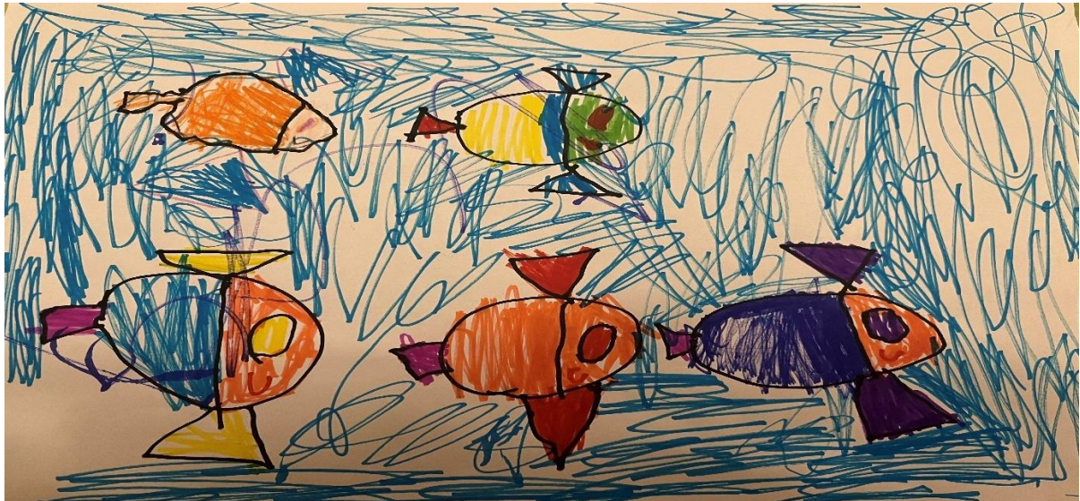
Slika 4, T.K (5.5 godina)

Dijete u likovnom radu koristi tehniku flomastere. Crtež prikazuje ribe u moru. Konture riba su definirane crnim zatvorenim linijama, što ih vizualno izdvaja iz pozadine. Pozadina je ispunjena raznim linijama nanesenim brzim pokretima ruke, dok su ribe pretežno ispunjene vodoravnim i okomitim linijama. Dijete koristi gotovo čitav prostor papira, izbjegavajući praznine. Prostor je prikazan bez perspektive, tipično za dječje crteže. Ribe su raspoređene po površini papira, čime se stvara osjećaj kretanja i živosti. Dijete koristi kombinaciju primarnih (plava, žuta, crvena) i sekundarnih (narančasta, zelena, ljubičasta) boja kako bi stvorilo živopisni i dinamični prikaz. Svaka riba ima jedinstvene karakteristike, poput različitih boja tijela, peraja, očiju i repova. Uzimajući u obzir na dječak komentar na rad, zaključuje se da je crtež nastao pod snažnim utjecajem medija.