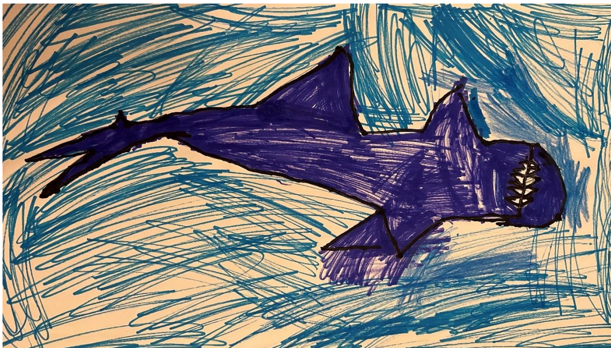
Slika 10, B.P (6.5 godina)

Dijete u likovnom radu koristi tehniku flomastere. Crtež prikazuje morskog psa u moru. Linije su dominantan element. Plave linije koje čine pozadinu i morskog psa su vrlo izražajne i guste te su nanese brzim potezima ruke. Boje koje dijete koristi su dominantno plave, s različitim nijansama plave koje se koriste za prikazivanje morskog psa i pozadine. Tamnoplava boja tijela morskog psa čini ga dominantnim elementom u kompoziciji, dok svjetlije nijanse plave stvaraju kontrastnu pozadinu. Crna boja korištena za konture dodatno naglašava lik morskog psa. Prostor je organiziran na način da morski pas zauzima centralnu poziciju, dok je pozadina ispunjena linijama. Kompozicija je jednostavna i usmjerava pažnju promatrača na glavnog lika. Crtež ne sadrži motive iz ponuđenog crtanog filma, što sugerira da je nastao iz slobodne dječje mašte.