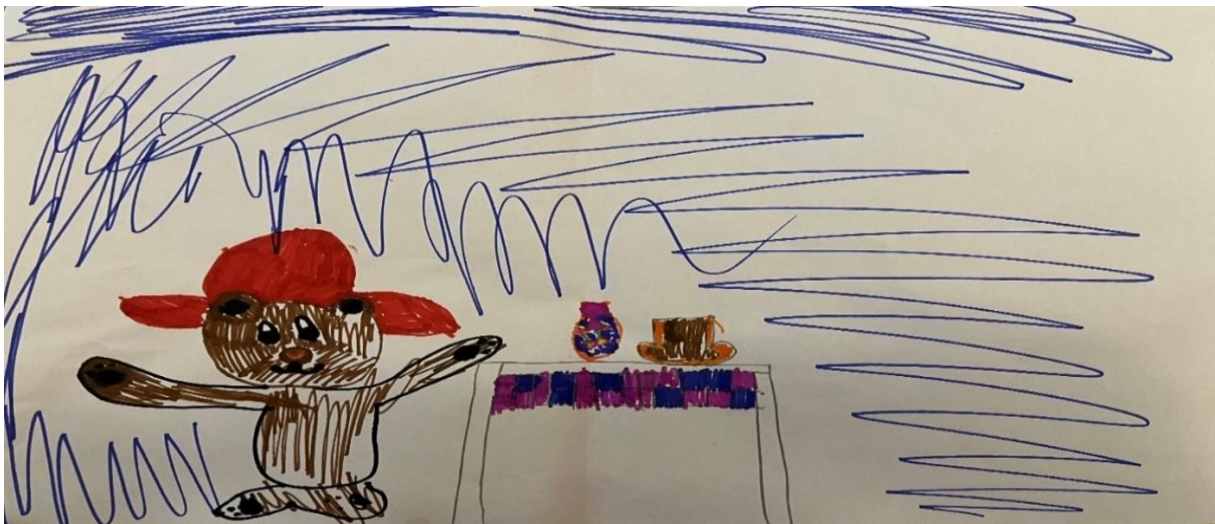
Slika 1, M.B (6 godina)

Na crtežu dijete koristi tehniku flomastera. Crtež prikazuje scenu iz crtanog filma "Medo Paddington," u kojoj se odvija čajanka. Dijete koristi gotovo čitav prostor papira, izbjegavajući praznine. Linije koje predstavljaju nebo su slobodne i valovite, a dijete na nekim dijelovima radi brze pokrete rukom što dodaje dinamiku i pokret crtežu. Zatvorene linije koriste se za oblikovanje tijela Medvjedića Paddington. Pozadina je obojena dominantnom plavom, jednom od primarnih boja. Medvjedić Paddington je nacrtan s crnim očima, smeđim tijelom i crvenim šeširom, što ga čini prepoznatljivim likom. Stol na sebi ima šarenu vazru i smeđu šalicu, što dodaje realistične elemente i pokazuje djetetovu sposobnost prepoznavanja i reproduciranja različitih oblika i boja. Na crtežu se jasno očituje snažan utjecaj medija jer su motivi i detalji vjerno preneseni iz crtanog filma.