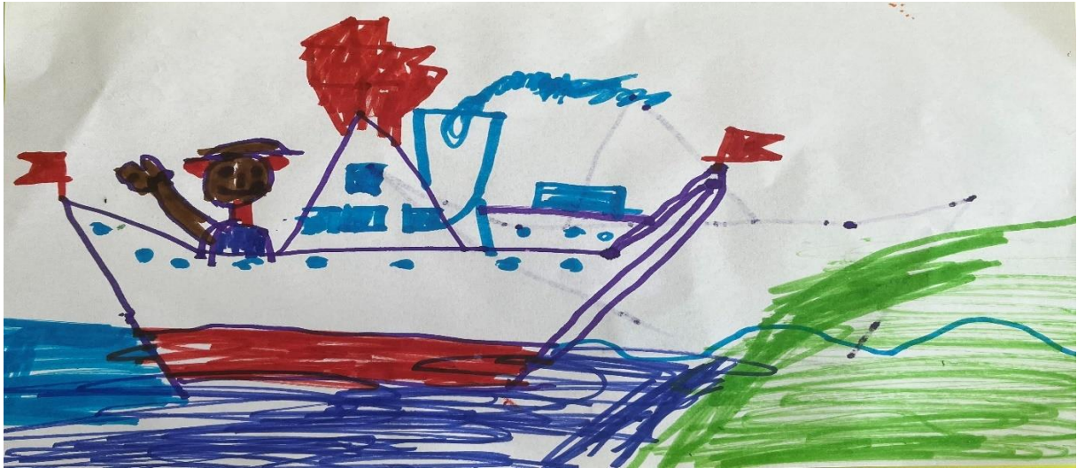
Slika 5, F.V (7 godina)

Dijete u likovnom radu koristi tehniku flomastere. Crtež prikazuje Medu Paddingtona na brodu, okružen morem i zelenom površinom. Linije su jednostavne i jasne, s dominacijom vodoravnih linija, dok su oblici pretežno geometrijski. Boje su jasne i žive, dijete koristi crvenu, plavu, smeđu te ljubičastu. Kompozicija crteža je centralizirana s brodom i likom kao glavnim fokusom. Crtež sadrži nekoliko detalja poput dimnjaka s dimom, zastava i prozora na brodu. Lice medvjedića Paddingtona je nasmijano, što odražava pozitivne emocije. Pozadina je ostavljena jednostavna. Dijete prikazuje motiv iz prikazanog crtanog filma, ali dodaje brod koji nije prisutan u originalu te tako stvara novu priču.