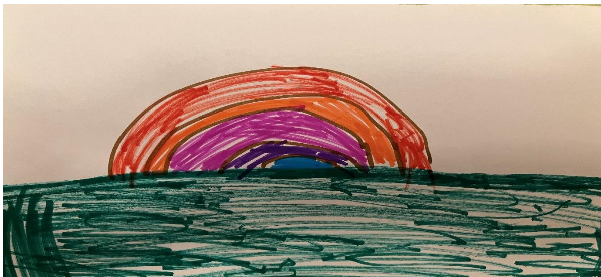
Slika 9, M.E (5.5 godina)

Dijete u likovnom radu koristi tehniku flomastere. Crtež prikazuje dugu iznad zelenog tla, odnosno travu. Linije koje tvore dugu su blago zaobljene, a linije koje predstavljaju tlo su većinom vodoravne, varirajući u debljini i intenzitetu boje. Upotreba primarnih (plava i crvena) i sekundarnih (narančasta, ljubičasta i zelena) boja daje crtežu jasan i živopisan izgled. Boje su bogate i snažne te su korištene bez mnogo nijansiranja ili miješanja. Iako detaljna perspektiva nije razvijena, osjećaj prostornosti postignut je jasnim odvajanjem dvije glavne zone: nebo i trava. Duga je centralni element i vizualno je najdominantnija, smještena u sredinu papira. Detalji nisu izrazito razrađeni. Crtež ne sadrži motive iz ponuđenog crtanog filma, što ukazuje na to da je dijete crtež stvorilo iz vlastite mašte.