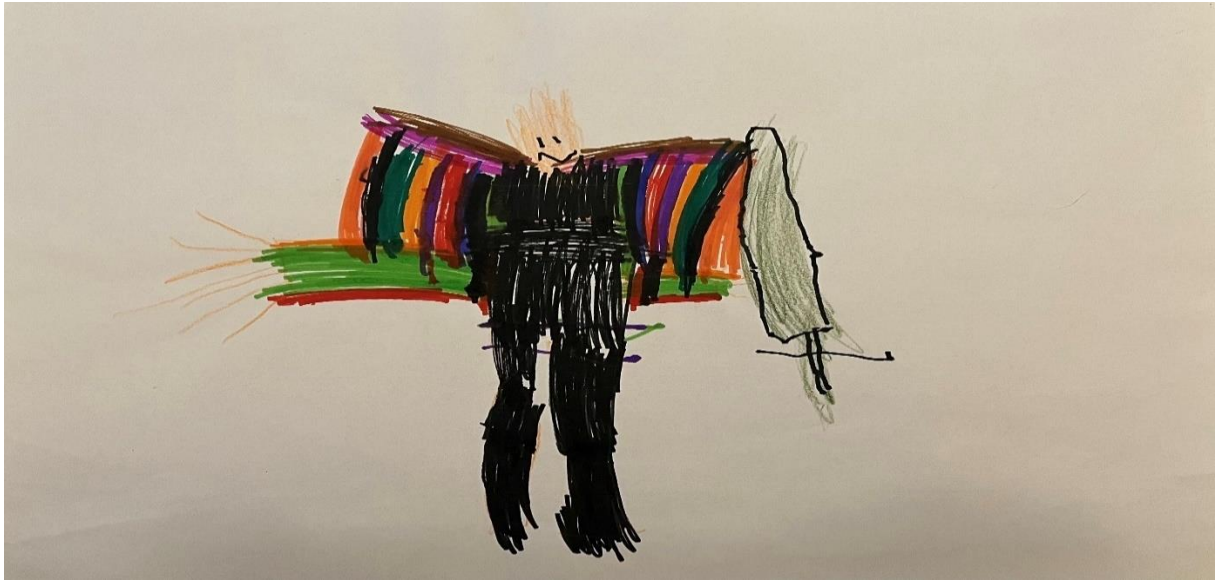
Slika 8, V.D (4.5 godine)

Dijete u likovnom radu koristi flomastere i drvene bojice. Na crtežu je prikazana figura koja predstavlja dijete, što se može zaključiti iz djetetovog komentara na crtež. Linije figure su guste i intenzivne, pretežno ravne i valovite, povučene ili okomitim ili vodoravnim potezima. Prostor je iskorišten tako da se lik nalazi u središtu, dok prostor oko njega ostaje prazan. Ovo je uobičajeno za dječje crteže gdje djeca često postavljaju glavne elemente u središte svojih radova, kako bi istaknula važnost tih elemenata. Boje su intenzivne i živahne, s prevladavajućom crnom na tijelu. Na rukama se pojavljuju primarne boje (crvena i plava), sekundarne boje (narančasta, ljubičasta i zelena) te siva. Detalji na figuri su minimalni. Dijete na crtežu ne koristi motive iz priložene priče, što sugerira da je crtež nastao iz vlastite ideje.