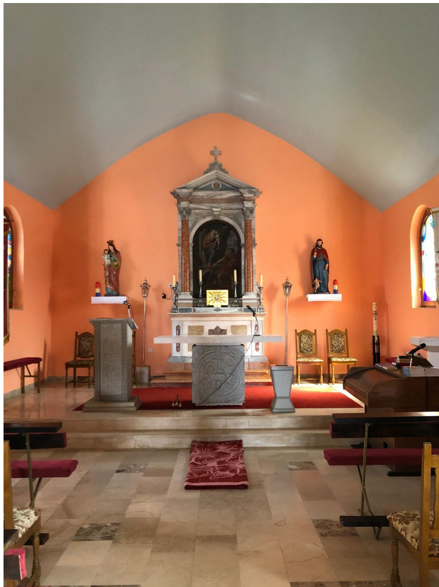
Skinuti oltarnici i prostirka za svećenika, crkva sv. Mihovila, Bisko, 2024.

„Veliki petak počima sa prostiranjem svećenika prid oltarom na spomen polaganja Gospodina Isusa Krista u grob. To je simbolično.“ 29