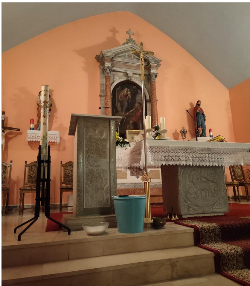
Crkva sv. Mihovila, Bisko, 2024. Veliki četvrtak