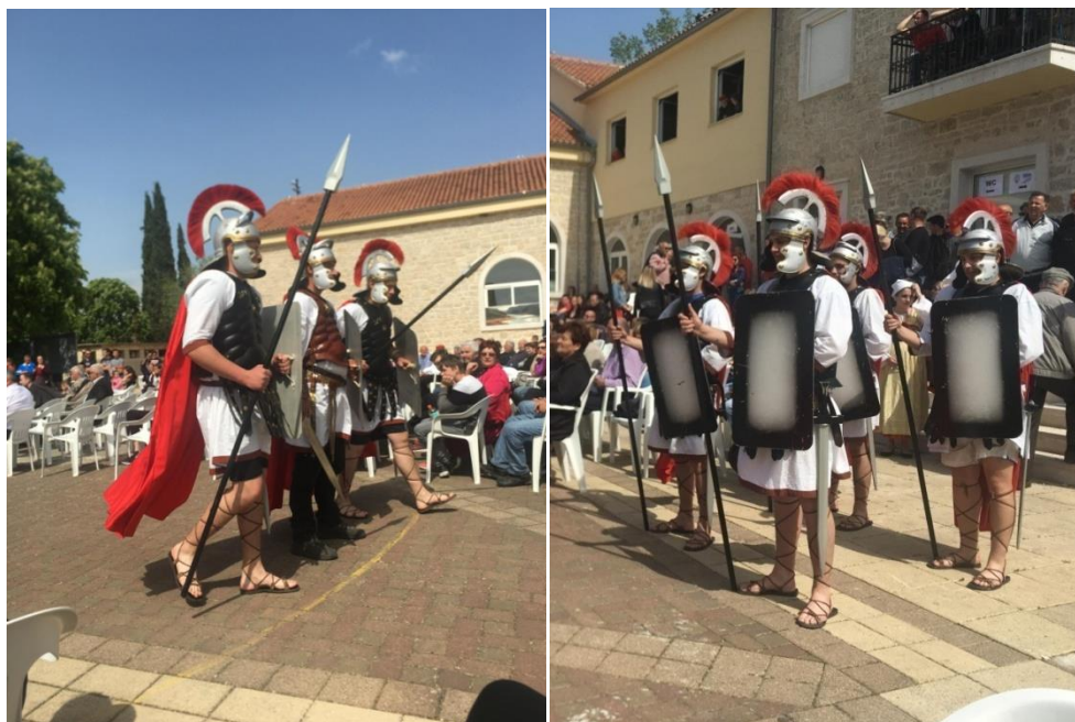
Košučki žudije, Vodice, 2022.

Stomorije u Kaštel Novome, u župi u Žeževici, tako odemo tim župama da uveličamo slavlje. Kad nastupamo mi ne pričamo, ne bacamo se, nema vike. Glavni nastup je na bdijenje na Veliku subotu, Isus je uskrsnuo i mi smo pripadnuti, ne znamo di ćemo sa sobom jer smo mi izdali Isusa, razapeli ga, pripali smo se šta smo to napravili. Većina žudija se bacaju jedni po drugima, trču po crkvi, lome koplja. A mi imamo opremu tešku čak jedanaest i po kilograma na sebi i ne smimo se bacat. Usvojili smo zakon u crkvi da bi najbolje bilo da se Isusu u crkvi jednostavno samo poklonimo. Svatili smo da smo ga razapeli, da smo ga ubili, da smo pogriješili i onda se samo na “Slavu” malo uznemirimo zbog toga što smo napravili i onda se poklonimo, skinemo kacige, spustimo koplja. Tako stojimo dok ne završi “Slava”, a onda pognutih glava s kacigama u ruci i spuštenih koplja izađemo i napustimo crkvu. To su naši načini tijekom Velikog tjedna.” 59