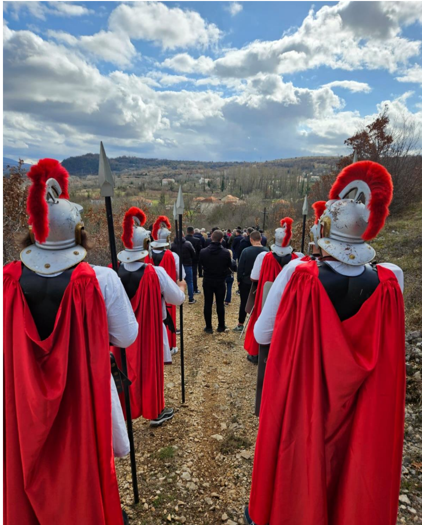
Košučki žudije na Križnom putu, brdo Golgota (brdo Kršine), 2024.

pa smo ih na ovaj način htjeli malo privući. To smo pokrenili da bi donekle vratili mlade na pravi put.