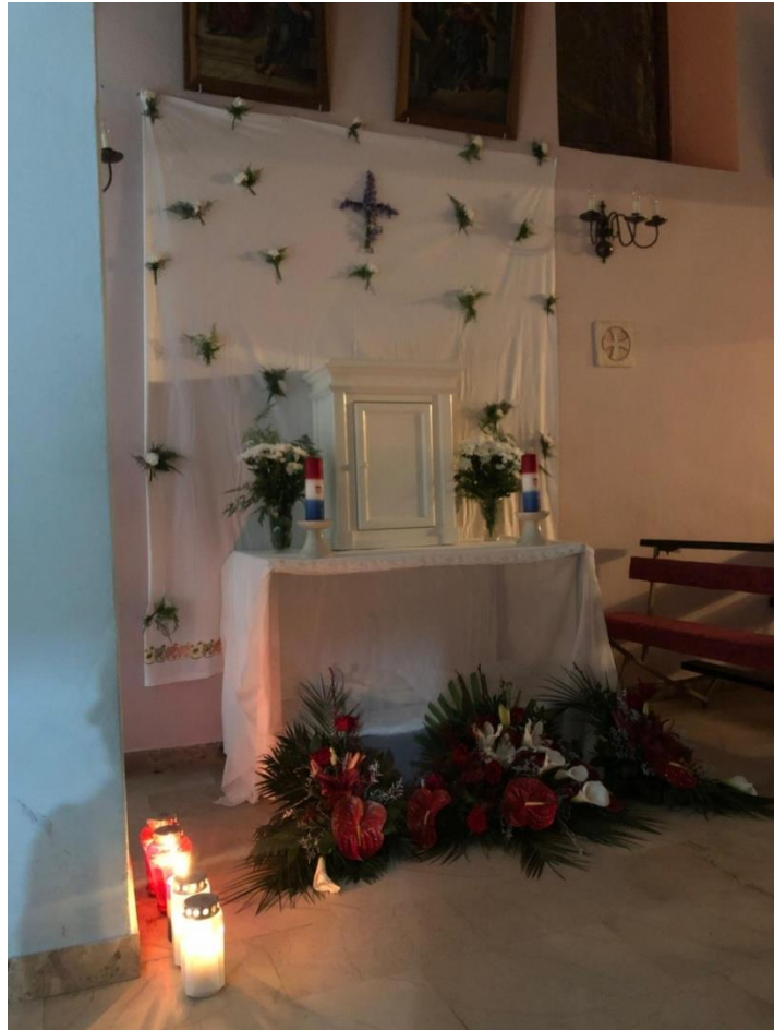
Kristov grob, crkva sv. Mihovila, Bisko, 2024.