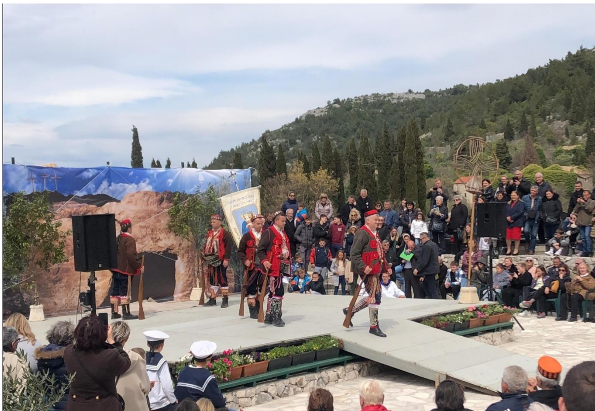
Vrličke žudije, Slivno Ravno, 2023.

Svako mjesto njeguje svoje običaje koji se razlikuju od drugih župa. U pojedinim mjestima Čuvari Kristova groba su u narodnim nošnjama (Vrlika, Tisno...) drugdje su u mornarskim odorama (Opuzen, Vlaka, donedavno Komin...) dok su većinom u odorama rimskih vojnika.“ 60