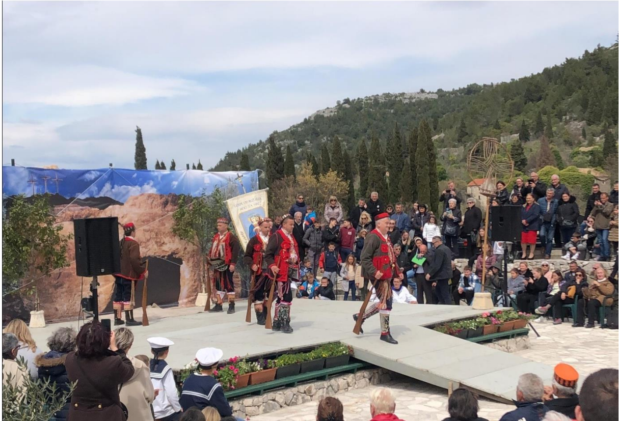
Vrličke žudije, Slivno Ravno, 2023.

Svako mjesto njeguje svoje običaje koji se razlikuju od drugih župa. U pojedinim mjestima Čuvari Kristova groba su u narodnim nošnjama (Vrlika, Tisno...) drugdje su u mornarskim odorama (Opuzen, Vlaka, donedavno Komin...) dok su većinom u odorama rimskih vojnika.“ 60