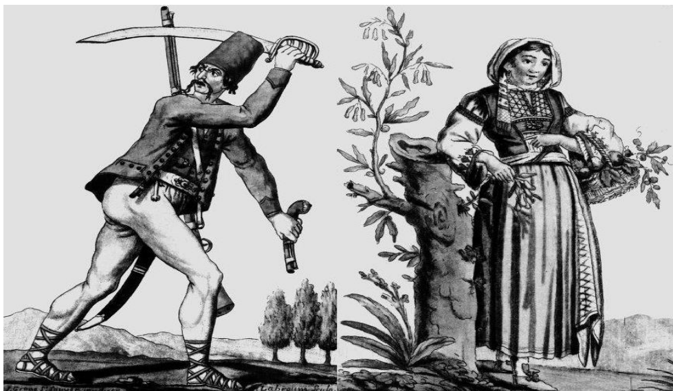
Slika 2. Prikaz Morlaka u svakodnevnoj odjeći

zemlja se počela obrađivati. Ovaj tip naselja se Mlečanima nije svidio, jer se smatralo da su oni, koji žive van naselja skloni pljačkanju, pa je kasnije i zabranjeno živjeti van već postojećih naselja. 17