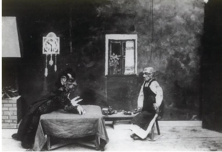
Slika 8. Teatar marioneta — August Šenoa, Postolar i vrag

U 20. stoljeću lutkarstvo je dobilo na profesionalnosti i organiziranosti, osnovali su se prvi profesionalni lutkarski ansambli i kazališta, poput Hrvatskog narodnog kazališta u Zagrebu koje je 1920. godine pokrenulo prve profesionalne lutkarske predstave. Zagrebačko kazalište lutaka (Slika 9) osnovano je 1948. godine kao Zemaljsko kazalište lutaka, proizašlo iz djelovanja dotadašnje Družine mladih, a riječ je o glumačkoj družini osnovanoj 1939. godine, koja predstavlja zaseban pravac lutkarstva u Zagrebu, a vodili su ju Vlado Habunek i Radovan Ivšić. Od osnutka do kraja Drugog svjetskog rata Družina je izvela niz zapaženih avangardnih predstava pretežno francuskih pisaca (Molière, Scapinove spletke i Ljubomorni Barbouillé ), a na repertoaru su i neke lutkarske predstave (A. P. Čehov, Diplomat ) u tehnici ginjola (Verdonik, 2008).