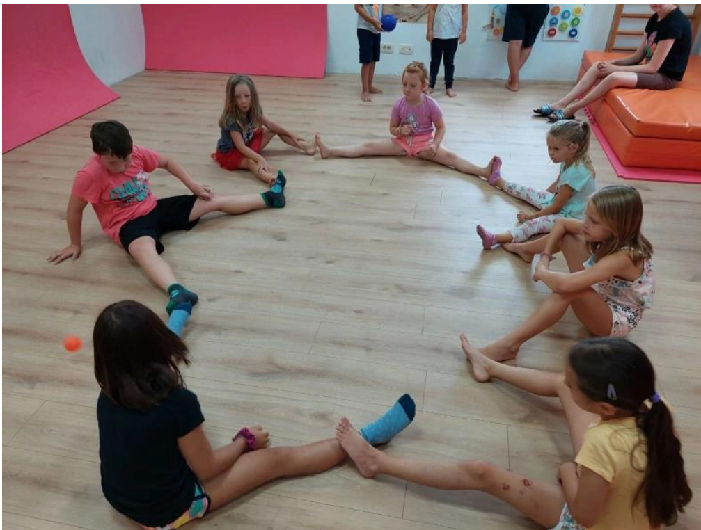
Slika 1: Kineziološke aktivnosti

Kineziologija se temelji na primjeni svojih teorija, koncepcija i principa u različitim područjima kao što su sport, kineziološka edukacija, kineziterapija i kineziološka rekreacija (Sporiš, Badrić, Prskalo i Bonacin, 2013). U širokom smislu, kineziološkim aktivnostima smatraju se sve aktivnosti koje uključuju fizičko pokretanje tijela (Sindik, 2001). U užem smislu, to su osmišljene, strukturirane i nespontane aktivnosti. Potreba za kretanjem nadilazi samo fiziološku dimenziju, obuhvaćajući i druge aspekte ljudskih potreba, pa svaka aktivnost može imati višestruke koristi (Sindik, 2001).