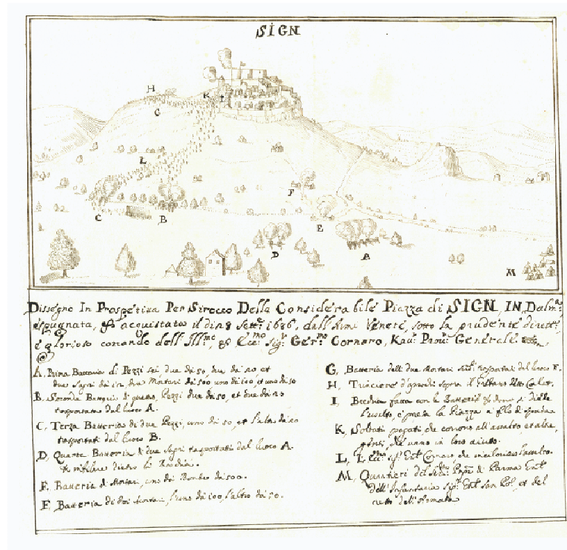
Slika 1. Prikaz osvajanja sinjskoga Grada 28. rujna godine 1686. 16