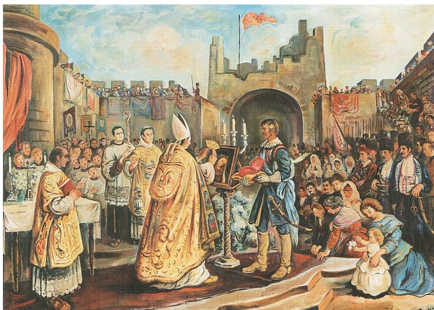
Slika 3. Krunidba Gospe 54

Obučen u bijeli plašt s bijelom mitrom počeo je pjevati himnu Veliča i izmolio molitvu iz oficija. Zatim je pokazao Priliku i na nju postavio zlatnu krunu. Obred je završen molitvom uz pjevanje Zdravo Kraljice. Brojni vjernici pratili su obred i procesiju, uz pucanje mužara i pjevanja Zdravo, morska zvijezdi. Pred crkvom nadbiskup je blagoslovio narod i sinjski kraj svetom Prilikom. 52 Zlatna kruna je veoma lijepo izrađena. Ukrašena je viticama i anđeoskim glavicama. Na njenom dnu upisano je: IN PERPETUUM CORONATA TRIUMPHAT – ANNO MDCCXV – Zauvijek okrunjena slavi – 1716. godine. 53