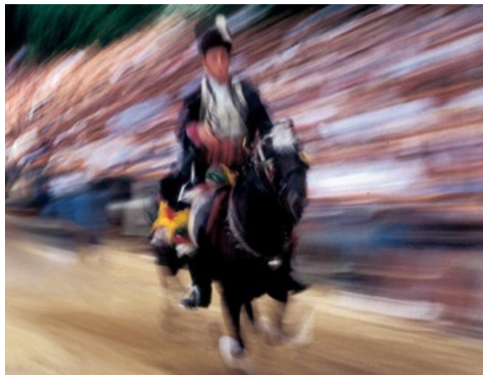
Slika 12. Alkarsko trkalište 69

Dužina trkališta, na dijelu odakle alkar otpočinje trku i gdje završava, iznosi oko 300 m. Širina trkališta je najmanje 5 m. S obje strane trkališta nalazi se čvrsta ograda visine oko 1 m, a iza ograde su tribine (palke) za gledatelje. 68