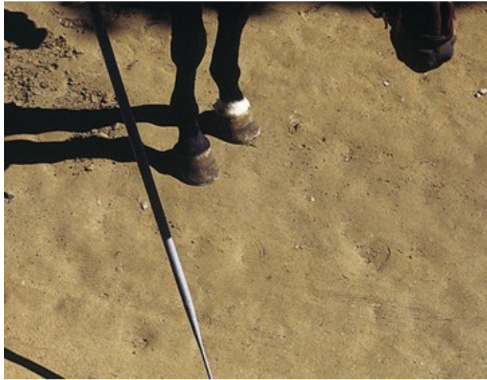
Slika 8. Alkarsko koplje 62

Alkarsko koplje je od drveta. Dugačko je 290 do 300 centimetara, promjer 32,9 milimetara, na njegovu vrhu je šiljak dug 30 centimetara. Nešto ispod polovice dužine koplja nalazi se jabuka, nepomičan drveni obroč koji štiti ruku od udarca alke. Na dnu koplja nalazi se bat, zadebljanje u koje se stavlja olovo zbog uravnoteženosti koplja prilikom gađanja. Koplje je obojeno sivom bojom. 61