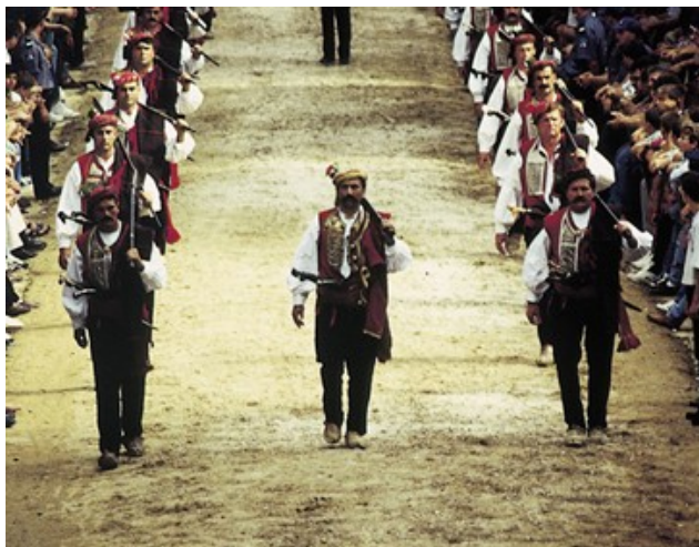
Slika 9. Alkarska povorka 64