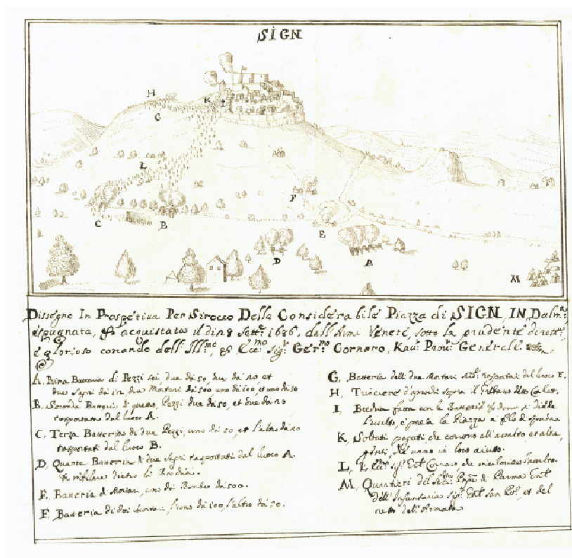
Slika 1. Prikaz osvajanja sinjskoga Grada 28. rujna godine 1686. 16

Nakon osvajanja tvrđave opći providur je neko vrijeme ostao u Sinju jer se očekivao turski protuudar. Odmah se pristupilo popravljajući zidina i kuća u tvrđavi, tako da je pod vodstvom prvog sinjskog providura Antonija Bolanija smješteno u njoj oko 150 vojnika. 15