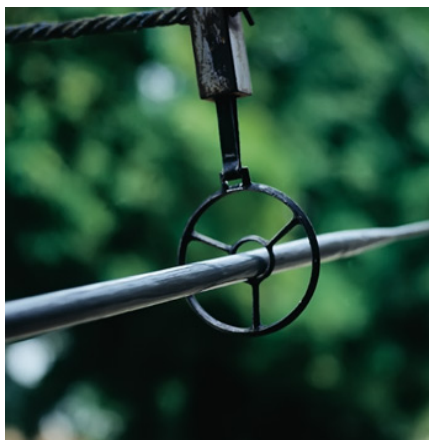
Slika 7. : Pogodak u sridu je kad koplje prođe kroz središnji krug, to alkaru donosi tri boda (punta) 60