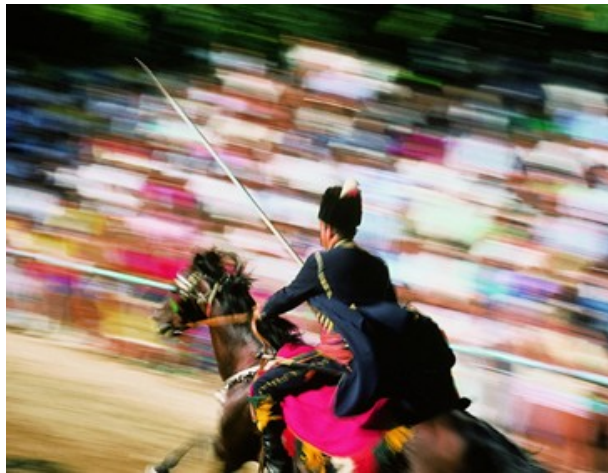
Slika 4. Alkar u trku 56

Alka se održava samo u Sinju i samo na stazi zvanoj Alkarsko trkalište, gdje se priređuje sve od svog osnutka od ponovnog pokušaj Osmanskog Carstva da zauzme ta područja.