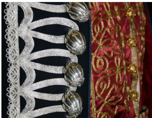
Slika 10. Svečana odjeća 66

U ruci puška kremenjača naslonjena na lijevo rame. Na nogama lagani opanci, a u njima vezeni terluci. Bubnjari, trubači, namještač alke i njegov pomoćnik, obučeni su u jednostavniju narodnu nošnju s crvenom kapom urešenom kitama. Članovi časnog suda obučeni su u svečana tamnopalva odijela s plavom vrpcom na prsima. 65