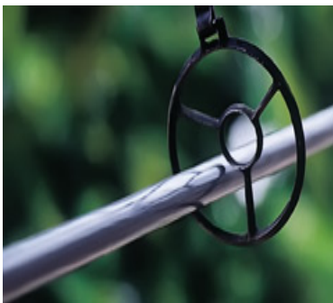
Slika 5. : Pogodak ispod središnjeg kruga, donosi jedan bod (punat) 58

Alka je željezni kolut koji se sastoji od dva koncentrična obruča. Veći obruč ima 13,17 cm promjera, a unutrašnji manji 3,51 cm. Oba su obruča spojena sa tri željezne prečke koje međuprostor dijele u tri jednaka pregratka. Željezne šipke obruča i prečki debele su 6,6 mm i imaju oštar rub sa strane s koje se gađa kopljem. 57