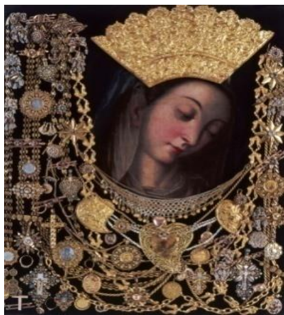
Slika 4. Čudotvorna Gospina slika

identiteta Cetinske krajine. Iako imaju izvanpovijesni, a možda i natpovijesni smisao, ne mogu se zbiljski razumjeti bez vlastitog povijesnog konteksta. Sinjska alka kontinuirano traje od 1717. godine sve do danas i samo je jedanput bila odgođena na više mjeseci zbog kolere (1855.), a tijekom Drugog svjetskog rata nije se održavala (osim 1944.). Nakon Drugog svjetskog rata ustalilo se da se Alka održava svake prve nedjelje u kolovozu. 69 Najstariji do danas sačuvan pisani pravilnik (Statut) potječe iz 1833. godine i predstavlja temelj pravila za održavanje Alke do danas. Veći dio odredbi statuta podudara se s odredbama sličnih viteških nadmetanja u tadašnjoj Europi, osobito na području Mletačke Republike (Udine, propisi iz 1762.). Za razliku od sličnih onodobnih viteških natjecanja u kojima su mogli sudjelovati samo alkari-vitezovi iz povlaštenog društvenog sloja, u Sinjskoj alki mogli su sudjelovati i ljudi iz sela Cetinske krajine. Za Alku se kaže da je „hodajući statut“ zbog strogo kodificiranog poretka svih sudionika igre, apoteoza sklada i ravnoteže društvenog sloga i narativna povorka koja kodificira hijerarhiju dostojanstva i kroz tu sliku utvrđuje društvena pravila među pojedinim skupinama, rodovima i obiteljima. Ona je nastavak i jedini autentičan ostatak mnogih viteških nadmetanja što su se održavala u nekim većim mjestima na hrvatskoj obali: alka se trčala u Zadru, Makarskoj, Imotskom... 70