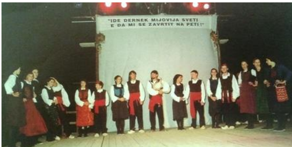
Slika 3. Proslava sv. Mihovila, pučka veselica