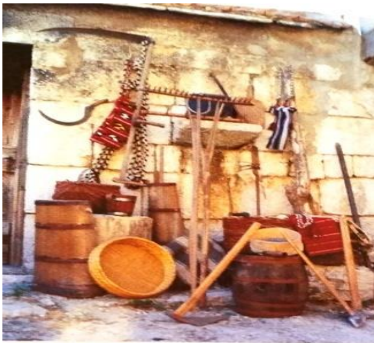
Slika 1. Tradicionalni uporabni predmeti

Na ovu priču nadovezao se moj djed Božo Vučković koji mi je ispričao kako se nekada obrađivalo naše dugo, zlatno polje po kojem je moje mjesto dobilo ime.