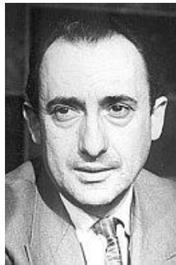
Slika 1: Ivan Raos 2

Pučku školu, odnosno prvih pet razreda, pohađao je u Grabovcu (razdoblje opisano u romanu, „ Vječno nasmijano nebo “), a potom je školovanje nastavio u Biskupskoj klasičnoj gimnaziji u Splitu (opisao u romanu „ Žalosni Gospin vrt “). Svoj odlazak u sjemenište Raos je objasnio Vlatku Pavletiću u Razgovoru o književnom stvaranju: „ U prošlosti su za siromahe, osim motike, postojala samo dva puta: crveno ili crno, vojnik ili svećenik. (...) Ja, koji sam ponajviše volio junačke pjesme – i narodne, i Kačićeve – sa strahom i gnušanjem pobjegoh od krvave sablje i puške ubojite, da se sklonim pod okrilje crne mantije. Kasnije me izbaciše i iz tog utočišta, kao što će me u tom jalovom životnom putu počesće izbacivati... “ 3