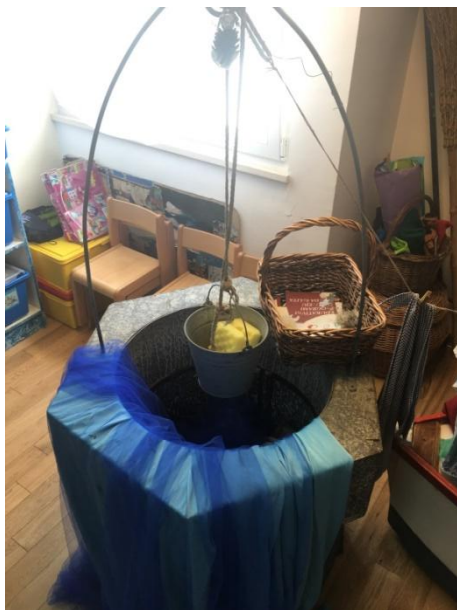
Slika 10 Bunar