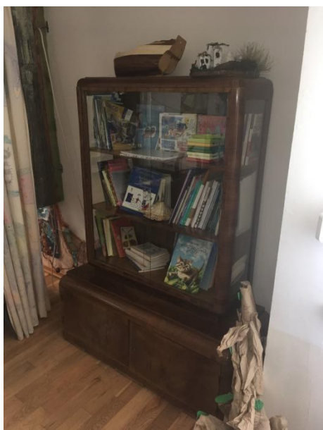
Slika 8 Dio sobe dnevnog boravka 5