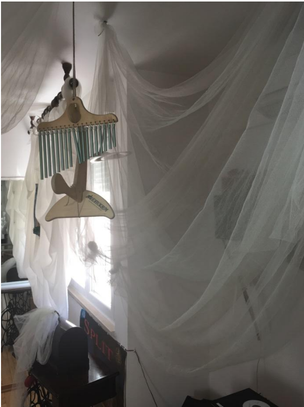
Slika 17 Glazbeni izraz