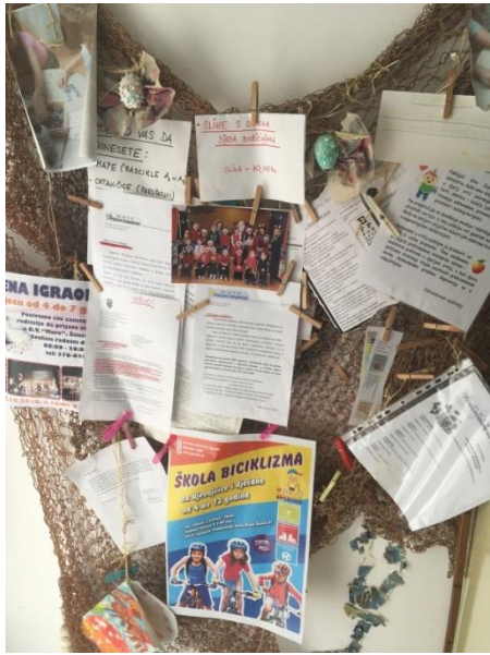
Slika 9 Kutak za roditelje