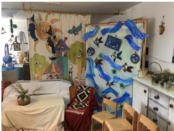
Slika 5 Dio sobe dnevnog boravka 2