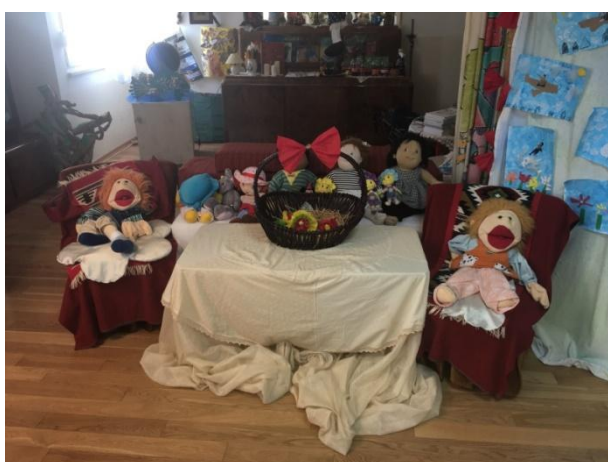
Slika 7 Dio sobe dnevnog boravka 4