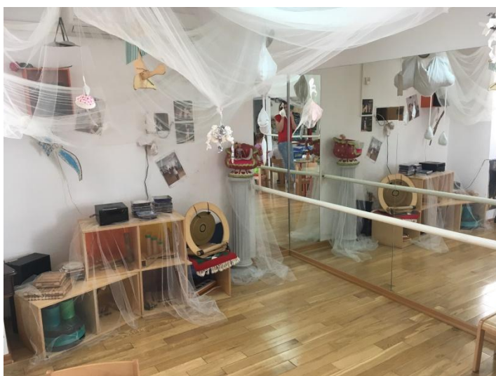
Slika 2 Glazbeni centar