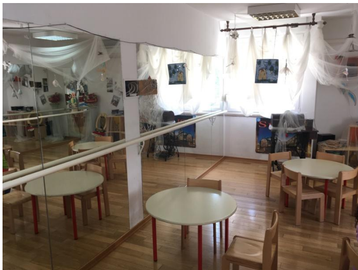
Slika 1. Ogledala u sobi dnevnog boravka

U Reggio koncepciji posebnu se važnost daje uređenju prostora, počevši od njegovih boja do osvjjetljenja. Prostor je organiziran tako da se omogućuje djetetu slobodno kretanje i izražavanja kreativnosti na stotinu načina.