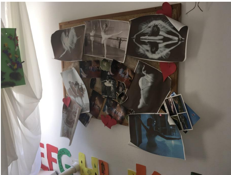
Slika 15 Plesni izraz "Balet"