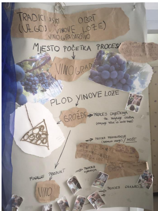
Slika 13 Tradicijski obrt-uzgoj vinove loze