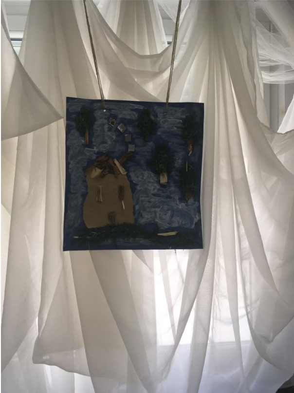
Slika 16 Izlaganje radova "Kuća"