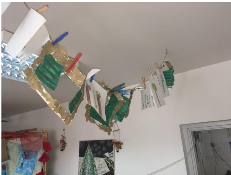
Slika 18 Izlaganje radova "Maslina"