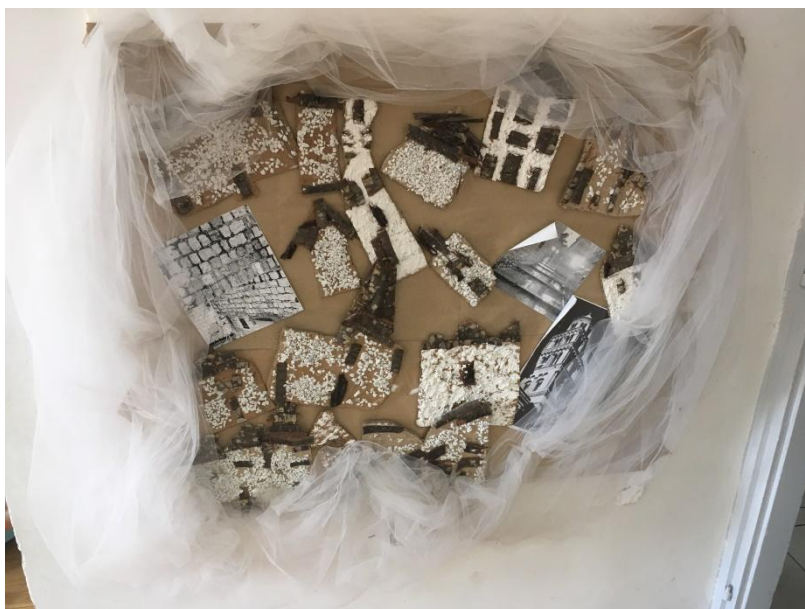
Slika 19 Izlaganje radova "Zvonik sv. Duje"