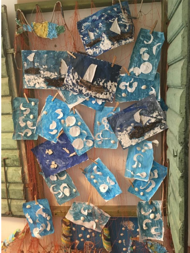
Slika 14 Likovni radovi na temu "Valovi"