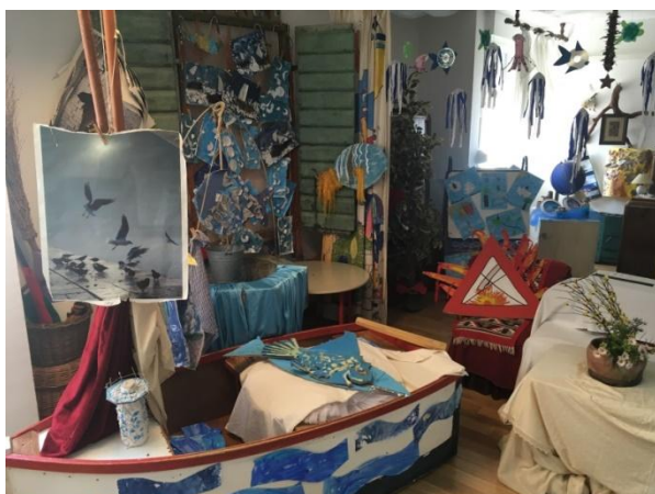
Slika 4 Dio sobe dnevnog boravka 1