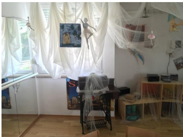
Slika 6 Dio sobe dnevnog boravka 3