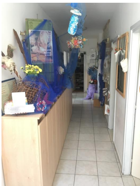
Slika 3 Hodnik