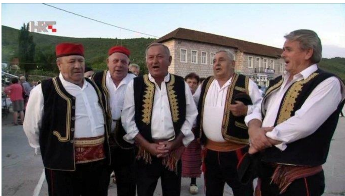
Imotski gangaši na Festivalu gange u Slivnu 56

Eto, tako vam je otkad odoste, to vam je štono reče pjesnik, 'ta sva povijest roda moga'! A moj rod ganga i ojkovica, bura u badnju - zahuči, pa oduši! Što hoćete? ... Zar se u svoje vrijeme niste i vi tako tužili i u djedovima Boga gledali?! Pa vam je i ova moja tužaljka u redu! E, kad vam je u redu, drž'te je tvrdo i ostanite gdje jeste, a ja odoh...'' 55