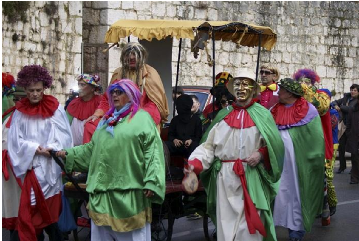
Slika s Bakovih svečanosti u Imotskom 52

tradicionalno se održava Večer humora i zabave. Organizira ju Kulturno – umjetničko društvo Bakove svečanosti, a prema tradiciji, ismijava sve događaje koji su obilježili proteklu godinu. 51