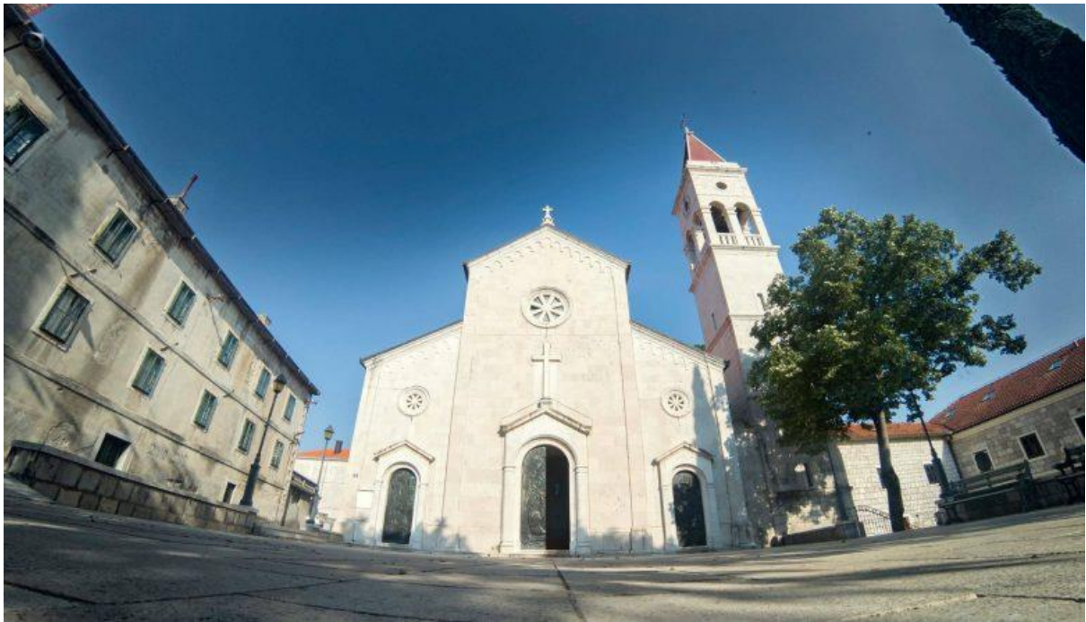
Crkva svetoga Franje Asiškoga u Imotskome 76