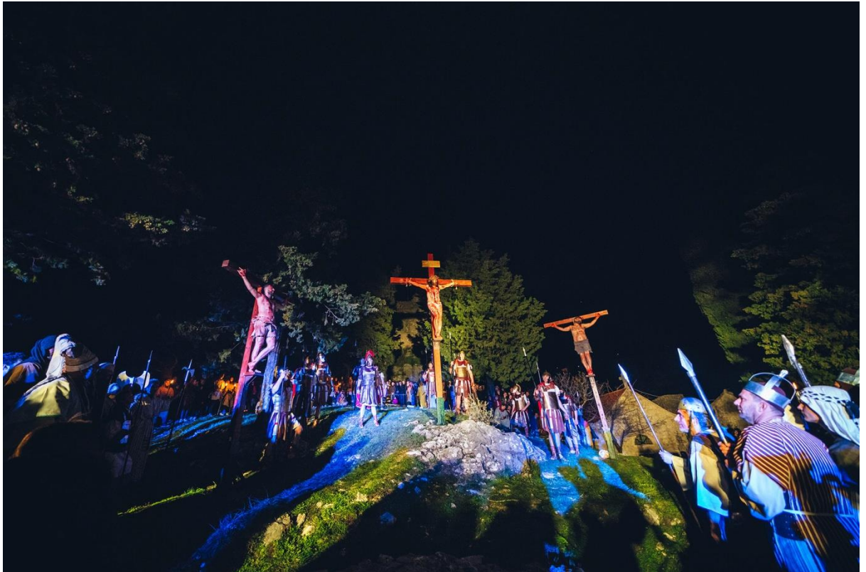
Uprizorenje muke Gospodnje u Imotskom 58