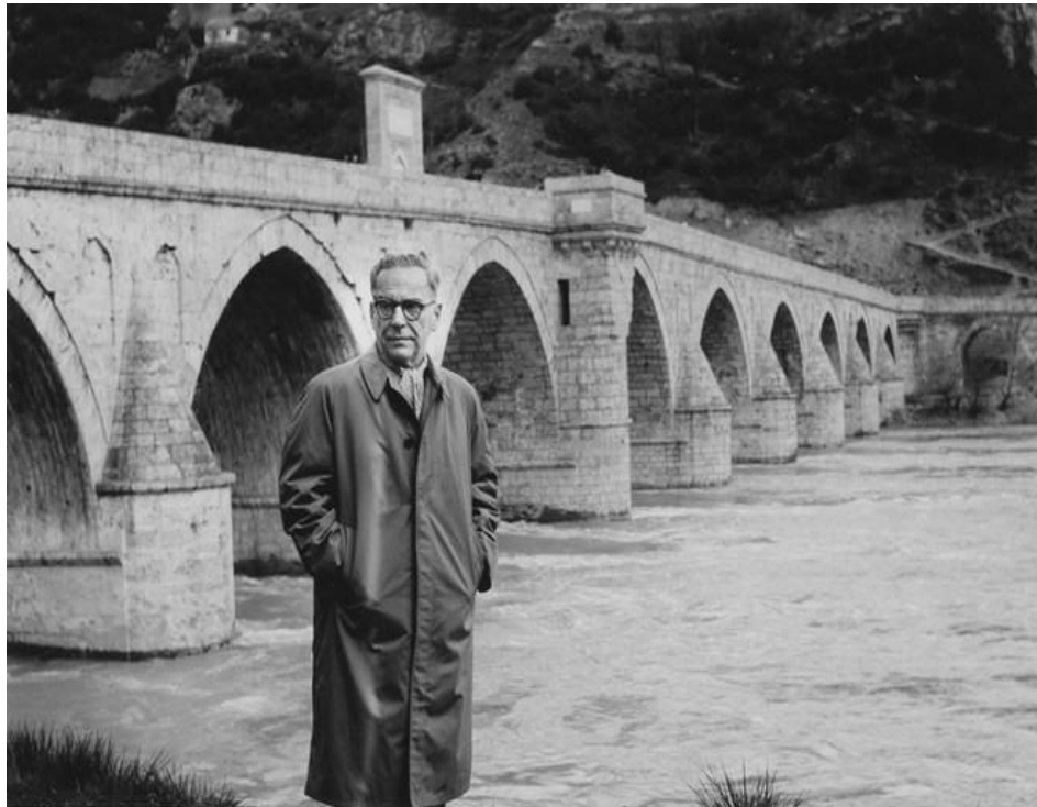
Slika ćuprije 18

prohteve? Sve može biti. Ali jedno ne može: ne može biti da će posve i zauvek nestati velikih i umnih a duševnih ljudi koji će za božju ljubav podizati trajne građevine, da bi zemlja bila lepša i čovek na njoj živeo lakše i bolje. Kad bi njih nestalo, to bi značilo da će i božja ljubav ugasnuti i nestati sa sveta. To ne može biti.“ 17