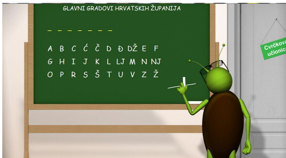
Slika 3: Igra Slovo po slovo (Cvrčkova vježbalica)

Na edukacijskom softveru Cvrčkova vježbalica nalazi se igra Slovo po slovo (Slika 3). Učenikov zadatak je pogađajući slova otkriti koji je glavni grad županije, ali nije navedeno koje županije. Pošto je cijelo područje Republike Hrvatske podijeljeno na dvadeset županija i grad Zagreb koji ima položaj županije to bi značilo da za ovu igru učenik mora znati dvadeset županijskih središta iako u Nastavnom planu i programu za osnovnu školu (2006.) piše da učenik mora upoznati županijsko središte ili grad u svom zavičaju i pronaći ga na zemljopisnoj karti.