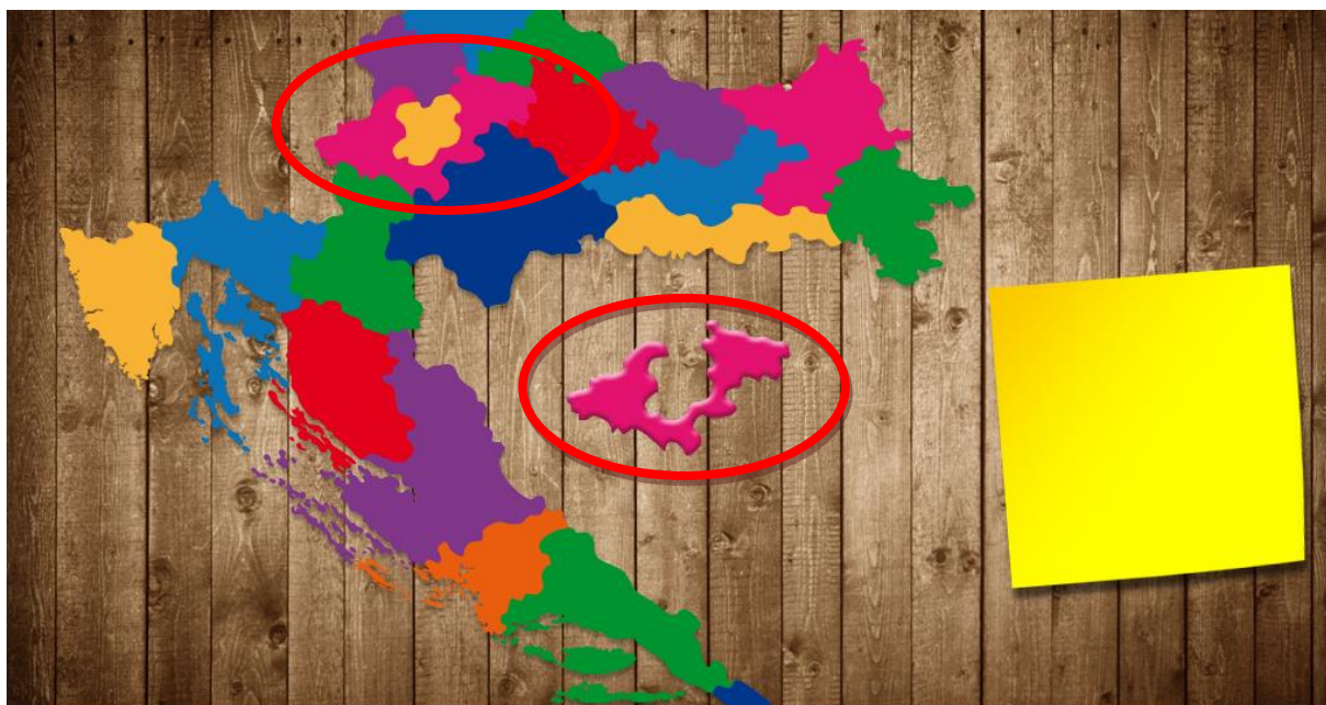
Slika 2: Igra Gdje je što (Cvrčkova vježbalica)

i programu za osnovnu školu (2006.) učenici o zemljovidu uče u trećem razredu osnovne škole. Dok o županijama uče također u trećem razredu pod temom Moja županija. Ako su ovo pojmovi s kojima se učenik susreće u trećem razredu osnovne škole onda igra u kojoj učenik samo prepoznaje oblik, ali ne i o kojoj je županiji riječ ne potiče sustavno stjecanje znanja iz navedene teme.