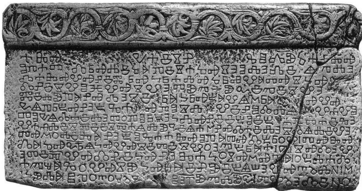
Slika 4. Bašćanska ploča. 88

Kralj DMITAR Zvonimir nije imao jednu prijestolnicu, već je povremeno boravio na više mjesta. Godine 1076. prijestolnica mu je bila u Biogradu, a između 1076. i 1078. u Kninu i Ninu. 87 Često ga se moglo vidjeti i u dvorcu na Solinskom polju. Narod pamti Zvonimira kao snažnog i poštenog vladara koji je uspješno rješavao sporove među ljudima. Poznat je po Bašćanskoj ploči, odnosno darovnici benediktincima iz samostana sv. Lucije na otoku Krku. Naime, Zvonimir je benediktinskim redovnicima dao zemlju za izgradnju crkve u Jurandvoru pokraj Baške na otoku Krku. O tome svjedoči darovnica napisana na kamenu i to hrvatskim jezikom i glagoljskim pismom. Danas se čuva u Hrvatskoj akademiji znanosti i umjetnosti u Zagrebu.