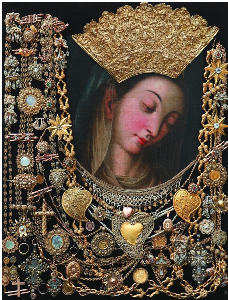
Slika 7. Čudotvorna slika Gospe Sinjske. 142

Gospa ih je čula. Sva u bilu pojavila se na gradskin zidinama, pogledala u svoje vjernike i ispružila ruku prema Turcima. Kažu da je odala po gradskin zidinama, a da su Turci počeli bižat, a neki da su umirali na mistu. Svit priča da je na njih poslala kugu, a meni ti je moja baba pričala da in je dala srdobolju i oni su ti se rabižali, a velik dio njih se utopijo u Cetini koja je onda naglo narasla. I nikad ti se više oni nisu u naš kraj vratili. 141