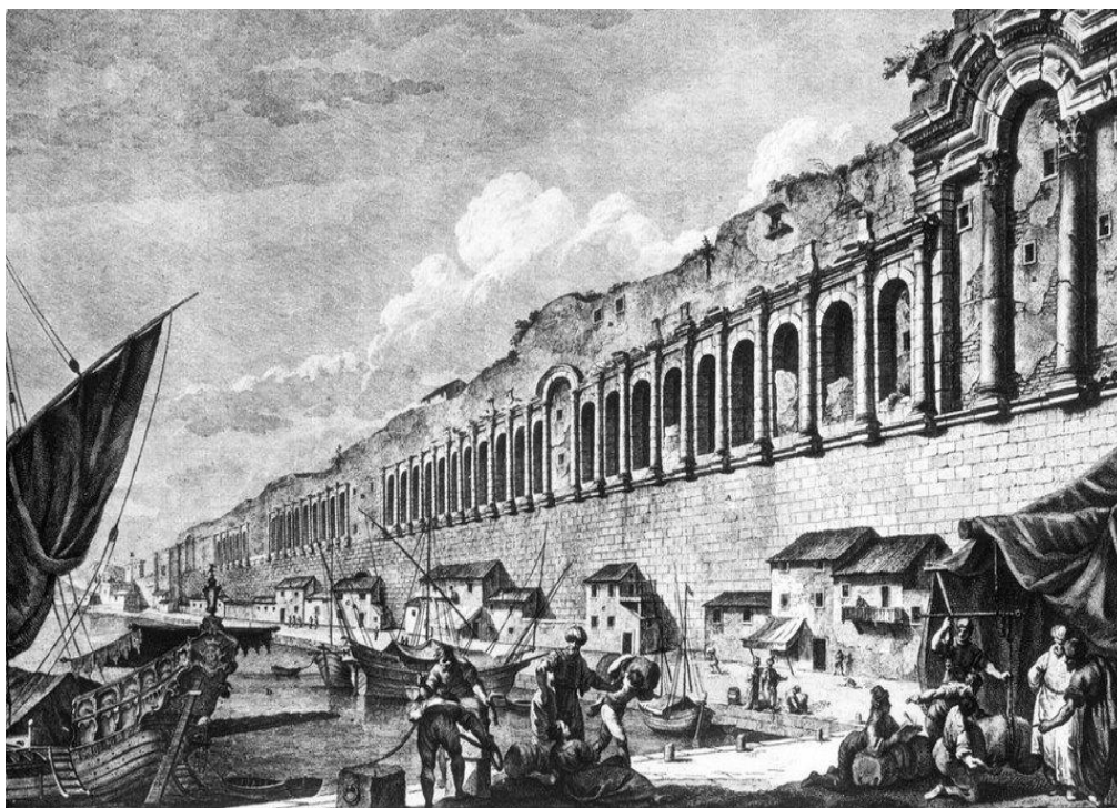
Slika 1. Dioklecijanova palača, pogled s morske strane, gravura R. Adama, 18. stoljeće. 26

rijetkih sačuvanih rimskih novčića koji su bili u opticaju za vrijeme njegove vladavine. Dioklecijan je u Hrvatskoj najpoznatiji po svojoj palači iz koje se razvio današnji Split, a koju je dao izgraditi u blizini nekadašnje rimske provincije Salone. Palača je služila kao ljetnikovac u koji je Dioklecijan dolazio kad ne bi morao boraviti u svojoj prijestolnici u Nikomediji (antički grad u današnjoj Turskoj). Nakon što se odrekao vlasti rimskog cara Dioklecijan je odlučio u palači provesti ostatak života. Živio je u njoj sve do svoje smrti koja se zbilila oko 313. Pretpostavlja se da je umro od bolesti, ali za to nema jasnih dokaza s obzirom na to da sarkofag s njegovim tijelom nije pronađen. Najvjerojatnije je bio pokopan unutar palače, u mauzoleju koji se kasnije prenamijenio u katedralu kršćanskog mučenika sv. Dujma.