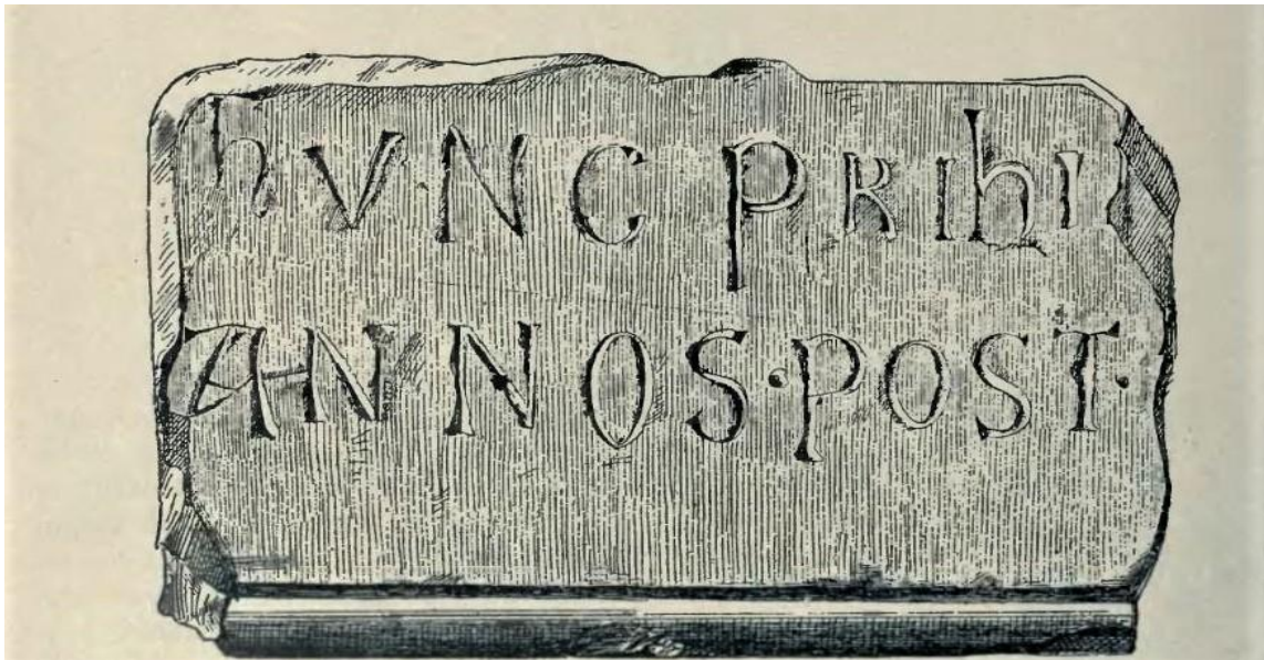
Slika 3. Odlomak natpisa na kamenu iz doba bana Pribine pronađenog na Kapitulju kod Knina (polovica 10. st.). 74

bio jedan od sinova Krešimira I. Odlučio je osvetiti bratovu smrt te je oko 970. pobijedio bana Pribinu u boju.