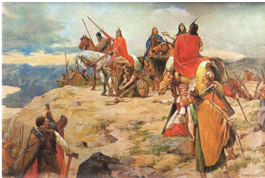
Slika 2. Dolazak Hrvata slikara Otona Ivekovića. 52

Bez obzira na to što povjesničari nisu postigli dogovor oko pitanja podrijetla Hrvata i njihova dolaska na prostor današnje domovine, sa sigurnošću se može reći da su određena slavenska plemena došla u Dalmaciju u 7. stoljeću nakon što su zajedno s Avarima osvojila Panoniju. Također se zna da su se ta plemena izmiješala s narodima koji su u Dalmaciji živjeli otprije. S vremenom su se plemena podijelila u više grupa, a hrvatsko se ime prvi put spominje na Trpimirovoj darovnici iz 852. 51 To, dakako, ne znači da su Hrvati stigli na ove prostore tek u 9. stoljeću.