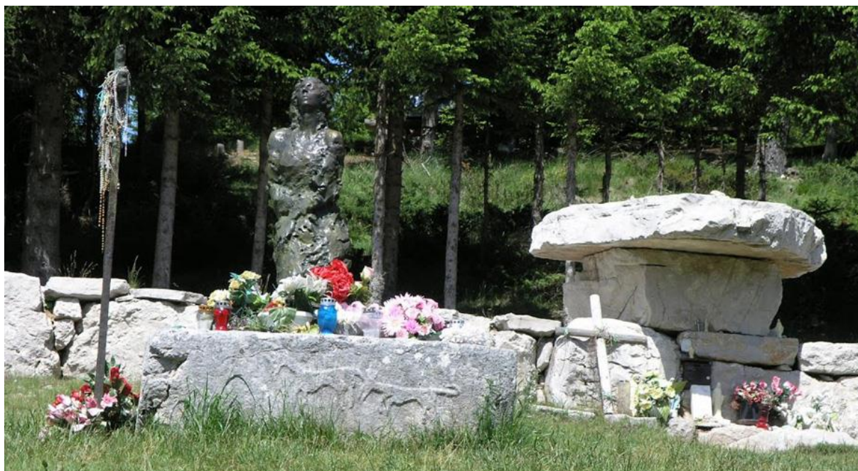
Slika 5. Spomenik Divi Grabovčevoj na Kedžari u Vranu (mjestu stradanja). 112

Na grob Dive Grabovčeve u Prozoru-Rami svake godine u mjesecu srpnju hodočasti velik broj ljudi. Početkom 20. stoljeća u njemu je hrvatski povjesničar i arheolog Ćiro Truhelka pronašao ženske kosti koje su vjerojatno pripadale Divi što je dokaz da je doista postojala.