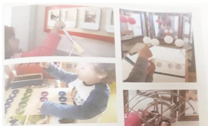
Slika 1. Prikaz materijala koji su ponuđeni djeci jasličke dobi (Jugović, 2016:14)

Odgojno-obrazovni proces s djecom jasličke dobi predstavlja veći izazov nego odgojno- obrazovni proces s djecom vrtičke dobi iz razloga što su njihove razvojne mogućnosti, najčešće, još slabije razvijene te imaju limitirana iskustva u odnosu na kronološku dob. Razlog tome se nalazi u nerazumijevanju dječjih sposobnosti te podcjenjivanju istih (Jugović, 2016, prema Slunjski, 2016). Stoga dolazi do restrikcije prostorno-materijalnog okruženja i poticaja za razvoj djeteta, a time se koči prirodni rast i razvoj samog pojedinca. Možemo zaključiti kako je potrebno promijeniti odgajateljevu viziju sposobnosti djeteta jasličke dobi te ponuditi poticajne materijale (Silić, 2007) i bolju prostorno-materijalnu opremljenost kako bi se postigao cjelokupan djetetov potencijal, što u konačnici zagovara i Nacionalni kurikulum.