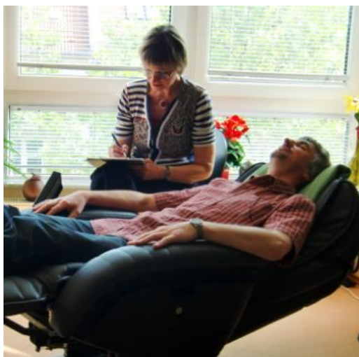
Slika 7. Bonny metoda – faza početno opuštanje pacijenta

Cilj Bonny metode je stvaranje vizualno-mentalne slike koje će stimulirati osjećaje pacijenta. Ovom se metodom kod pacijenta bude duboke emocije u relaksiranom stanju koje se mogu manifestirati kroz slikovne prikaze. Slikovne predodžbe kod pacijenata mogu se pojaviti u puno različitih oblika: vizualnih, pokretnih, zvučnih pa do njušnih prikaza. Oni mogu biti logični i razumni kao šetnja kroz šume, plivanje u kamenom bazenu, a mogu biti i nerazumni (apstraktni) te postati simbolični kao praćenje žute svjetlosti, lebdenje na leđima ptice i slično (Škrbina, 2013).