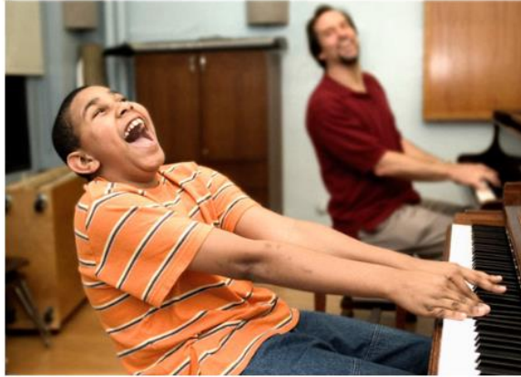
Slika 5. Individualna Nordoff-Robbinsonova glazboterapija (glazboterapija s dječakom koji svira klavir)