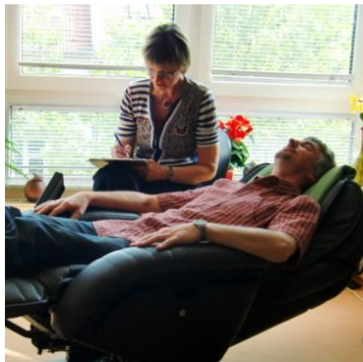
Slika 7. Bonny metoda – faza početno opuštanje pacijenta

Cilj Bonny metode je stvaranje vizualno-mentalne slike koje će stimulirati osjećaje pacijenta. Ovom se metodom kod pacijenta bude duboke emocije u relaksiranom stanju koje se mogu manifestirati kroz slikovne prikaze. Slikovne predodžbe kod pacijenata mogu se pojaviti u puno različitih oblika: vizualnih, pokretnih, zvučnih pa do njušnih prikaza. Oni mogu biti logični i razumni kao šetnja kroz šume, plivanje u kamenom bazenu, a mogu biti i nerazumni (apstraktni) te postati simbolični kao praćenje žute svjetlosti, lebdenje na leđima ptice i slično (Škrbina, 2013).