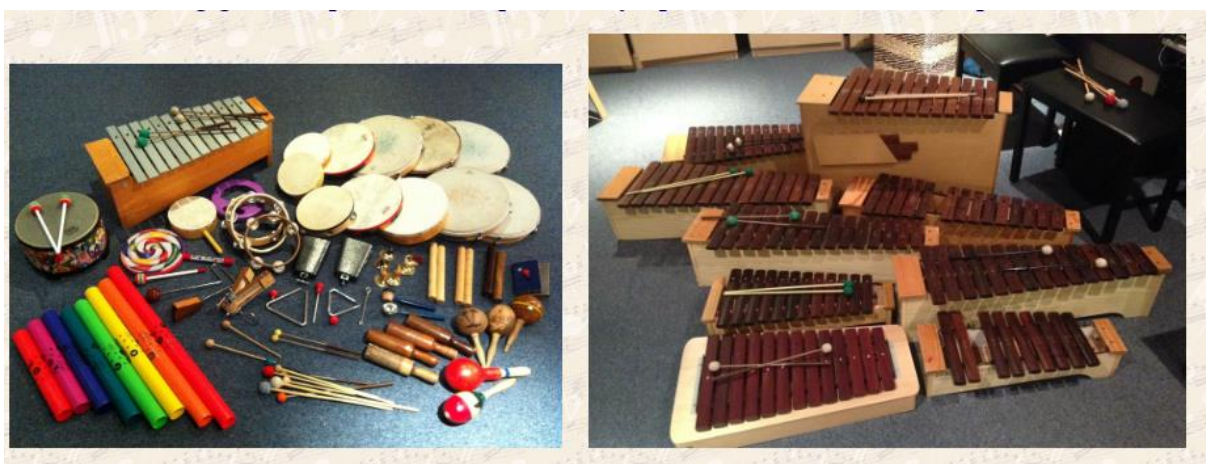
Slika 1. Orffov instrumentarij