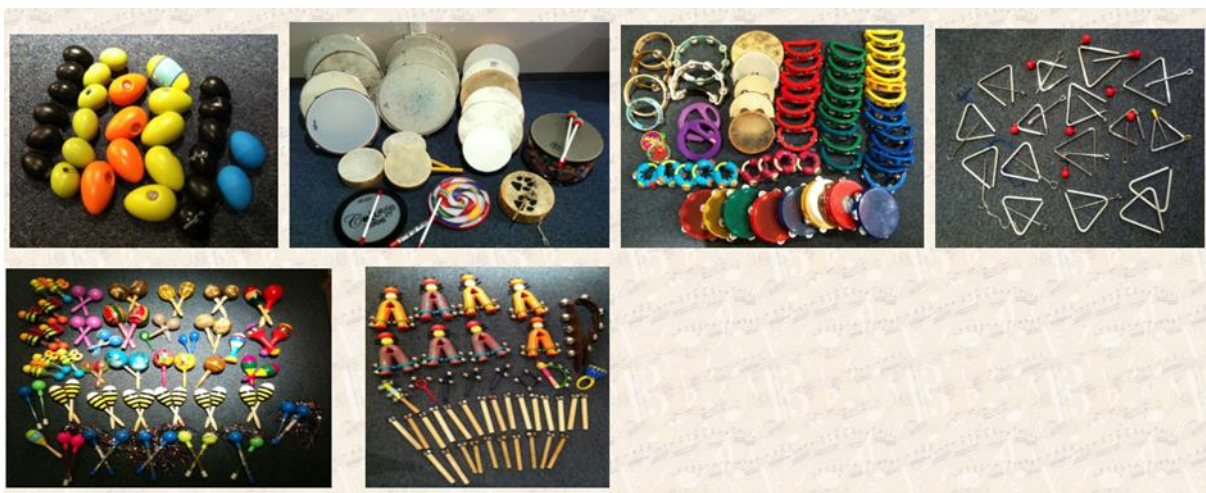
Slika 2. Glazbeni instrumenti Orffova intrumentarija