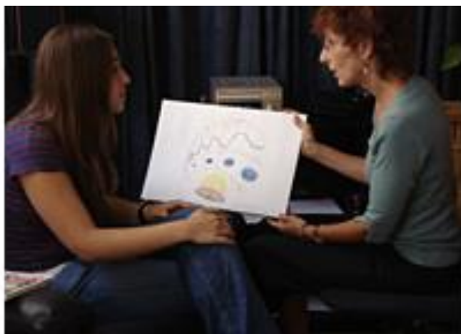
Slika 8. Primjer crteža kao produkt Bonny metode