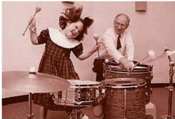
Slika 6. Individualna Nordoff-Robbinsonova glazboterapija (glazboterapija s djevojčicom koja svira bubnjeve)