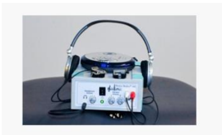
Slika 4. Musica Media aparatura