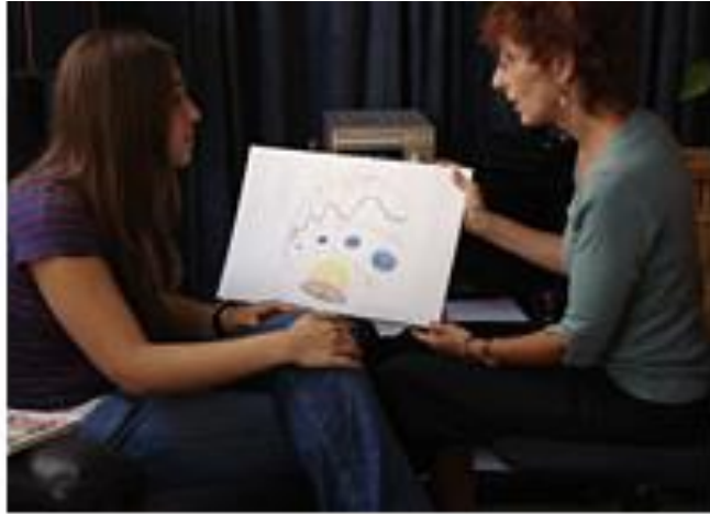
Slika 8. Primjer crteža kao produkt Bonny metode