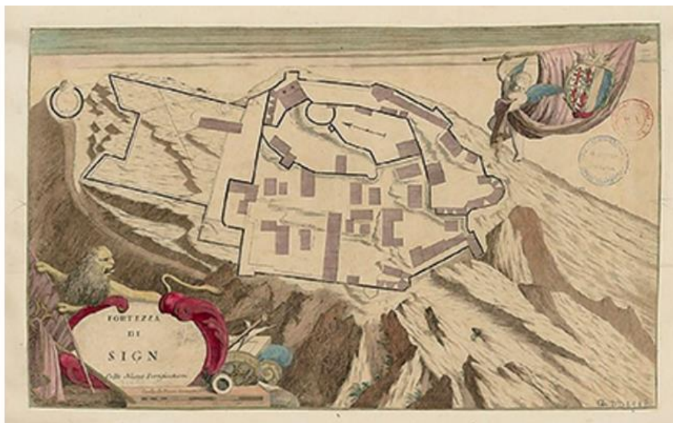
Slika 3 Mletački prikaz utvrde Sinj