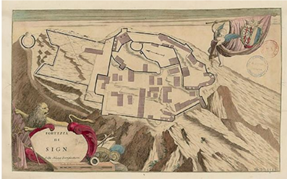
Slika 3 Mletački prikaz utvrde Sinj