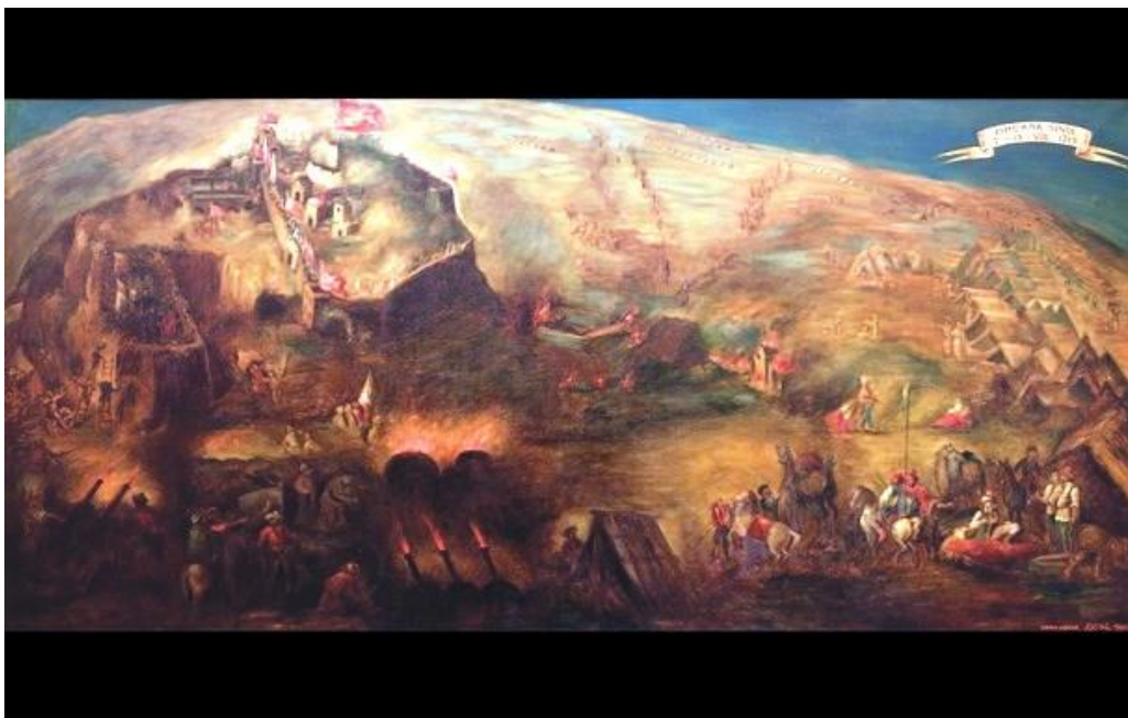
Slika 4 Prikaz opsade sinjske utvrde

održava u čast pobjede nad Osmanlijama. Tradicija je to koja traje već 305. godina i kao takva predstavlja jednu od najvrjednijih kulturnih manifestacija hrvatskog naroda.