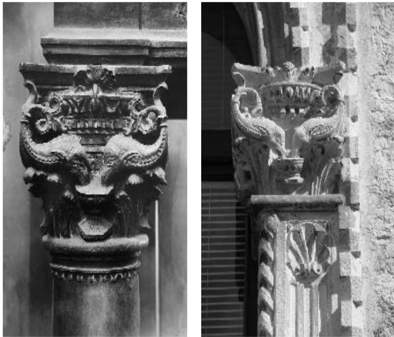
Slika 7. kapiteli na ciboriju u Korčuli i na velikoj monofori u kući Nassis u Zadru (Preuzeto: Vežić, P. (2016). Marko Andrijić i pročelje kuće Nassis u Zadru. Prilozi povijesti umjetnosti u Dalmaciji , 43 (1))

Na primjeru portala P. Vezić govori i o srodnom predlošku za sam okvir vrata. Portal oblikuje snažni okvir koji tvori prag s dvovratnicama i nadvratnikom. Dvovratnici u bazi zone imaju gustu klasičnu profilaciju s dentima u jednom redu, a na unutrašnjem brifu tordirani baston sa svojim amlenim kapitelom podno velikog kapitela na dvovratniku. Veliki kapitel u osnovi ima kockastu formu, a na njega naliže nadvratnik koji je rijedak u renesansnoj arhitekturi. Nadvratnik ima trokustasti oblik plitkog zabata, a po sredini se nalazi vijenac ispleten od listova. U krugu se nalazi grb obitelji Nassis. Kapiteli portala kuće u Zadru jednostavno su isti s onima na kući Papparčić, predložak je jednostavno isti, a modelacija vrlo slična. Uočljiva je i sličnost s kapitelima na trijemu klaustora samostana sv. Dominika u Dubrovniku.