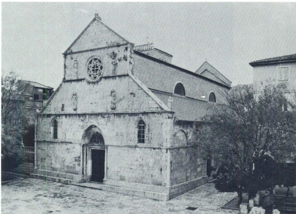
Slika 9. Zborna crkva Sv. Marije u Pagu (preuzeto: Hilje, E. (1989). Marko Andrijić u Pagu. Prilozi povijesti umjetnosti u Dalmaciji , 28 (1)

Novi Pag izgrađivan je pretežno tijekom druge polovine 15. i prve polovine 16. stoljeća primorsko je mjesto u kojem, unatoč materijalnoj oskudici, ostalo je znatnih tragova umjetničke djelatnosti, pretežno vezanih uz spomenike sakralne arhitekture i njihovu opremu, ali i onih sasvim porfirne namjene. Ta potreba za reprezentativnošću najviše je došla do izražaja pri gradnji zborne crkve sv. Marije.