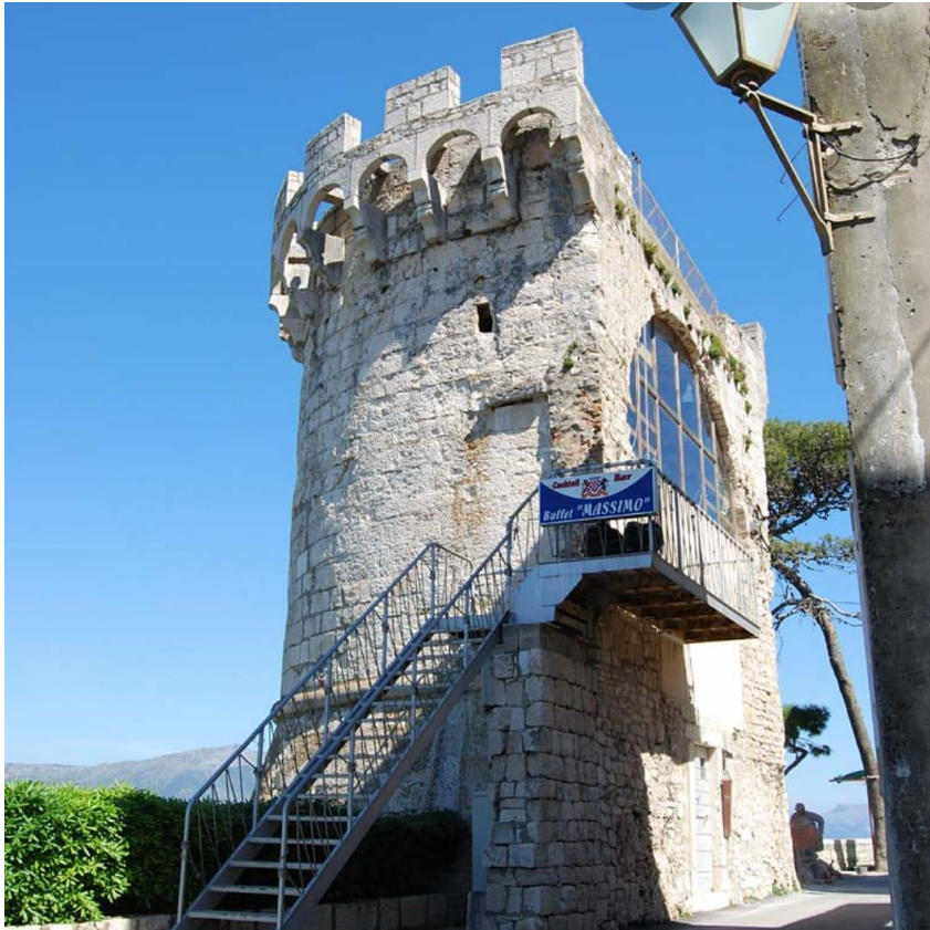
Slika 1. Kula Berim

protomagistra Andrijića grade polukružne kule Bokar i Berim, dva okrugla bastiona, kula kod Svih Svetih te Velika kneževa kula.