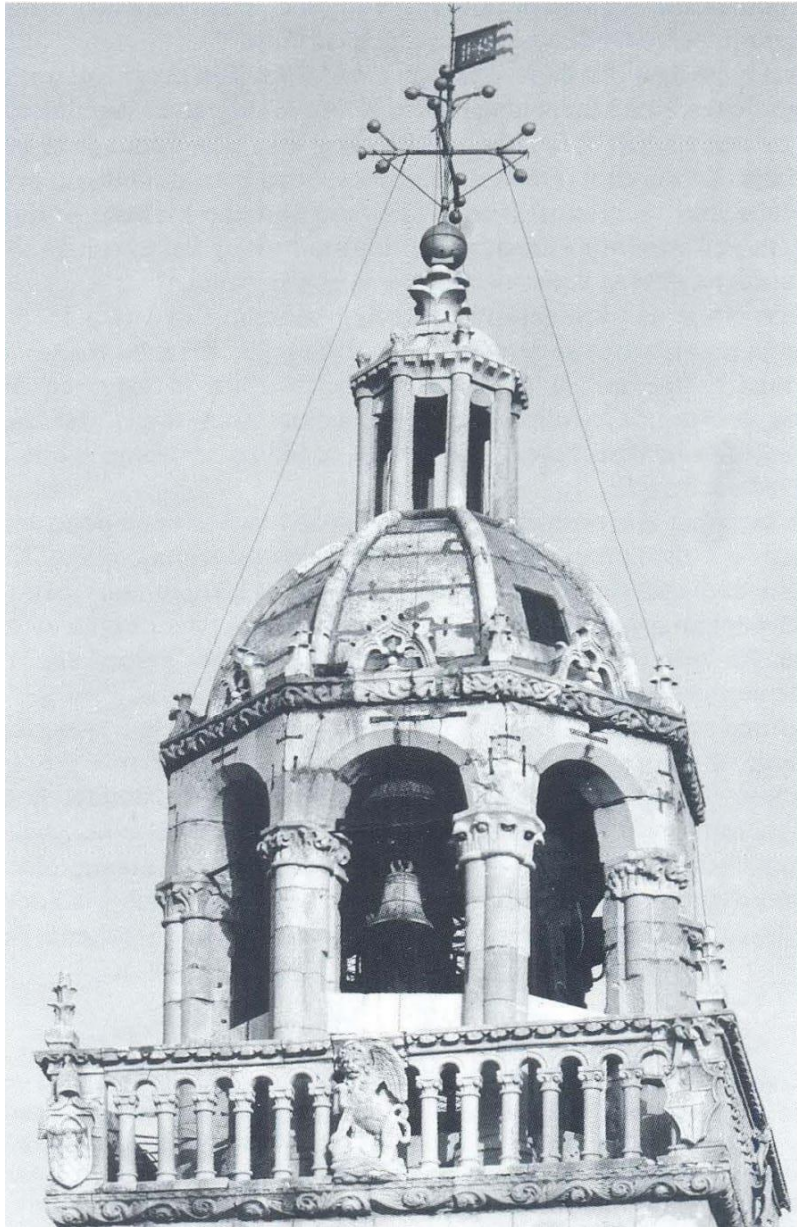
Slika 2. Vrh zvonika katedrale Sv. Marka