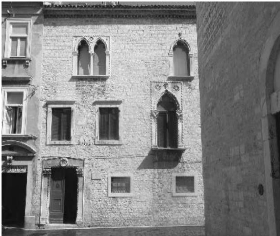
Slika 6. Pročelje kuće Nassis u Zadru (Preuzeto: Vezić, P. (2016). Marko Andrijić i pročelje kuće Nassis u Zadru. Prilozi povijesti umjetnosti u Dalmaciji , 43 (1)

srodne onima na nadbiskupskoj palači koju rese kasnogotički i ranorenesansni ornamenti, potonji osobito na menzoli. Pavuša Vezić 1979. godine piše o obnovi kuće Nassis te uspoređuje kapitule s delfinima s njezine velike monofore s onima iz radionice Marka Andrijića.