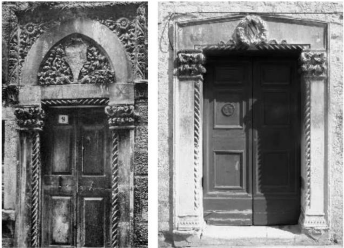
Slika 8. Portali na kući Paparčić i na kući Nassis u Zadru

Pročeljem kuće Nassis dominira velika monofora s balkonskim istakom pod kojim je menzol s festonom koji nose dva krilata puta. Pročelje na drugom katu rastvaraju bifora i mala monofora. Ispod abakom je uski profil s takozvanim dijamantnim nizom, čestim motivom arhitektonske plastike u kasnoj gotici kojeg nalazimo i u Korčuli. Na biforama pronalazimo malene kugle na trilobatima, a sličan motiv nalazimo na katedrali u Korčuli i na trifori palače Divona u Dubrovniku. Ostali motivi možda više predstavljaju opće značajke arhitektonske plastike XV. stoljeća nego li posebnost njegove radionice, ali ih ona koristi. Kugle kao ukras na ornamentima prozorskih luneta i dijamantni nizovi na kapitelima su primjer toga. Međutim, najveća razlika između arhitektonske plastike kuće u Nassis i onih na većini Andrijićevih djela u Korčuli i Dubrovniku predstavlja gustoća skulptorskog ukrasa, profila i biljnih ukrasa. Na jugu Dalmacije tih je ukrasa primjetno više. Arhitektonska plastika na njegovim zgradama podržava manje kićena rješenja. Stječemo dojam da su i „gotički ornamenti u funkciji renesanse pročišćenosti arhitektonskog djela“. P. Vežić zaključuje da se