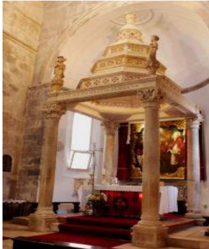
Slika 4. Ciborij korčulanske katedrale

kršćana za Kristom. U središtu je prikaz kaleža koji je simbol euharistije. Nadalje, harpija s tijelom ptice, a glavom žene simbolizira borbu dobra i zla. Mješovit stil renesanse u gornjem i gotike u donjem dijelu kompozicije opravdava antičke-poganske motive. Po preciznosti i ljepoti izvedbe korčulanski kapiteli nadmašuju sve slične dalmatinske primjere i sigurno ih je isklesala ruka samoga majstora Marka. 21