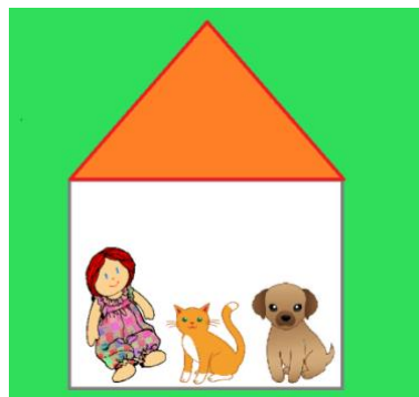
Slika 9. do mačkice pas