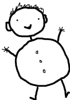
Slika 11. Primjer grafičkog prikaza Jožice

Točka, točka, točkica, gotova je glavica, meke uši, mali vrat, trbuh mu je kao sat, male ručice, male nožice, evo našega Jožice.