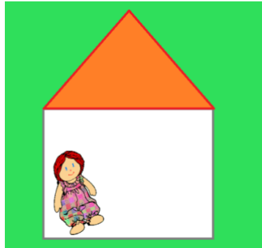
Slika 7. u kućici lutkica