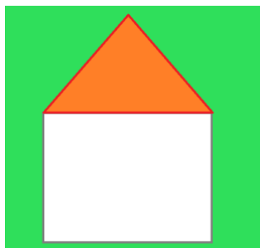
Slika 6. Ima jedna kućica