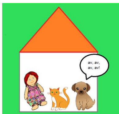
Slika 10. koji laje u sav glas av, av, av, av.