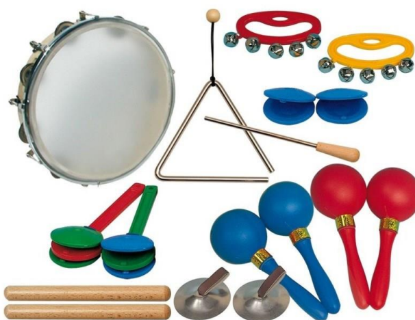
Slika 8. Orffov instrumentarij (Music Shop Etida, bez dat.)

Glazba smiruje, zabavlja i razveseljava djecu (Hansen, Kaufmann i Burke Walsh, 2006). Također, djeca sama često spontano stvaraju glazbu, a Orffovim instrumentima (sl. 8.) stvaranje glazbe djeci je još više približeno. Ako SDB nema prostor za centar za glazbu, ona se može ukomponirati u druge centre jer glazba stvara ugodno ozračje u prostoriji i popravljiva atmosferu u njoj. Odgajatelji bi mogli, ako nemaju pristup pravim instrumentima poput Orffovih instrumenata (Slika 8.), raditi instrumente od raznih materijala s djecom, primjerice šuškalice napraviti s rižom u bocama ili puhačke instrumente cijevima ili plastičnim bocama. Kako bi djeca mogla što bolje razlikovati zvukove instrumenata, odgajatelji bi mogli uvoditi instrumente malo po malo, kroz razne načine poput slušanja nekih skladbi i sl.