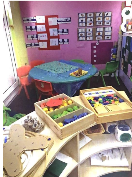
Slika 4. Dječji vrtić Limač , Zagreb. (Slunjski, 2006: 97)