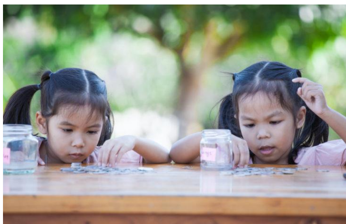
Slika 2. Usporedna igra

Prema autoricama Starc i sur. (2004), postoji sedam društvenih razina dječje igre. Prva je razina promatranje tijekom kojega djeca promatraju igru bez uključivanja u nju. Druga je razina samostalna igra u kojoj se dijete igra samo bez interakcije s drugom djecom. Sljedeća je razina usporedna igra (Slika 2.) u kojoj se djeca igraju sa istim ili sličnim materijalima ili igračkama jedni pored drugih, ali ne i zajedno.