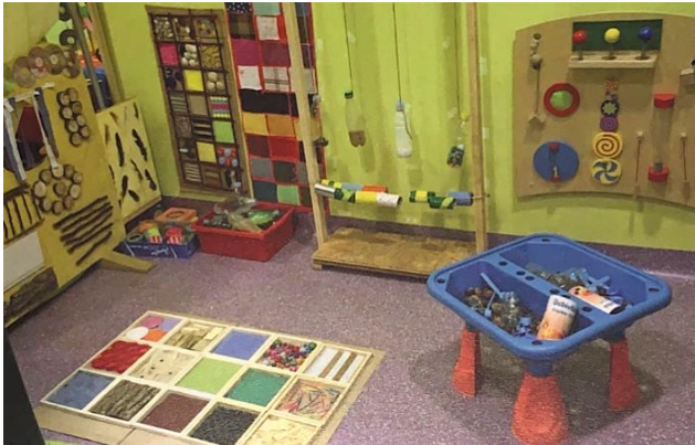
Slika 3. Dječji vrtić Čarobna Šuma , Križevci. (Slunjski, 2006: 93)

potrebno izložiti u razini njihovih očiju. Dakle, okruženje bi trebalo biti što urednije i primamljivije djeci čime se utječe na smanjenje negativnog ponašanja, potiče veselje, što je primjereno prikazano na slikama 3. i 4.