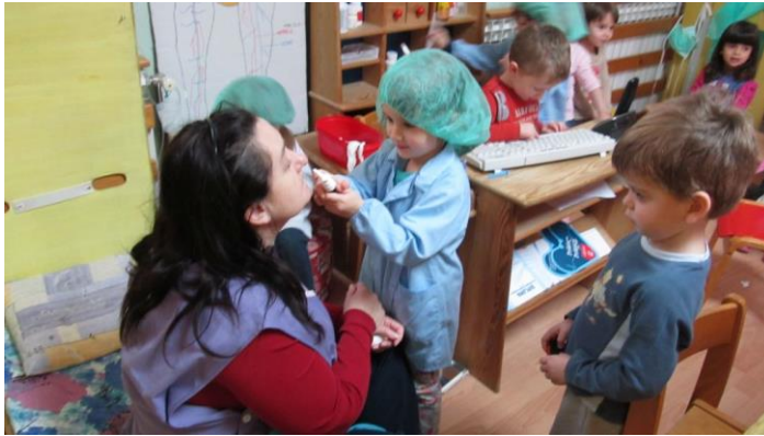
Slika 1. Simbolička igra liječnika (Dječji vrtić Smiješak , 2014)

Posljednja spoznajna razina igre jesu igre s pravilima u kojima se, kao što samo ime kaže, djeca igraju igara koje imaju već poznata pravila i razna ograničenja (Starc i sur., 2004). Postoji nekoliko vrsta igara s pravilima– narodne, pokretne te didaktičke (Pribela-Hodap, 2011).