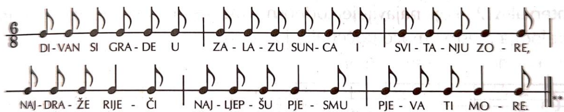
Slika 5. Primjer govorene brojlice (Jurišić i Sam Palmić, 2002: 23)