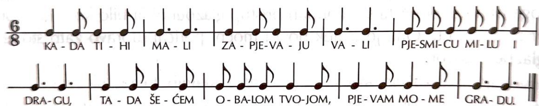
Slika 4. Primjer govorene brojlice (Jurišić i Sam Palmić, 2002: 22)

Govorena brojlica se odvija od početka do kraja na istom tonu, a za izgovaranje riječi na istom tonu možemo kazati da su oglašbljene riječi. Govorena brojlica je snažan intelektualan i glazbeni poticaj jer ona može dijete ispuniti zadovoljstvom s obzirom da uvijek odiše ritmičkom svježinom i bogatstvom riječi (Jurišić i Sam Palmić, 2002).