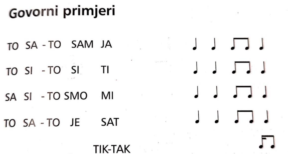
Slika 1. Govorni primjer brojalice (Šmit, 2001: 83)

Glazbena terapija za mucanje može se provoditi grupno i individualno. Kod grupne terapije, prva faza je slušanje glazbe po izboru većine (uglazbljene priče, dječji zborovi, plesne melodije, menueti, koračnice i dr.) u svrhu relaksacije i izjednačavanja ritma disanja te stimuliranja razgovora o određenoj temi. U drugoj fazi izvodi se ritam udaraljka uz pjevanje. U individualnoj terapiji ponavlja se tema o kojoj se razgovaralo u grupi, kao i samostalno izvođenje ritma i pjesme zajedno. U ovoj fazi vrši se korekcija artikulacije, fonacije i disanja, intenziteta i melodičnosti govora. U svrhu mišićnog opuštanja može se provesti metoda signalnog treninga u kombinaciji s glazbom kao signalom (Breitenfeld i Majsec-Vrbanić, 2008).