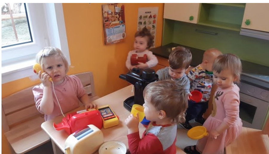
Slika 3. Što se u vrtiću radi? ( https://dvc-mali-losinj.hr/sto-se-u-vrticu-radi/ )

Prihvatanje, odnosno odbijanje vršnjaka ovisi o stupnju simpatije i sviđanja (Jukić Talaja, 2008). U vršnjačkim interakcijama odgojne skupine moguć je razvoj specifičnog socijalnog statusa djeteta. Prema tome, autori NewComba i Bukowskog razlikuju odbačeno (ima mnogo negativnih nominacija od strane vršnjaka), izolirano (ima malo negativnih i pozitivnih nominacija), kontroverzno (ima mnogo pozitivnih i negativnih nominacija) i zvijezda djeteta (ima mnogo pozitivnih nominacija od strane vršnjaka) (Jukić Talaja, 2008). Kvalitetan odgajatelj svojim poticajima usmjerava na inkluziju kao jednakopravno sudjelovanje svih i izgrađivanju kvalitetnih i recipročnih odnosa.