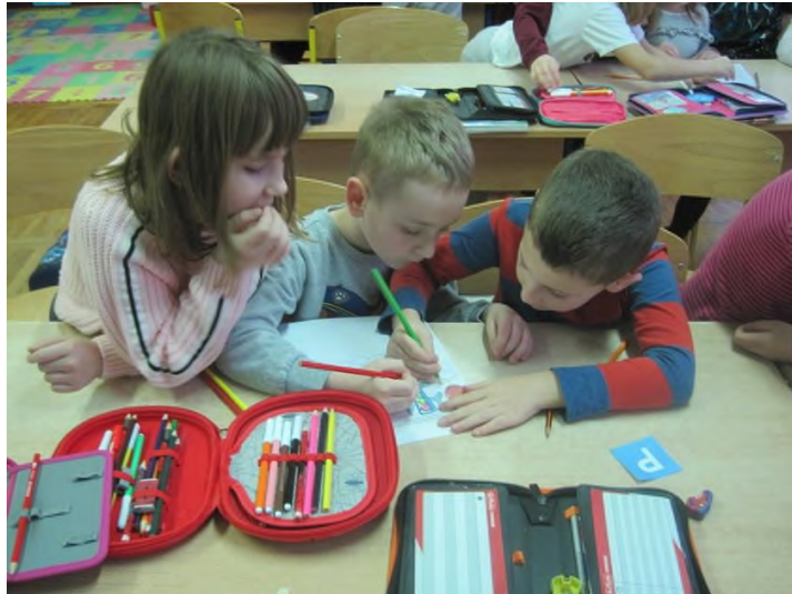
Slika 2. Učimo s prijateljima ( https://vraptic-djecji-vrtic.hr/ucimo-s-prijateljima/ )

Prihvatanje, odnosno odbijanje vršnjaka ovisi o stupnju simpatije i sviđanja (Jukić Talaja, 2008). U vršnjačkim interakcijama odgojne skupine moguć je razvoj specifičnog socijalnog statusa djeteta. Prema tome, autori NewComba i Bukowskog razlikuju odbačeno (ima mnogo negativnih nominacija od strane vršnjaka), izolirano (ima malo negativnih i pozitivnih nominacija), kontroverzno (ima mnogo pozitivnih i negativnih nominacija) i zvijezda djeteta (ima mnogo pozitivnih nominacija od strane vršnjaka) (Jukić Talaja, 2008). Kvalitetan odgajatelj svojim poticajima usmjerava na inkluziju kao jednakopravno sudjelovanje svih i izgrađivanju kvalitetnih i recipročnih odnosa.