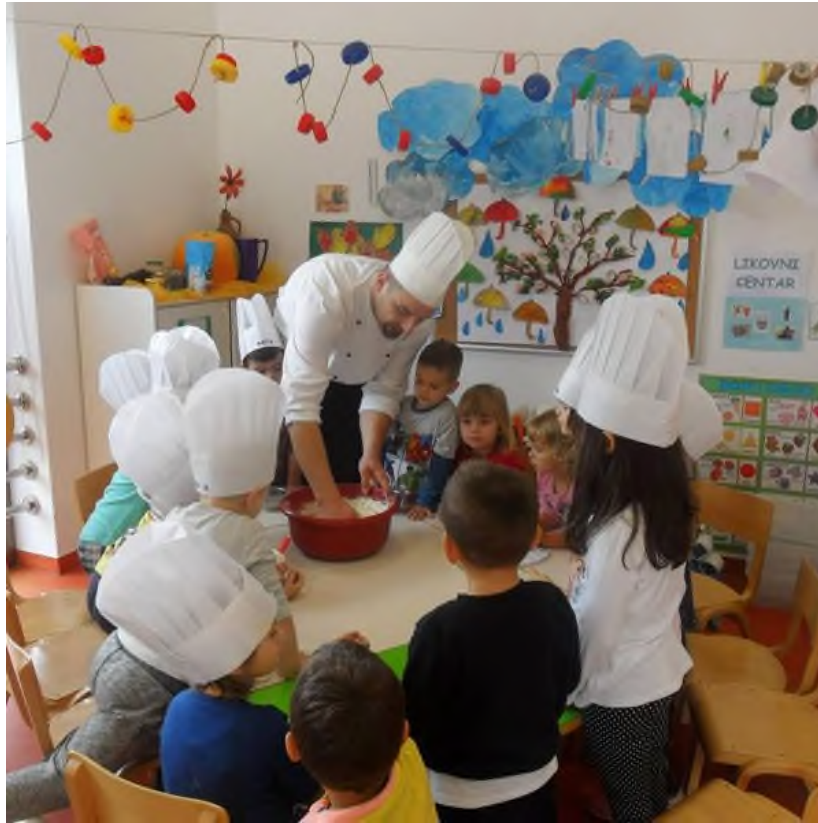
Slika 4. Suradnja s roditeljima ( https://zlatnaribica.hr/suradnja-s-roditeljima/ )

Roditelj tako može vidjeti djetetove mogućnosti, sposobnosti, znanja i ponašanja koja, moguće, u obiteljskom okruženju nema priliku vidjeti. Također, roditelj može vidjeti odgajateljev odnos prema djetetu. Roditelj tako stječe povjerenje u osobe kojima povjerava svoje dijete. Kada se roditelj uključi u suradnju, on stekne povjerenje u ljude koji se brinu o njegovu djetetu i tada suradnja prelazi u partnerstvo. Partnerstvo podrazumijeva da se roditelji i odgajatelji dogovaraju te dijele uloge u radu u vrtiću i kod kuće. Za suradnju i dobar odnos između roditelja i odgajatelja potrebna je iskrena i otvorena komunikacija, empatija, međusobno uvažavanje, zajedničko donošenje odluka, planiranje, suglasnost, razmjena informacija te odsutnost etiketiranja (Kunstek, 2007). Prema Američkom udruženju za rani odgoj (NAEYC, 1989) te prema Konvenciji o pravima djece (1989), postoji određeni kodeks prema kojemu se odgajatelji trebaju ponašati prema roditeljima. Kodeks naglašava kako odgajatelji trebaju poštivati kulturu, vjerovanje i običaje svake obitelji jer nepoštivanje različitosti označuje nepoštivanje svakog djeteta kao individue. Kada bi djeca osjetila da njihovi roditelji nisu dobrodošli u vrtić, to bi zasigurno utjecalo na njihovu prilagodbu i kvalitetu boravka u odgojnoj skupini (Slunjski, 2008). Odgajatelji trebaju uvažavati prava i odluke roditelja jer time iskazuju poštovanje i stječu povjerenje roditelja. Roditelji trebaju