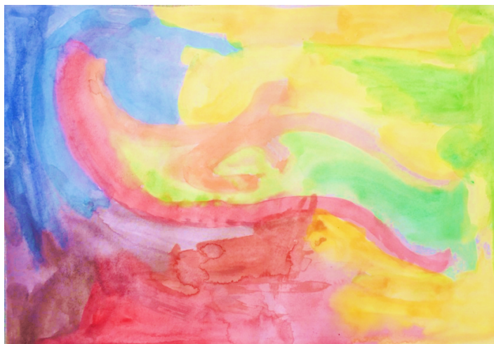
Slika 15. Dječak Š. Ć. (7 g.)

Djevojčica je slušajući glazbu tehnikom akvarel naslikala velika usta koja zauzimaju veći dio površine papira. Glazbena kompozicija podsjetila je djevojčicu V. V. na osmijeh koji je uspješno likovno prikazala. Kružnim linijama se suprotstavljaju oštre, ravne linije koje prikazuju zube. Likovni uradak bogat je bojama, na nekim dijelovima boja se ritmički ponavlja. Na slici se prikazuje toplo hladni kontrast u spontanoj snažnoj kružnoj kompoziciji.