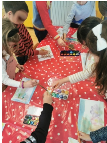
Fotografija 1: Grupa djece slika tehnikom akvarel uz glazbenu podlogu

Općeniti sentiment kod djece prema samoj klasičnoj glazbi od prvoga trenutka je iznimno pozitivan. Djeca su se kontinuirano veselila samim planiranim aktivnostima, a taj osjećaj su na neki način vezali uz klasičnu glazbu.