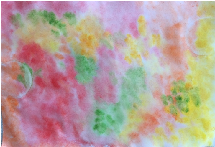
Slika 6. Djevojčica N. B. (4,5 g.) „Leptirova krila“

Nova skladba koju su djeca slušala bila je skladba sporoga tempa u dur tonalitetu – „Träumerei“. I na tu skladbu djeca su reagirala figurativnim i apstraktnim likovnim izričajem.