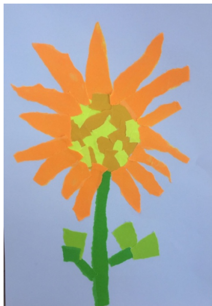
Slika 7. H. C. (7 g.) „Sunčani cvijet“

U priloženom radu djevojčica je tehnikom kolaž kroz cvijet prenijela svoj doživljaj slušanja glazbe sporijega tempa u durskom rodu. Latice u kružnom ritmu formiraju gradaciju jer se kreću od manjih prema većima i obrnuto. Sama sredina cvijeta je analitički obrađena izmjenom različitih nijansi žute boje. Cvijet čini simetričnu cjelinu, prisutan je toplo-hladni kontrast, ali uz dominaciju toplih i žarkih boja. Iako je ritmički slažući plohe dijete ostvarilo slikarsku teksturu, sam prikaz cvijeta mogao je biti kreativniji.