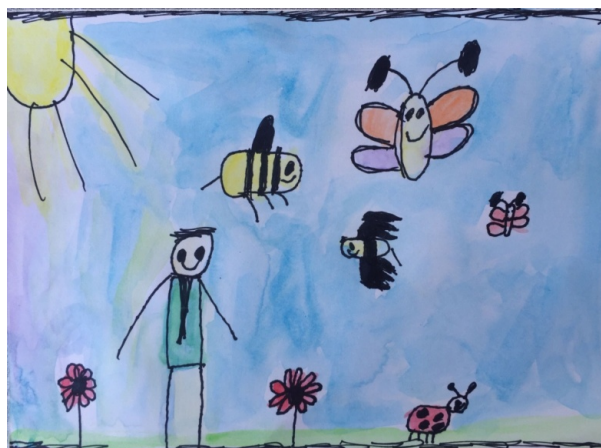
Slika 12. Dječak M. V. (6,5 g.) „Livada“

Djevojčica je ovim crtežom prikazala svoj doživljaj skladbe. Kako u slušanoj skladbi, tako i u njezinu crtežu dominira klavir. Crtež je izrađen u poliperspektivi. Djevojčica koristi sve boje spektra. Primjećuje se toplo-hladni i komplementarni kontrast. Na crtežu nema dubine, odnosno sve je plošno, a crtež je linijski izražen. U radu prevladavaju linije po toku i plohe različitih oblika.