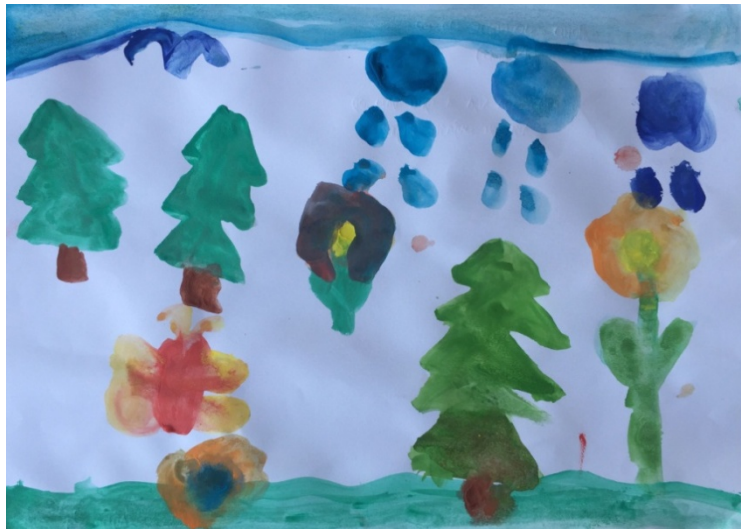
Slika 16. Djevojčica H. C. (7 g.) „Kiša i borovi“

Zadnja glazbena kompozicija bila je skladba sporoga tempa u mol tonalitetu „Armes Waisenkind“. Kao i na ostale skladbe, djeca su na nju reagirali likovnim izražavanjem.