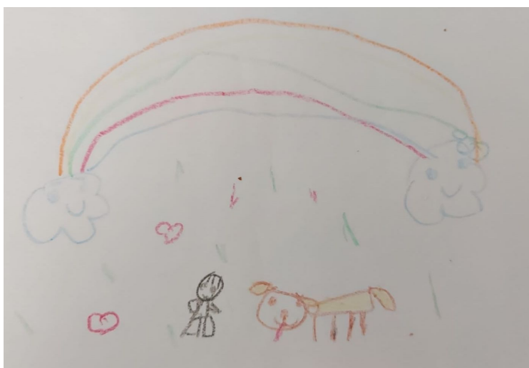
Slika 18. Djevojčica S. O. P. (6 g.) „Moj pas i ja u oblacima“

Slikarskom tehnikom tempera dječak je prikazao doživljaj same skladbe na način da je jednu galaksiju s pripadajućim planetima napravio tehnikom otiskivanja dok je samo sunce naslikao nježnim pokretima kista. Slobodno koristi različite načine nanošenja boje što na slici ostavlja različite slojeve same boje, od lazurne do impasto namaza čime uspješno ostvaruje teksturu. Slikom dominiraju hladne boje. Na slici je uočljiv kontrast i ritam boje u zanimljivoj vodoravnoj kompoziciji.