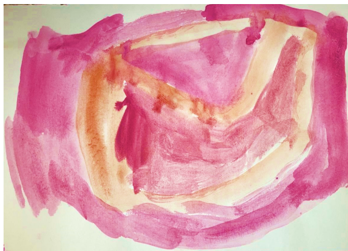
Slika 19. Djevojčica V. V. (5 g.)

Djevojčica kao izražajno sredstvo za svoj rad bira tehniku pastel. Na radu nema obojenih površina. Ljudska figura je nacrtana akromatskom bojom, dok su ostali elementi u različitim bojama spektra. U prikazu prostora uočljiva je ikonografska perspektiva posebno u prikazu psa. Također se uočava i prostor u frizu. Interesantno je da je ovdje djevojčica u igri sa svojim psom koji je nedavno uginuo. Sama molska skladba je u djetetu razvidno probudila sjetne emocije i sjećanje na uginuloga psa.