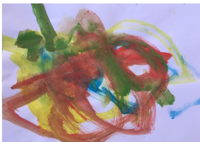
Slika 3. Dječak F. M. (4 g.) „Glazba leti“

U Slici 2. djevojčica se odlučila za figurativni prikaz. Kao doživljaj glazbene kompozicije prikazala je kuću pored mora, skakaonicu i ležaljke. Dječji uradak sastoji se od geometrijskih i slobodnih likova koji su postavljeni na način da čine gotovo simetričnu cjelinu. Odmak od simetrije čini veliki crveni lik koji predstavlja svojevrsnu dominantu jer je potpuno različit od ostalih likova bojom i oblikom. U radu je spontano izražena ravnoteža i ritam. Djevojčica L. P. koristila je sve raspoložive boje kolaža, a na njezinu radu dominante su tople boje. S obzirom na dob likovni prikaz ploha mogao je biti bolje izražen.