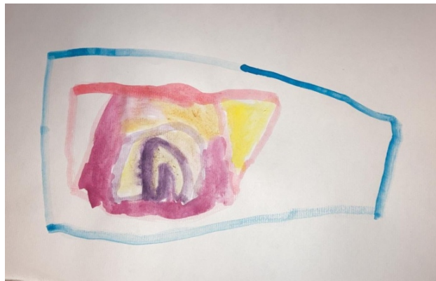
Slika 9. Djevojčica V. V. (5 g.) „Duga“

Ovaj rad kreiran je crtačkom tehnikom flomaster. Kontrast je akromatski. U mogućnosti biranja tehnika i boja, djevojčica je izabrala flomaster jer je htjela spojiti lik mačke s izgledom klavira. U ovom crtežu valja naglasiti izvrsnu proporcionalnost te čistoću linija i oblika, ali i smještenost u prostoru. Disproporcionalnost u prikazu ogleda se samo u glavi mačke. Djevojčica je šarama na leđima mačke postigla izgled crnih tipki na klaviru. Glava mačke mogla je biti kreativnije izvedena jer podsjeća na učestale prikaze tog motiva kod djece. Uočava se vještina u tehnici flomastera te uspješno korištenje crta i ritmičkih ploha.