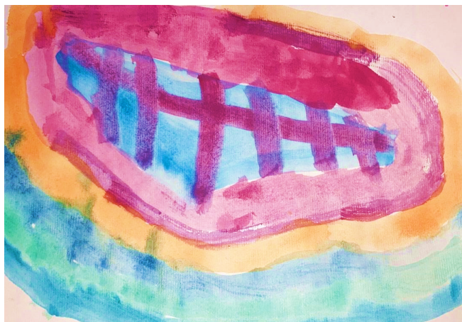
Slika 14. Djevojčica V. V. (5 g.) „Osmijeh“

Djevojčica je slušajući glazbu tehnikom akvarel naslikala velika usta koja zauzimaju veći dio površine papira. Glazbena kompozicija podsjetila je djevojčicu V. V. na osmijeh koji je uspješno likovno prikazala. Kružnim linijama se suprotstavljaju oštre, ravne linije koje prikazuju zube. Likovni uradak bogat je bojama, na nekim dijelovima boja se ritmički ponavlja. Na slici se prikazuje toplo hladni kontrast u spontanoj snažnoj kružnoj kompoziciji.