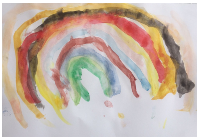
Slika 10. Dječak A. B. (4,5 g.) „Moja duga“

Djevojčicu je glazba sporoga tempa inspirirala da tehnikom akvarel naslika dugu. Na slici vidimo u centralnom dijelu tople boje, koje uokviruje linija hladne plave tvoreći jednu zatvorenu cjelinu. Na slici je također prisutna degradacija čistih boja. Bogatstvo boja moglo je biti bolje izraženo.