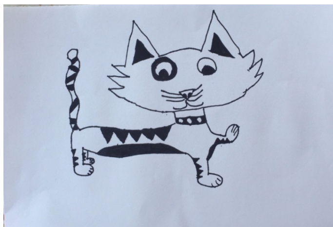
Slika 8. Djevojčica V. B. (6,5 g.) „Mačka“

U priloženom radu djevojčica je tehnikom kolaž kroz cvijet prenijela svoj doživljaj slušanja glazbe sporijega tempa u durskom rodu. Latice u kružnom ritmu formiraju gradaciju jer se kreću od manjih prema većima i obrnuto. Sama sredina cvijeta je analitički obrađena izmjenom različitih nijansi žute boje. Cvijet čini simetričnu cjelinu, prisutan je toplo-hladni kontrast, ali uz dominaciju toplih i žarkih boja. Iako je ritmički slažući plohe dijete ostvarilo slikarsku teksturu, sam prikaz cvijeta mogao je biti kreativniji.