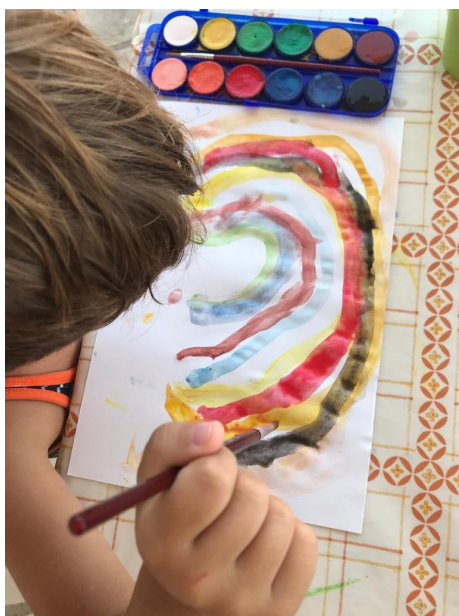
Fotografija 3: Dječak A. B. (4,5 g.) slika dugu