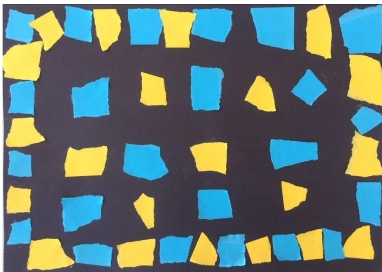
Slika 1. Dječak T. Č. (7 g.) „Svemir“

Klasičnu glazbu Roberta Alexandra Schumanna bez obzira na različite glazbene kompozicije okarakterizirali smo kao jedan slučaj unutar kojega smo u likovnim radovima promatrali dvije jedinice analize – bogatstvo izražavanja likovnim i kompozicijskim elementima i utjecaj tempa i tonskoga roda na likovni izričaj. Djeca su najprije slušala skladbu brzoga tempa u dur tonalitetu: „Fröhlicher Landmann“. Djeca su mogla sama izabrati likovnu tehniku te način likovnoga izražavanja – apstraktni ili figurativni.