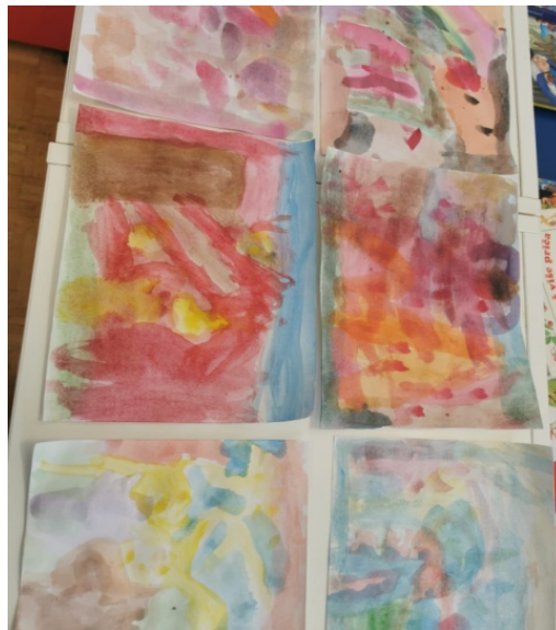
Fotografija 2: Kolekcija crteža nastalih tijekom istraživanja