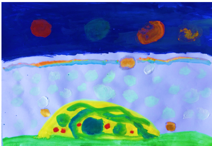
Slika 17. Dječak I. J. (5,5 g.) „Sunce u galaksiji“

Slikarskom tehnikom tempera dječak je prikazao doživljaj same skladbe na način da je jednu galaksiju s pripadajućim planetima napravio tehnikom otiskivanja dok je samo sunce naslikao nježnim pokretima kista. Slobodno koristi različite načine nanošenja boje što na slici ostavlja različite slojeve same boje, od lazurne do impasto namaza čime uspješno ostvaruje teksturu. Slikom dominiraju hladne boje. Na slici je uočljiv kontrast i ritam boje u zanimljivoj vodoravnoj kompoziciji.