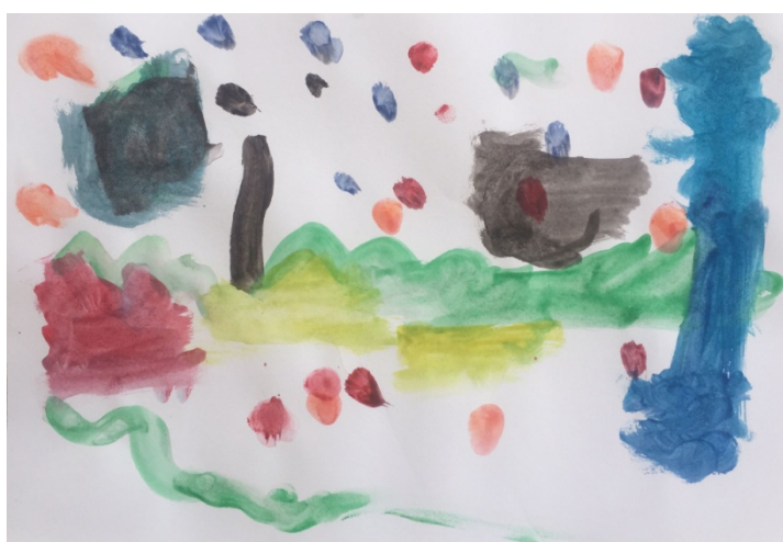
Slika 20. Dječak P. M. (6,5 g.)

Djevojčica je koristeći tehniku akvarel svoj doživljaj glazbe izrazila apstraktnom formom koristeći nijanse toplih boja. Meki kružni oblici se radijalno šire, lazurno prelaze iz jedne nijanse u drugu. Kružna kompozicija ostvarena je spontano.