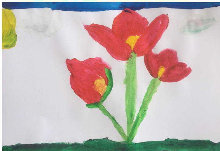
Slika 5. Djevojčica V. B. (6,5 g.) „Cvijeće“

Djevojčica je tehnikom tempere naslikala cvijeće koristeći primarno komplementarni kontrast crveno-zeleni. Na slici dominira simetrična kompozicija koja se uočava kod pravilno raspoređenih cvjetova i oblika. Boju nanosi u gustim slojevima (na slici se pojavila tekstura) koristeći pravilno tehniku tempere, a oblike zorno prikazuje vodeći računa o detaljima. Izbor boja mogao je biti bogatiji.