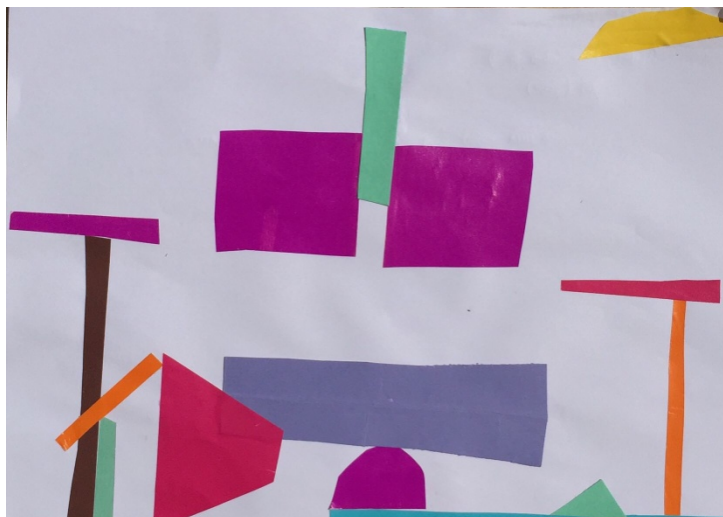
Slika 2. Djevojčica L. P. (6,5 g.) „Kuća pored mora“

U Slici 2. djevojčica se odlučila za figurativni prikaz. Kao doživljaj glazbene kompozicije prikazala je kuću pored mora, skakaonicu i ležaljke. Dječji uradak sastoji se od geometrijskih i slobodnih likova koji su postavljeni na način da čine gotovo simetričnu cjelinu. Odmak od simetrije čini veliki crveni lik koji predstavlja svojevrsnu dominantu jer je potpuno različit od ostalih likova bojom i oblikom. U radu je spontano izražena ravnoteža i ritam. Djevojčica L. P. koristila je sve raspoložive boje kolaža, a na njezinu radu dominante su tople boje. S obzirom na dob likovni prikaz ploha mogao je biti bolje izražen.