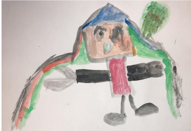
Slika 4. Djevojčica V. V. (5 g.) „Moja majka“

Dječak F. M. u potpunosti pokretima kistom i tijelom prati tempo skladbe. Potpuno uživljeno sudjeluje u slušanju glazbene kompozicije. Tehnikom akvarel kombinira tople i hladne nijanse boja te spontano stvara kružnu kompoziciju. Slikao je spiralno, krenuvši od centra kružno širi linije kistom raznobojno prema rubu papira. Dijete koristi bogato boju kao liniju što odgovara uzrasnoj dobi djeteta. Primarne i tercijarne boje bogate teksture stvorile su likovni uradak na temelju doživljaja glazbe.