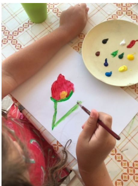
Fotografija 4. Djevojčica V. B. (6,5 g.) slika cvijet