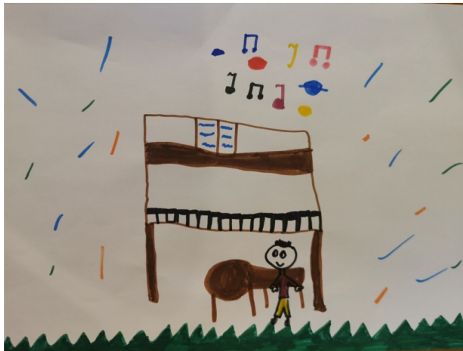
Slika 11. Djevojčica L. P. (6,5 g.) „Pijanist svira“

Slijedeća skladba ponuđena djeci za likovno izražavanje bila je skladbe brzoga tempa u mol tonalitetu „Nachklänge aus dem Theater“.