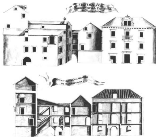
Slika 7. Izgled i presjeci kuće obitelji Garagnin. Muzej grada Trogira

Razdoblje francuske uprave poklapa se sa razdobljem klasicizma. U Hrvatskoj se on javio posljednjih godina 18. stoljeća i nije značajnije odjeknuo, stoga gradnja po uzoru na klasicizam nije svojstven način građevinske djelatnosti Trogirana tijekom francuske uprave. 145 Stambena arhitektura tog doba nije do sada detaljnije istraživana, a Stanko Piplović pretpostavlja da je bila skromna s obzirom na ratne prilike. 146 Za većinu trogirskih objekata karakteristična su obilježja od romanike do baroka, a obitelj Garagnin prednjačila je gradnjom. 147