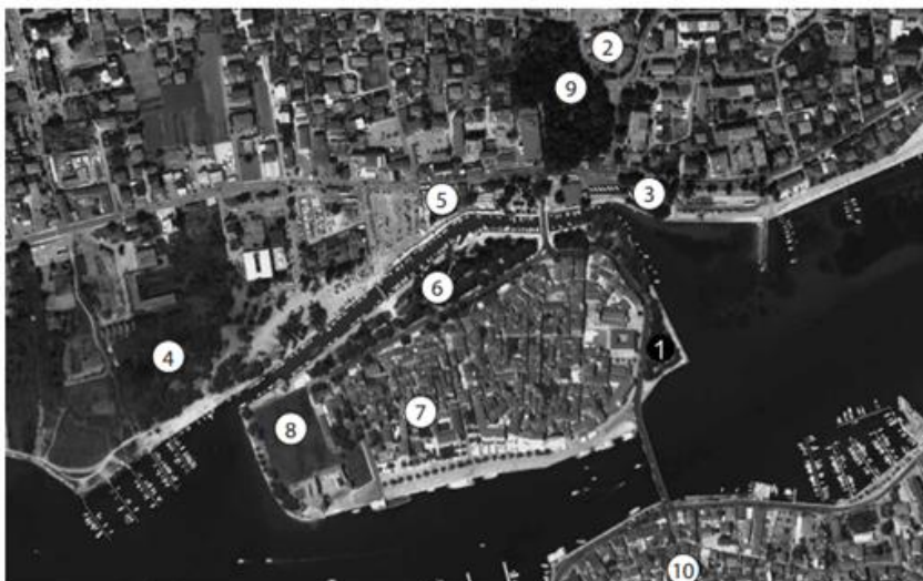
Slika 1. Satelitska snimka Trogira i neposredne okolice s naznačenim najvažnijim toponimima: 1. Žudika; 2. Dobrić; 3. Lokvice; 4. Soline; 5. Travarica; 6. Fortin; 7. Pasike; 8. Batarija; 9. Garanjinov vrtal; 10. Čiovo