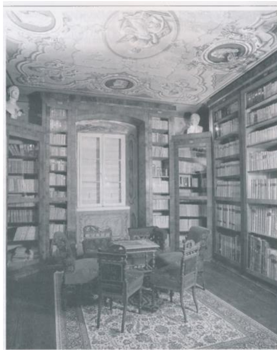
Slika 4. Muzej grada Trogira, knjižnica obitelji Garagnin-Fanfogna

muzejskog postava. Gotovo potpuno sačuvana svjedoči o visokoj intelektualnoj razini pojedinih Trogirana. 81