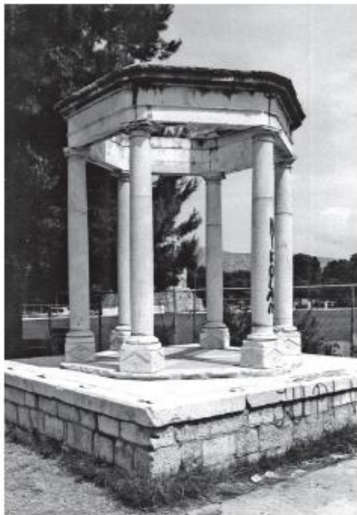
Slika 6. Klasicistički glorijet na Poljani sv. Mihovila u Trogiru, podignut 1808.

spomenika. Tako je glorijet iste godine izgrađen u plicaku između venecijanske tvrđave Kamerlengo i kule sv. Marka (sl. 6). Okruglasti paviljon sa šest kamenih stupova i šiljastim krovom pozicioniran je na postolju koje je s obalom bilo spojeno malim mostom. Sredinu glorijeta trebala je upotpuniti Napoleonova bista koja nikada nije postavljena. Spomenik je izgrađen u klasicističkom stilu, a pretpostavlja se da ga je projektirao Basilio Mazzoli jer je on bio jedini poznati arhitekt koji je za vrijeme francuske uprave djelovao u Dalmaciji. Pred spomenikom se odvijalo i civilno vjenčanje koje su Francuzi uveli, a kako većina naroda nije prihvaćala civilni brak, glorijet je u više navrata bio meta nezadovoljnika. Oštećen je i 1809. prilikom privremenog prodora austrijske vojske u Dalmaciju. 135