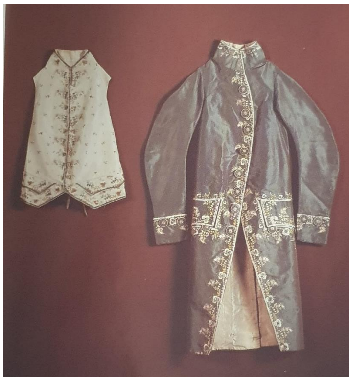
Slika 3. Izvezeni frak s pripadajućim prslukom. Muzej grada Trogira

Početak 19. stoljeća nosili su se capoto i capotin , duži i kraći kaput, a obavezan dio muške odjeće bio je tabaro , vrsta ogrtača dugog do koljena. Muškarci su od nakita nosili prstenje ili sat obješen na lanac. Od modnih detalja nosili su se rupčići, marame, rukavice, i štapovi, a ista se odjeća nije nosila i u kući. Za vrijeme boravka u domu obično se oblačila kućna haljina, a čak se i poslugi odijevala u posebno za njih nabavljenu odjeću ili u onu odbačenu od gospode. Građanke su se istovremeno mnogo jednostavnije odijevale, iako su pokušale pratiti plemkinje, dok su pučanke nosile skromniju odjeću. Svakodnevnu odjeću pučanki činila je košulja, šotana, korpet, pandila i pregača. Preko ramena se nosila trokutasta marama, a od nakita jednostavne naušnice. Istovremeno se odjeća pučana sastojala se od košulje, dugih hlača, pojasa, prsluka, kaputića, čarapa, cipela i kape. 71