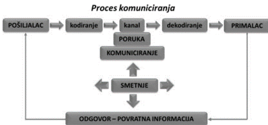
Slika 1. Proces komuniciranja