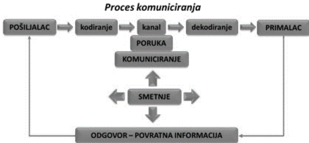
Slika 1. Proces komuniciranja