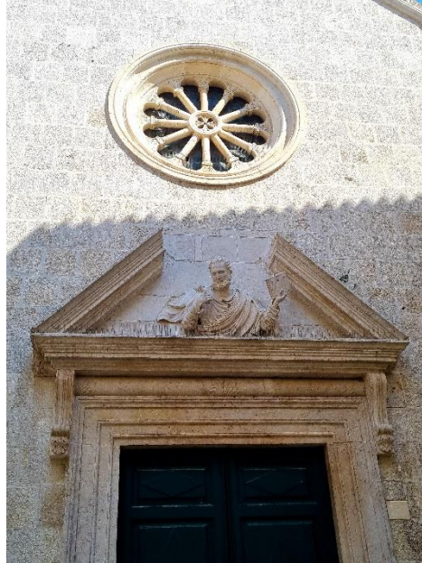
Slika 8. Detalj pročelja crkve sv. Petra u Trogiru