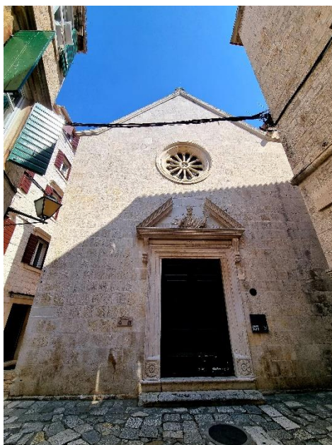
Slika 7. Crkva sv. Petra u Trogiru

Nekad objekt u sklopu ženskog benediktinskog samostana sv. Petra i Pavla, a danas samo crkva sv. Petra, smještena je u staroj jezgri Trogira nekoliko ulica dalje od stolne crkve. Nakon ukinuća ženskog samostana sv. Petra i Pavla u 19. stoljeću, sačuvani su crkva sv. Petra sa zvonikom te dijelovi klaustara s bunarom. Samostanska zgrada prenamijenjena je pak u stambene objekte. Spisi svjedoče da je ranija renesansna crkva pregrađena 1759. godine pod vodstvom Ivana Macanovića, kojem se u radu pridružuje sin Ignacije. 58 Riječ je upravo o baroknoj pregradnji koju prepoznajemo i na crkvi u Kaštel Štafiliću, a stilska paralela se vuče s pročeljem nedovršene crkve na Velom Drveniku. Izmjene i pregradnje su vidljive na monumentalnom pročelju i dekorativno postavljenim rozetama. 59