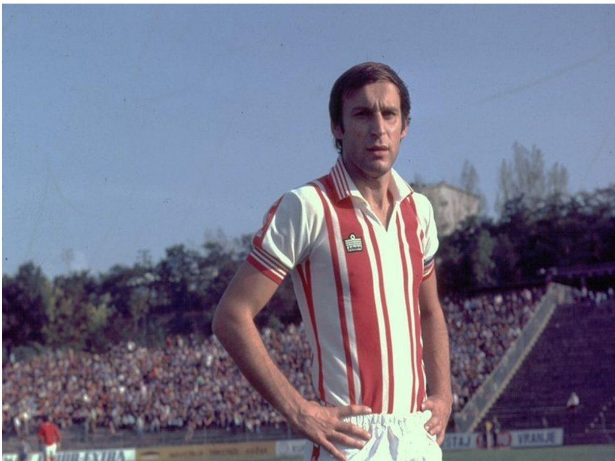
Fotografija 10. Dragan Džajić, rekorder po broju nastupa za reprezentaciju te po mnogima najbolji igrač Crvene Zvezde svih vremena.

No ako je krajem desetljeća dominirala Crvena Zvezda, početkom desetljeća je bolji bio Partizan te je on prvi uspio spojiti tri titule zaredom, u sezonama 1960./1961., 1961./1962. i 1962./1963., te su ponovno slavili u sezoni 1964./1965. Iduće sezone su u Kupu prvaka dogurali do finala u kojem su izgubili od Real Madrida. No svejedno, to je bio najveći uspjeh jugoslavenskog klupskog nogometa sve do samog osvajanja Kupa prvaka od strane Crvene Zvezde. Zbog te tri titule su zaradili nadimak „Parni valjak“ a tu generaciju su zvali i „Partizanove bebe“ zbog velikog broja mladih igrača koji su bili zvijezde momčadi. Tu spadaju Mustafa Hasanagić koji je od 1961. - 1969. skupio 104 nastupa te zabio 56 gola te bio najbolji strijelac lige u sezoni 1966./1967., vratar Milutin Šoškić koji je zamijenio Bearu na vratima nacionalne vrste te skupio 177 ligaških nastupa od 1955. – 1966., bek Fahrudin Jusufi sa 162 nastupa od 1957. – 1966., napadač Milan Galić sa 148 nastupa 1958. – 1966., vezni igrač Vladica Kovačević sa 151 nastupom od 1958. - 1966. te libero Velibor Vasović sa 128 nastupa od 1958. – 1963. te 1964. - 1966. Svi su oni bili reprezentativci, no Vasovićeva karijera najviše