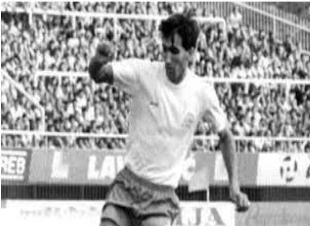
Fotografija 24. Zlatko Vujović, legendarni golgeter Hajduka