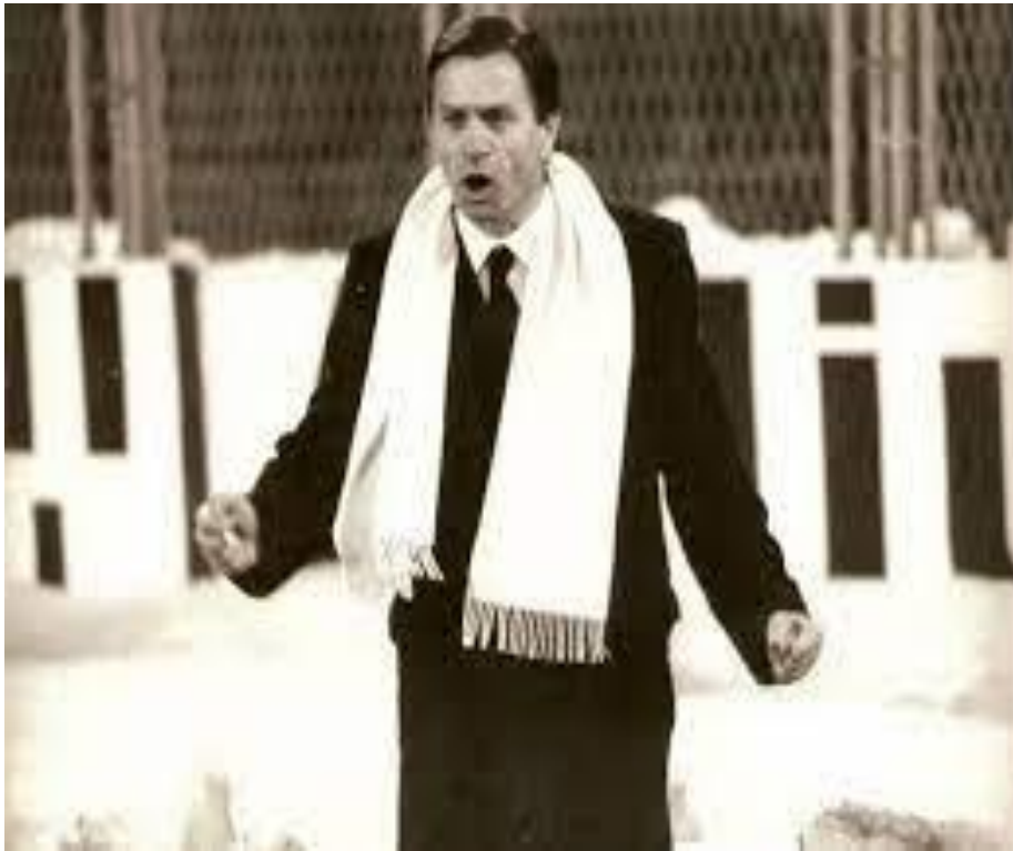
Fotografija 23. Miroslav Ćiro Blažević, „čovjek s dušom demona i licem Alana Delona“