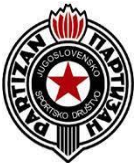
Fotografija 4. Grb JSD Partizana

Kad bismo analizirali 1950-te godine rezultatski, vidjeli bi da je recimo 1951. od 12 klubova njih 11 dolazilo iz Srbije i Hrvatske. Iz Srbije sedam, a iz Hrvatske četiri te je jedina iznimka bila Sarajevo. Kako se bližimo kraju pedesetih godina, tako dolaze u ligu klubovi iz drugih republika pa se tako iz Crne Gore etablira Budućnost iz Titograda (današnja Podgorica), a iz Makedonije Vardar iz Skopja te Rabotnički koji je doduše prvoligaški nogomet igrao samo jednu sezonu, kao i ljubljanski Odred koji će se kasnije preimenovati u Olimpiju. Iz Bosne i Hercegovine u ligu uz Sarajevo ulaze i Velež iz Mostara te Željezničar iz Sarajeva te Sloboda iz Tuzle. U Srbiji osim Beograda etablira se kao jaka ekipa Vojvodina iz Novog Sada, dok u Hrvatskoj uz nekoliko momčadi iz Zagreba uz Dinamo (Zagreb, Lokomotiva, Borac), javlja se i druga momčad iz Splita, Radnički nogometni klub Split te kao novi centar osim Zagreba i Splita se javlja i Rijeka. Najbliže prekidu dominacije velike četvorke u ligi je bila Vojvodina koja je jednom bila druga, kao i BSK koji je osvojio i dva kupa, no ipak velika četvorka relativnom lakoćom osvaja bodova protiv manjih koji im ipak nisu mogli parirati.