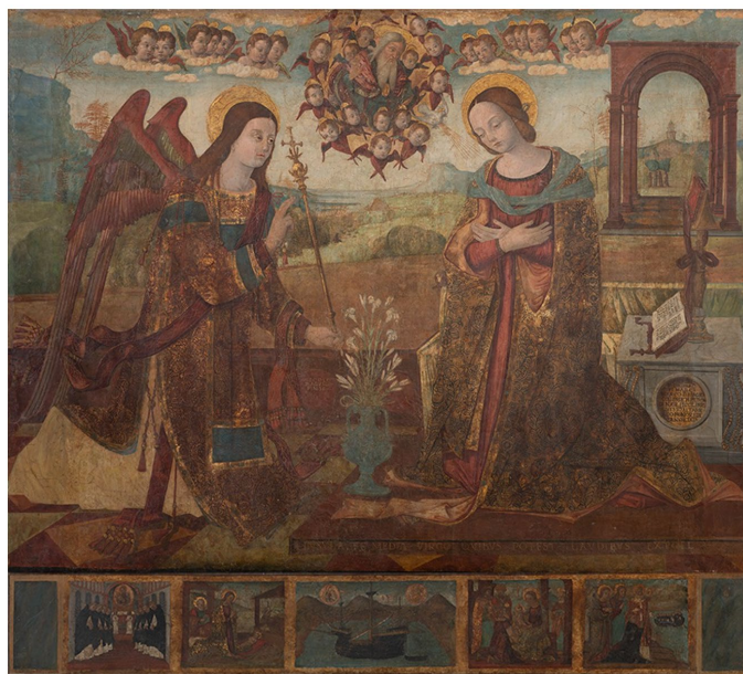
Slika 3, Nikola Božidarević, Navještenje , muzej samostana sv. Dominika, Dubrovnik

Edenski je vrt pak prvi dom čovječanstva. Riječ je o plodnom mjestu s pregršt voća i cvijeća gdje teku kristalno čiste vode i obitavaju pitome životinje. Idilično mjesto u kojemu su svačije potrebe zadovoljene i gdje prevladava čista ljubav postalo je epitom savršenstva mirnoga življenja kojemu se svaki pojedinac kani vratiti. Shodno je tomu u kršćanskoj umjetnosti rajski vrt prikazan kao mjesto gdje u bujnoj zelenoj travi u skladu leže sve divlje životinje. Eden se pojavljuje na prikazima: Stvaranje Adama, Stvaranje Eve, Brak Adama i Eve, Iskušenje i pad, te Navještenje Djevici Mariji. 41