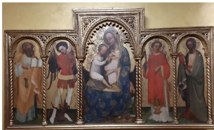
Slika 7, Blaž Jurjev Trogirani, Bogorodica s Djetetom , poliptih, Šibenik, Interpretacijski centar