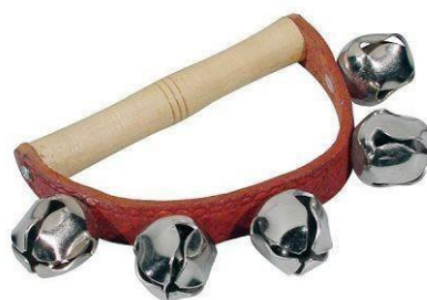
Slika 10. Praporci