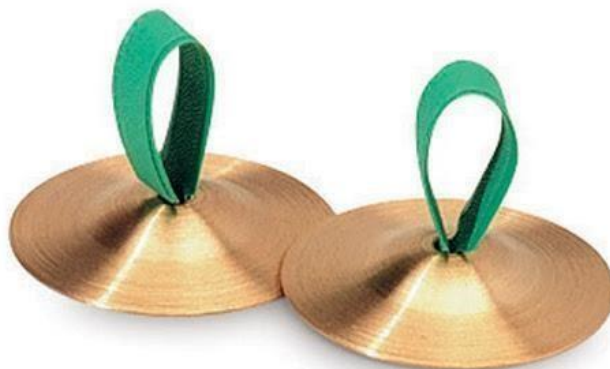
Slika 7. Činele