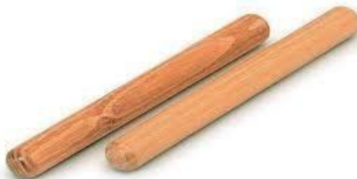
Slika 4. Štapići