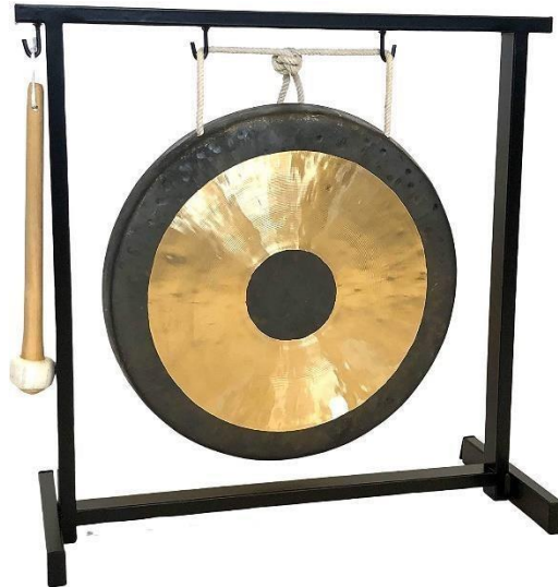
Slika 12. Gong

Idiofoni su instrumenti koji stvaraju tonove uz pomoć samostalnog titranja, bez upotrebe žice ili membrane (Michels, 2004). Idiofoni spadaju u skupinu udaraljki. U povijesti su se koristile kao pratnja plesu na svečanostima ili bitkama (Dearling, 2005).