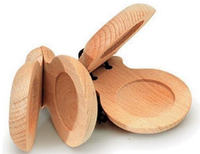
Slika 11. Kastanjete