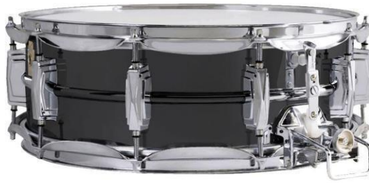
Slika 5. Mali bubanj