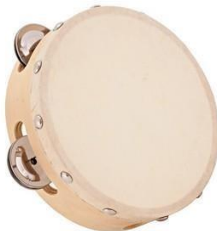
Slika 9. Tamburin