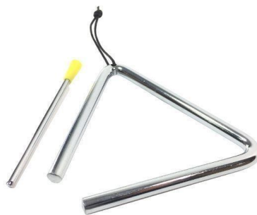
Slika 6. Triangl