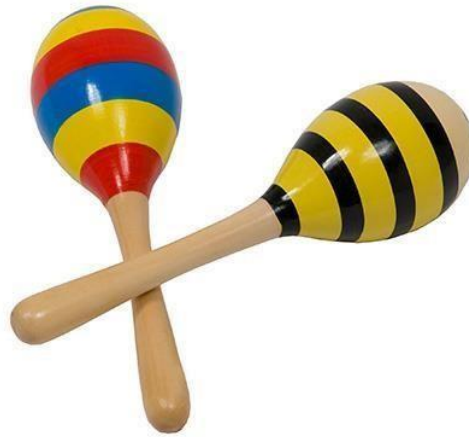
Slika 8. Zvečke