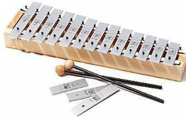
Slika 1. Metalofon