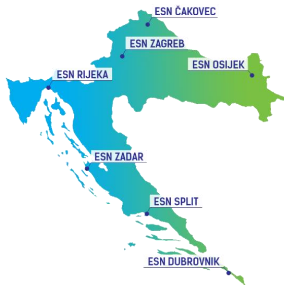
Slika 7. Sekcije ESN-a Hrvatska – izvor: https://www.esn.hr/local-sections (preuzeto 1. kolovoza 2021.)