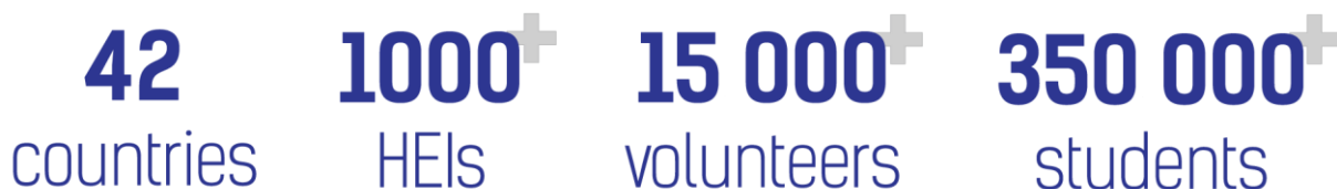
Slika 4. Statistički podaci o veličini Mreže – izvor: https://wiki.esn.org/display/EI/ESN+Basics+Home (preuzeto 1. prosinca 2021.)

Danas Mreža surađuje s više od 1 000 visokoškolskih ustanova iz 42 zemlje, a kontinuirano se razvija i širi. Ima oko 15 000 aktivnih članova koji se u svojim sekcijama (lokalnim organizacijama) brinu o dolaznim, internacionalnim studentima. Tako ESN uključuje oko 50 000 mladih ljudi koji svake godine nude svoje usluge 350 000 internacionalnim studentima, kao što je prikazano na Slici 4.