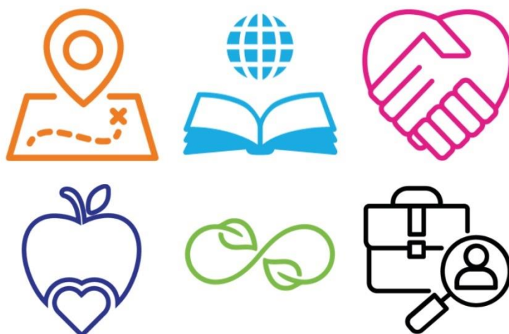
Slika 5. Područja djelovanja ESN-a – izvor: https://wiki.esn.org/display/CE/Causes+of+ESN+Home (preuzeto 1. prosinca 2021.)