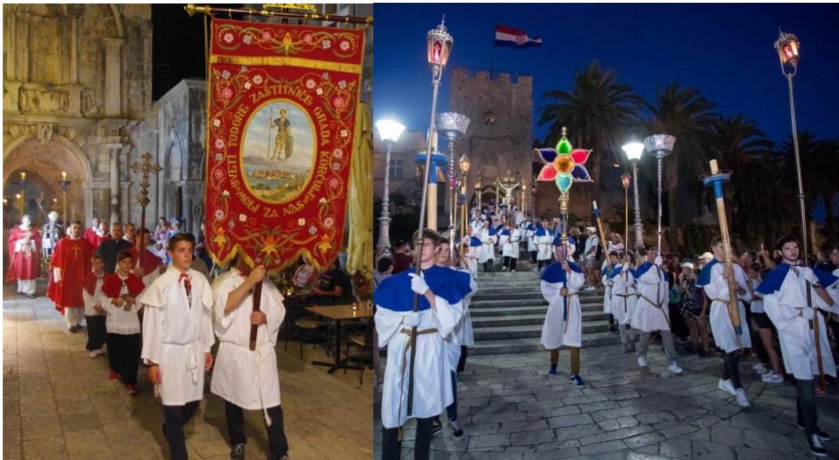
Slika 18. Procesija

Ovo je i najvažniji dan za korčulanske moreškante i Bulu. Naime, ovom prigodom održava se i svečani nastup moreške. Održavaju se i posebne pripreme za najvažniji nastup u godini, kako bi taj dan završio svečanom moreškom. Pripreme traju cijeli dan, a uključuje i čašćenje kod Bule. Također se nakon nastupa čitaju imena članova koji su tu večer svečano nastupali prvi put.