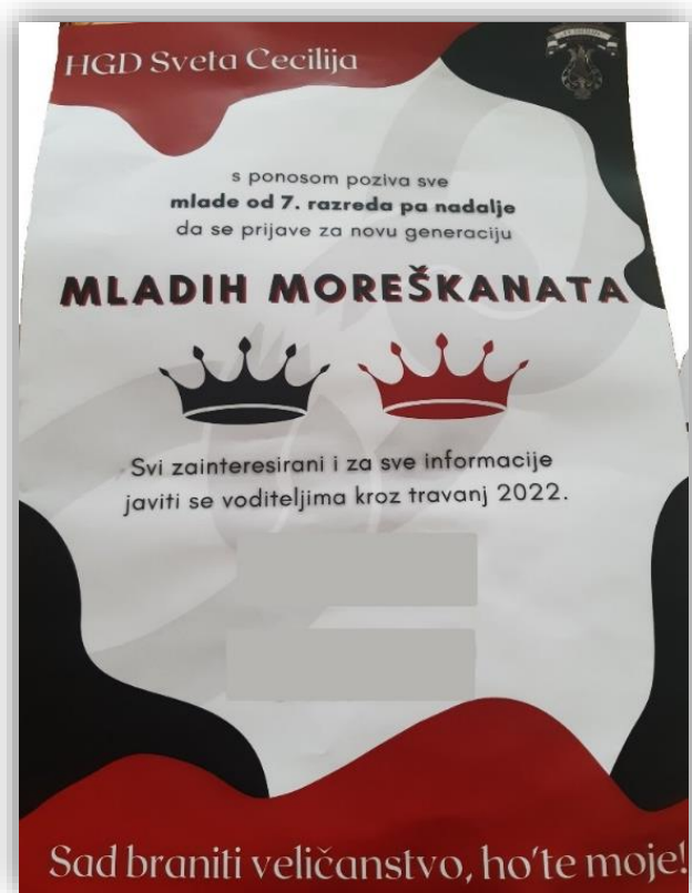
Slika 16. Plakat u osnovnim školama

Za plesati morešku potreban je osjećaj za ritam i sinkronizaciju pokreta , kao što ističe učitelj moreške u Korčuli. Oni koji su bolji i spretniji iz nove generacije se priključuju starijoj sekciji kako bi stekli dodatno iskustvo.