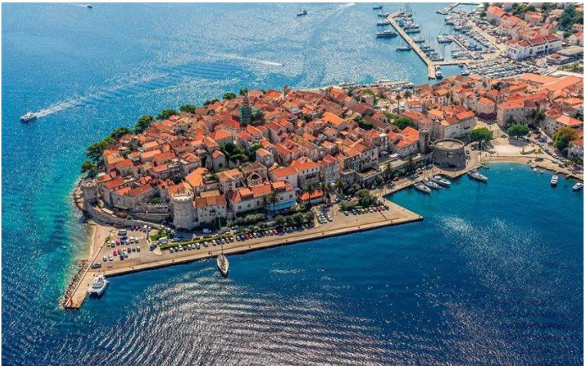
Slika 3 Korčula

Veliko kulturno bogatstvo maloga grada predstavlja bitnu ulogu i u samom razvitku otoka jer privlači brojne posjetitelje koji svoje putovanje dominantno posvećuju različitim kulturnim aktivnostima. Upravo korčulanska moreška predstavlja jedan od najvrjednijih kulturnih sadržaja koji Korčula može ponuditi svojim gostima pa je stoga od iznimne važnosti i u razvitku gospodarstva samoga otoka. Korčulanska moreška vrijedno je kulturno-povijesno blago otoka Korčule, ali jednako tako važan i neizostavan segment njegova gospodarskoga razvoja. Neupitna je, dakle, važnost očuvanja i zaštite toga kulturnoga dobra.