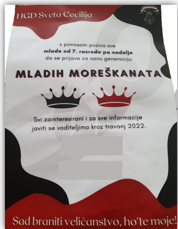
Slika 16. Plakat u osnovnim školama

Za plesati morešku potreban je osjećaj za ritam i sinkronizaciju pokreta , kao što ističe učitelj moreške u Korčuli. Oni koji su bolji i spretniji iz nove generacije se priključuju starijoj sekciji kako bi stekli dodatno iskustvo.