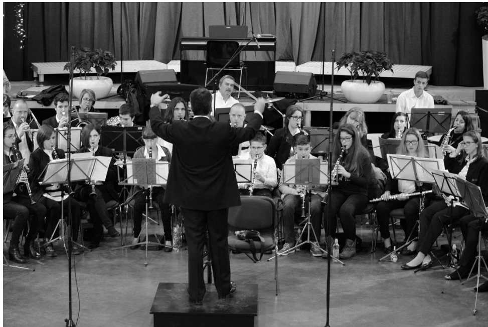
Slika 7. Orkestar

Tempo se postepeno ubrzava ( accelerando ). Brzina varira, glazba postaje sve brža, vivo 7 tempo. Nakon toga dolazi posljednji dio Finale , koji završava u duru.