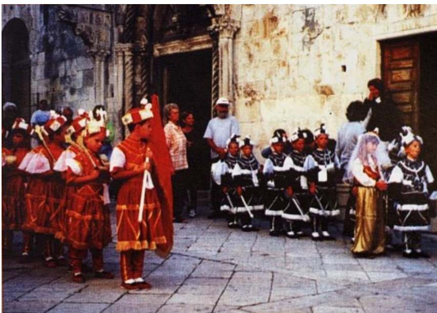
Slika 13. Dječja moreška

Ivelja (2003) ističe se kako su djeca najbolji oponašatelji te da je u toj fazi razvoja dominantno upravo socijalno učenje, to jest, oponašanje kao dio socijalnoga učenja. U interesu djece bilo je povezati vrtić s obiteljima i svim društvenim čimbenicima te poticati i njegovati pozitivan odnos prema baštini svoga kraja. Na taj način dijete upoznaje prošlost u sadašnjosti i razvija nacionalni i kulturni identitet te upoznaje druge zemlje i rase. Na kraju, razvija i ljubav prema plesu i organiziranom kretanju. Ishodi su projekta definirani su na sljedeći način: „razvijati osnovne i složene motoričke sposobnosti i povećavati funkcionalne i aerobne sposobnosti organizma, poticati razvijanje osjećaja za ritam i slobodno izražavanje uz glazbu, stvarati trajniji interes za glazbu, razvijati estetski osjećaj prema prirodi i okolini te poticati stvaralačke sposobnosti u likovnom izražavanju“ (Ivelja, 2003, str. 13).