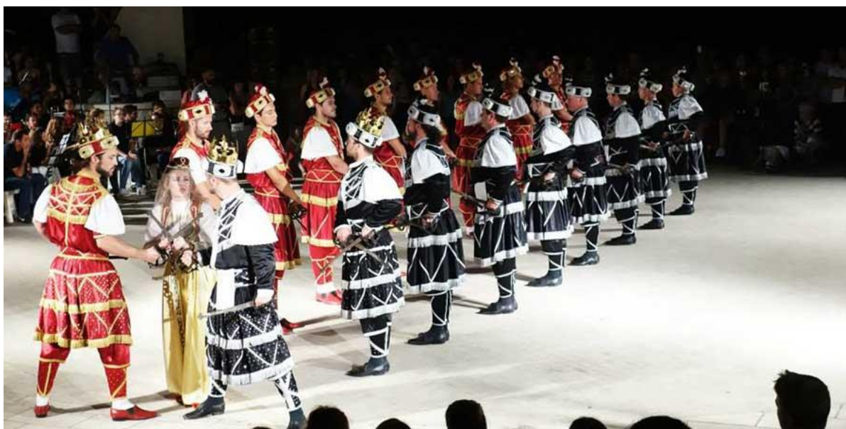
Slika 4. Crni i bijeli

Iz povijesti moreške poznato je da plesovi imaju porijeklo iz Španjolske kao reminiscencija na istjerivanje Maura. S obzirom na turbulentnu povijest, područje Mediterana je domovina borbenih mačevalačkih plesova koji se po svojoj osnovi mogu nazivati moreškama. Jednostavni plesni pokreti koji se dopunjuju vješt看 mačevanjem i čestom pučkom dramom kojoj je sadržaj borba crnih i bijelih. To može predstavljati borbu: kršćana i nekršćana, Španjolaca i Maura te u korčulanskoj moreški Osmanlija i Maura (Foretić, 1974).