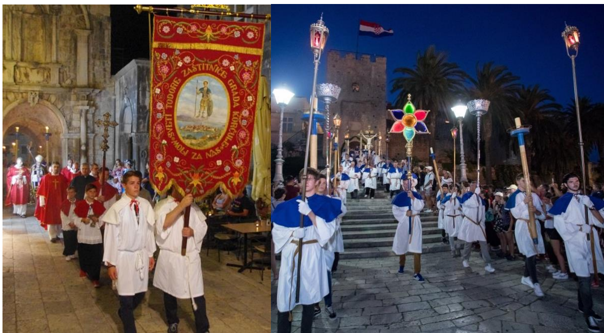
Slika 18. Procesija

Ovo je i najvažniji dan za korčulanske moreškante i Bulu. Naime, ovom prigodom održava se i svečani nastup moreške. Održavaju se i posebne pripreme za najvažniji nastup u godini, kako bi taj dan završio svečanom moreškom. Pripreme traju cijeli dan, a uključuje i čašćenje kod Bule. Također se nakon nastupa čitaju imena članova koji su tu večer svečano nastupali prvi put.