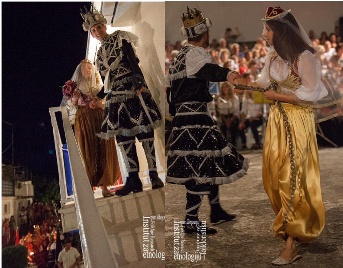
Slika 21. Bula