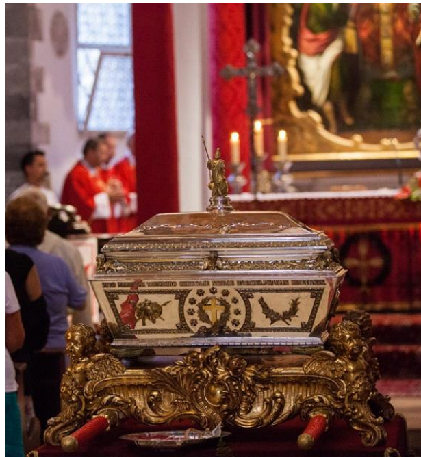
Slika 17. Relikvije sv. Todora

Za Korčulane datum 29. srpnja predstavlja veliki dan – svetkovinu zaštitnika grada, mučenika, sv. Todora i Dan grada Korčule. Dva dana ranije, 27. srpnja, zvona korčulanske katedrale najavljuju proslavu nebeskoga zagovaratelja Korčulana. Dan prije proslave, 28. srpnja nakon večernje mise župnik iznosi kasu s relikvijama sv. Todora. Relikvija se čuva u glavnom oltaru te ju korčulanske bratovštine (Svih svetih, Svetoga Roka, i Gospe od Utjehe) izlažu vjernicima. Na dan svetog Todora, nakon mise je procesija oko grada tijekom koje se nose relikvije zaštitnika („Proslava sv. Todora u Korčuli“, 2018).