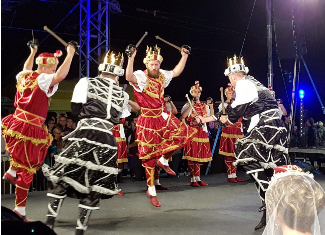
Slika 5. Ples Otmanovića s Crnim i Bijelim kraljem

uz karakteristično udaranje bubnja. Glazba daje uvodnu pratnju uz koju svi plešu korak sfide te se time prelazi na mačevalačku figuru. Već spomenutu mačevalačku figuru Korčulani nazivaju kolap (Ivančan, 1974).