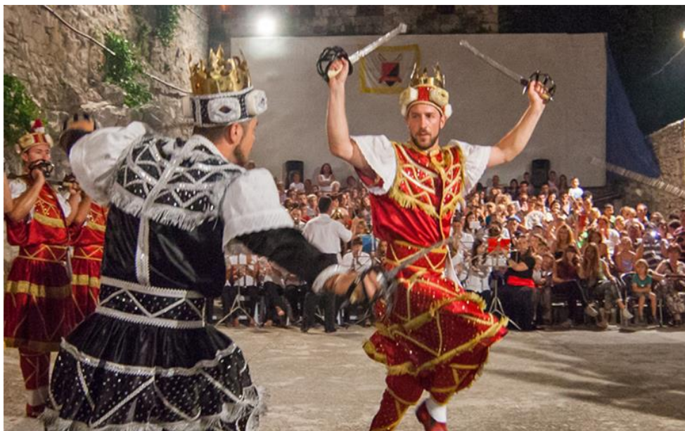
Slika 8. Orkestar na nastupu s moreškom