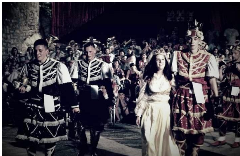
Slika 20. Kraj izvedbe

Velika je čast biti Bula na dan sv. Todora te je takav nastup najzahtjevniji jer je riječ o svečanom nastupu s mnogo gledatelja i to s publikom koju čineiskusne Bule i umirovljeni moreškanti. Također, običaj je darivati Bulu nakitom, najčešće rećinama (naušnicama). No, prije nastupa u Korčuli je običaj „poći po Bulu“ i to dvije večeri prije. Tada se obučeni moreškanti upute s bubnjem koji daje ritam hodu prema kući u kojoj živi Bula. Ona ih tamo dočeka i počasti. Odjeća Bule se sastoji od širokih hlača, košulje, robenoga prsluka, zatim karakterističnoga vela i papuča. Najvažniji detalj su verige (lanci) kojima je okovana oko gležnja i ruku.