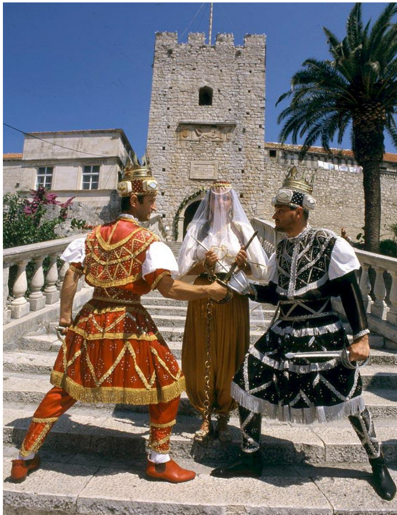
Slika 1. Bula, bijeli i crni kralj ispred kule Revelin u Korčuli

Korčulanska moreška predstavlja važan dio identiteta svakoga djeteta u Korčuli, počevši od vrtićke dobi. Djeci je poznato da se moreška igra svakoga ljeta. Njihova će pažnja na izvedbama u prvom redu biti usmjerena na članove njihove obitelji koji sudjeluju u samoj moreški. Iz toga je razloga važno u vrtiću i školi s djecom razgovarati o svemu viđenom i doživljenom. Na taj način djeca stječu znanja o kulturnoj tradiciji njihovoga kraja te postaju oni koji će tu tradiciju baštiniti, prakticirati te je na taj način i čuvati za nove naraštaje Korčulana.