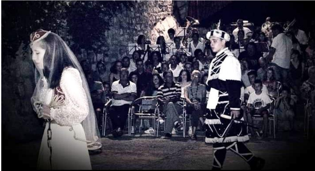
Slika 19. Bula

Velika je čast biti Bula na dan sv. Todora te je takav nastup najzahtjevniji jer je riječ o svečanom nastupu s mnogo gledatelja i to s publikom koju čineiskusne Bule i umirovljeni moreškanti. Također, običaj je darivati Bulu nakitom, najčešće rećinama (naušnicama). No, prije nastupa u Korčuli je običaj „poći po Bulu“ i to dvije večeri prije. Tada se obučeni moreškanti upute s bubnjem koji daje ritam hodu prema kući u kojoj živi Bula. Ona ih tamo dočeka i počasti. Odjeća Bule se sastoji od širokih hlača, košulje, robenoga prsluka, zatim karakterističnoga vela i papuča. Najvažniji detalj su verige (lanci) kojima je okovana oko gležnja i ruku.