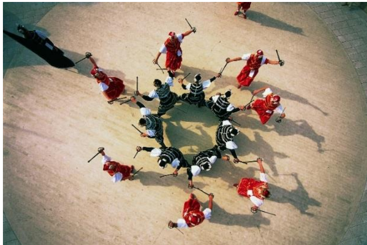
Slika 6. Korčulanska moreška

U ovoj figuri bijeli ne plešu nego samo hodaju i mačuju se. Za ovu figuru karakteristično je da se krug crnih sve više sužava pa tako i krug bijelih. Udarci su jednaki kao i u prvom dijelu četvrte figure. Ples se sastoji od 28 četveročetvrtinskih taktova. U ovoj figuri u posljednjem taktu na povik „paf!“ crni padaju, a bijeli ostaju uzdignuti s desnim mačevima nad njima. Lijevi su im mačevi upereni u protivnike. Konačno, crna vojska baca svoje mačeve te samo crni kralj stoji na koljenima. Nadalje, Bula dolazi k svojem zaručniku koji joj skida lance. Slijedi dijalog u kojem crni priznaju poraz, a bijeli kralj poljupcem potvrđuje pobjedu. Na samom kraju bijeli barjaktar 5 maše zastavom, a glazba svira posljednje taktove finala. I crni i bijeli dižu se i izlaze, naprijed stupaju barjaktari i bubnjari, za njima kraljevi i Bula uz bijeloga kralja te nakon njih u dvoredu i parovima vojnici crne i bijele vojske (Ivančan, 1974).