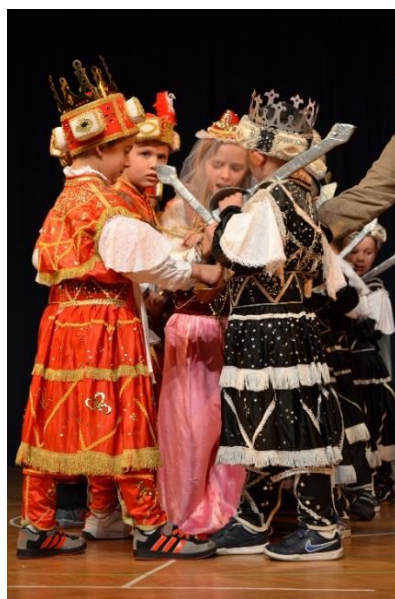
Slika 15. Djeca – kraljevi i Bula