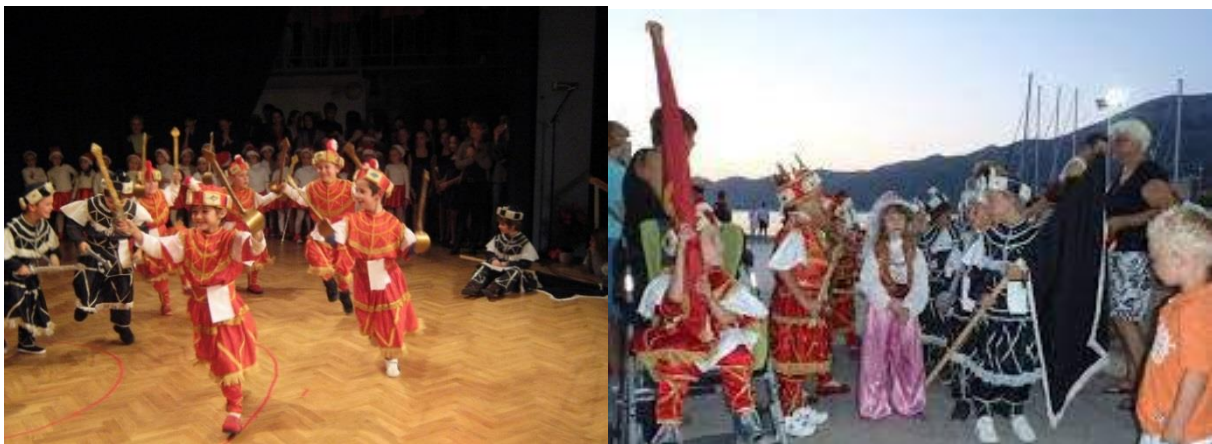
Slika 14. Djeca u moreški

Ovaj projekt se sastojao od posjeta Gradskom muzeju u kojem su djeca upoznala nošnju moreške koja se nekada nosila. Djeca su se upoznala s poviješću korčulanske moreške pomoću starih slika, videozapisa, atlasa svijeta, globusa te kroz govorne radionice. Također, dramatizirala se i lutkarska izvedba, a djeca su izrađivala lutke. Djeca su kroz učenje koreografije, oponašala svoje očeve, djedove itd. pa su na taj način i sama stvarala koreografiju. Djeca su sudjelovala i pomagala u šivanju nošnje pa su se tako upoznala sa zanimanjem krojačice. Glazbu moreške su izvodili glazbenici. Djeca su također dobila i potvrdu da su važna svima onima koji se brinu za njih (Ivelja, 2003).