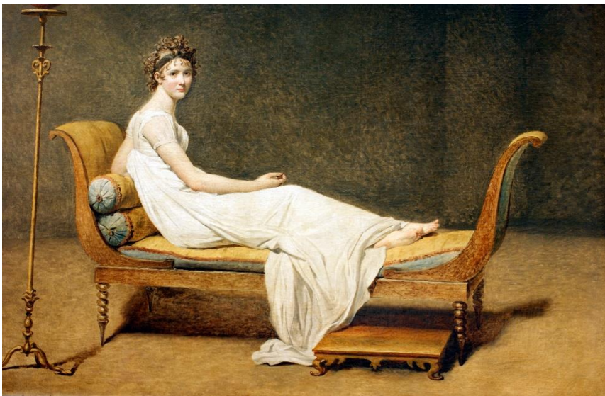
Slika 8. Portret Madame Recamier , Jacques-Louis David, 1800.

U romanu se Marinković poslužio i detaljima iz modnog dizajna, između ostalog, onda kada Krele dobronamjerno kritizira Melkiorovu senzibilnost i neuklopljenost: „A kako ćeš se ti opasati, strašni ratniče? Pod prsima, kao gospođa Récamier, u stilu empire? Ne valja ti to, brate, upadljiv si.“ (Marinković, 1982: 249) Za haljine empire stila specifični su prozračni, lepršavi materijali koji slobodno padaju ispod grudi gdje se haljinu obično vezalo pa se Krele na temelju tog detalja izruguje Melkioru. Nije zanemariva ni činjenica da Krele, koji ima „devet fakulteta“, spominje uvaženu, stvarnu Francuskinju u čijem se salonu okupljala krema pariškog društva 19. stoljeća, a koju je na jednom od svojih impozantnih platna prikazao i francuski klasicist Jacques-Louis David (slika 8.).