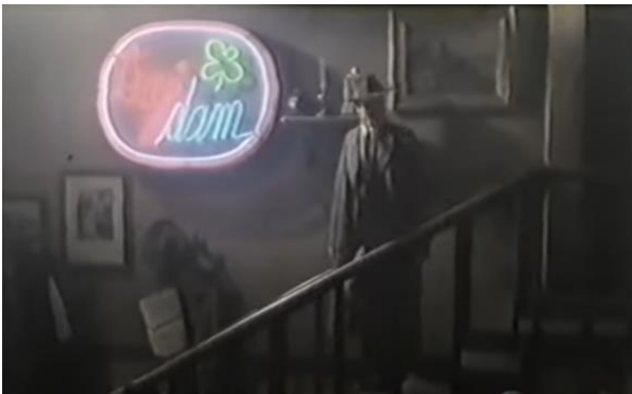
Slika 7. Scena iz Vrdoljakove ekranizacije Kiklopa