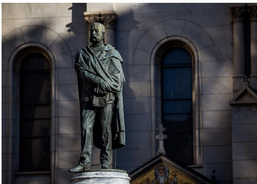
Slika 3. Skulptura Petra Preradovića, djelo Ivana Rendića

„Melkior se ukloni u sjenu pjesnikova spomenika da bi Uga propustio da prođe. Ali Ugo stane ispred spomenika. Brončani je pjesnik imao u rukama olovku i papir; očekujući inspiraciju gledao je u pročelje zgrade preko puta. A znate li vi, gospodine Petre, što je to tartalom ... na mađarskom jeziku? – upita ga Ugo; gledajući u njega odozdo izazovno, pričekava časak da mu pjesnik odgovori. – Ne znate dakle? Mislite da je to neki grčki pakao, ha, ha... To je – sadržaj. Toliko za danas. Zapišite – i krene, no odmah se vrati: – Još jednu riječ, Petre: ja sam kukac. O tome ne pišite. Zbogom.“ (Marinković, 1982: 336)