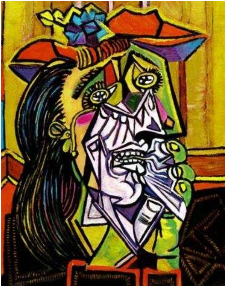
Slika 2. Pablo Picasso, Žena koja plače , 1937.