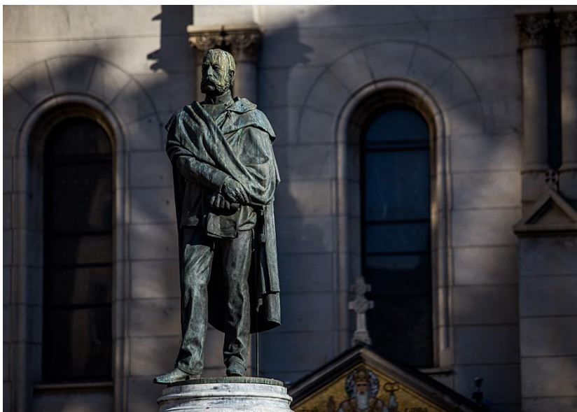
Slika 3. Skulptura Petra Preradovića, djelo Ivana Rendića

„Melkior se ukloni u sjenu pjesnikova spomenika da bi Uga propustio da prođe. Ali Ugo stane ispred spomenika. Brončani je pjesnik imao u rukama olovku i papir; očekujući inspiraciju gledao je u pročelje zgrade preko puta. A znate li vi, gospodine Petre, što je to tartalom ... na mađarskom jeziku? – upita ga Ugo; gledajući u njega odozdo izazovno, pričekava časak da mu pjesnik odgovori. – Ne znate dakle? Mislite da je to neki grčki pakao, ha, ha... To je – sadržaj. Toliko za danas. Zapišite – i krene, no odmah se vrati: – Još jednu riječ, Petre: ja sam kukac. O tome ne pišite. Zbogom.“ (Marinković, 1982: 336)