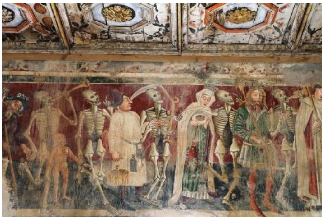
Slika 4. Detalj freske s prikazom teme dance macabre Vincenta iz Kastva

Jedna je od povijesno-umjetničkih disciplina ikonografija kojom se tumače prikazane teme i simboli u likovnoj umjetnosti te njihova dublja značenja ili sadržaj. U dijelovima ovoga romana ističe se Marinkovićevo generalno poznavanje likovne umjetnosti i nekih točaka njene povijesti. Tako autor već na početnoj stranici romana spominje temu dance macabre , odnosno plesa mrtvaca pri dočaravanju pranja košulja koje naziva „sablasnim torzima bez glave i nogu“ (Marinković, 1982: 7). Ovdje se na neki način od čitatelja traži da poznaje temu koju je na domaćem tlu najbolje uprizorio Vincent iz Kastva na freski u crkvi sv. Marije na Škrilinah u Beramu (slika 4.). Iako je Marinković ovu temu spomenuo u gotovo nevažnom detalju, može ju se primijeniti na čitavi roman zbog ozračja u kojemu likovi u romanu egzistiraju. Predratno vrijeme u svakom je liku potaknulo vlastiti obrambeni mehanizam pa dok parampion Ugo luduje, Maestro pomno planira i razrađuje plan samoubojstva, a Melkiora izjeda strah zbog kojega se gotovo pretvara u lik živoga mrtvaca. Zajedno djeluju kao parada pojedinaca koja pleše pred svima zajedničkom sudbinom – smrti koja prijete u okrilju nadolazećeg rata.