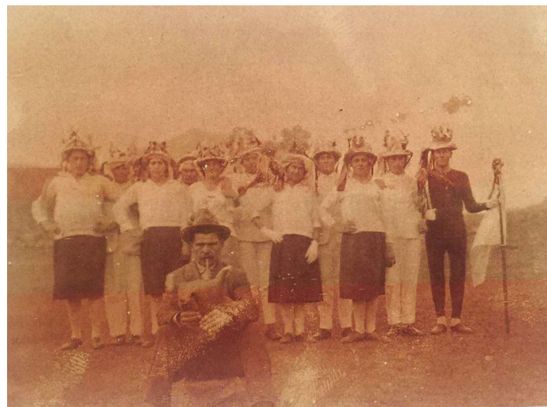
Bijeli maškari s početka 20. stoljeća