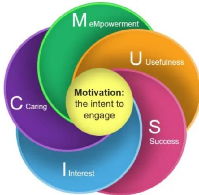
Slika 1. Pet komponenti MUSIC modela

Prilikom kreiranja nastave učitelj bi trebao uzeti u obzir 5 komponenti MUSIC modela motivacije: osnaživanje, korisnost, uspjeh, interes i brigu (slika 1). Ime modela, akronim MUSIC, nastao je kombiniranjem drugog slova riječi „ eMpowerment “ s prvim slovom preostale 4 komponente: usefulness, success, interest, caring (Jones, 2018).