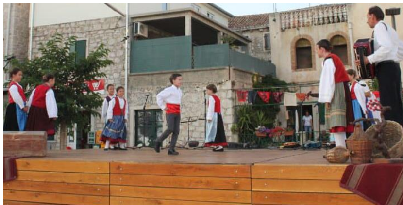
Slika 12. Dječja folklorna večer 2021. (Facebook stranica KUD Zora, Betina )

Članovi KUD-a Zora djecu usmjeravaju prema izgradnji pozitivnih stavova prema nasljeđu i to kroz učenje dječjih, tradicijskih pjesama, igara, brojalica i plesa (vidi poglavlje 4.1.1.). To su najčešće djeca vrtićke dobi i osnovnoškolci. U tjednu folkloru, koji se tradicionalno održava u Betini, uvijek je jedna večer posvećena djeci kako bi i ona imala priliku sudjelovati u očuvanju folklorne baštine, a gostuju i dječje grupe drugih KUD-ova. Osim navedenoga, najmlađi članovi KUD-a Zora često odlaze u posjet štićenicima Doma za starije u Tisnom te izvode kratki program kojim obrađuju štićenike (Fržop i Čorkalo, 2018).