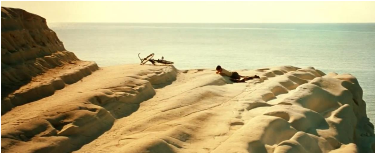
Fig. 6., Renato Amoruso, Malèna