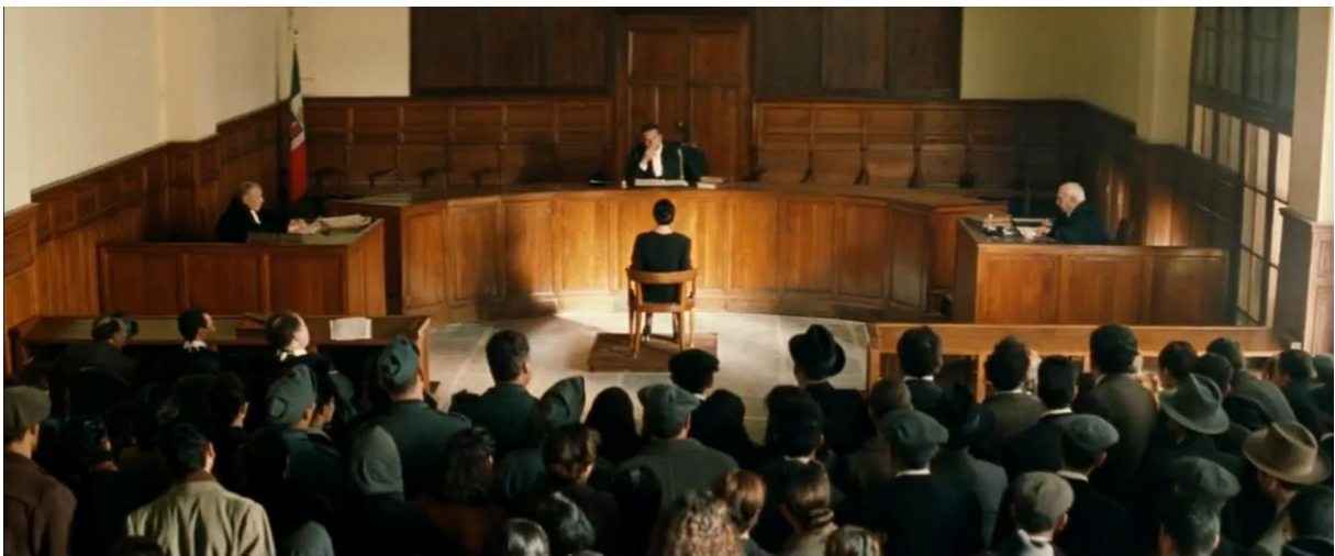
Fig. 10., Malèna in tribunale, Malèna