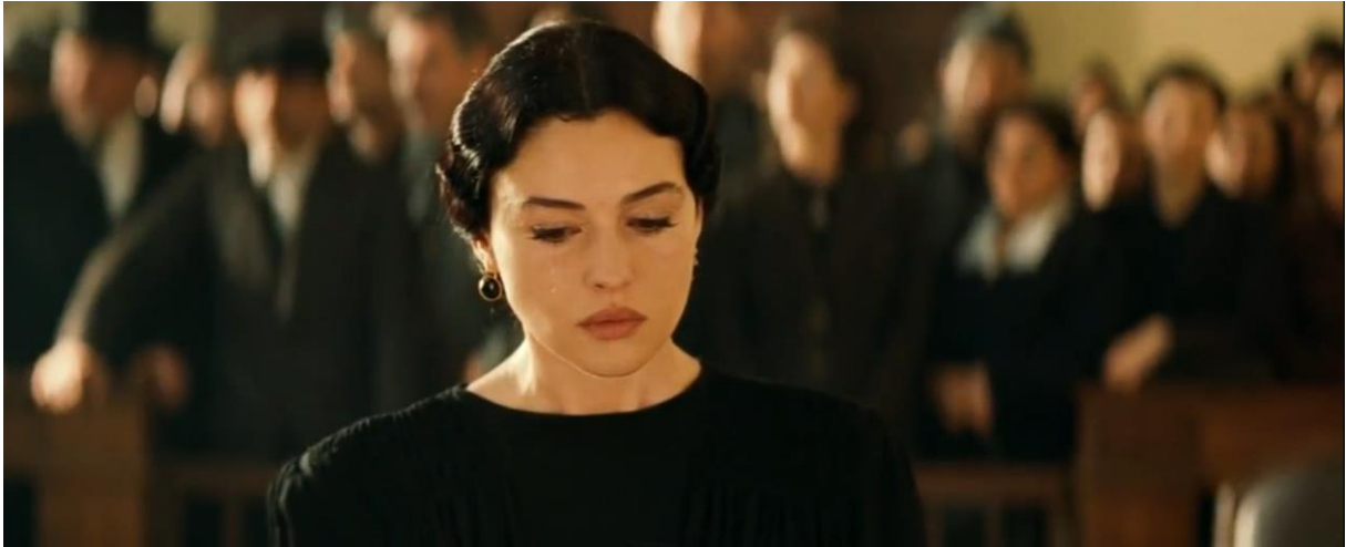
Fig. 11., Malèna in tribunale, Malèna