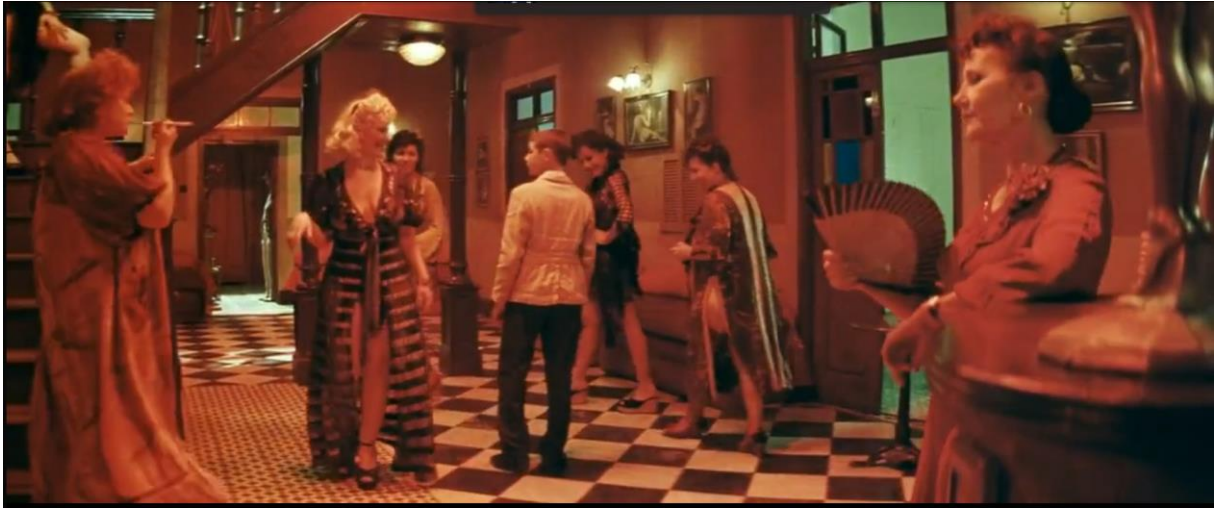
Fig. 7., Renato Amoruso in un bordello, Malèna (2000)