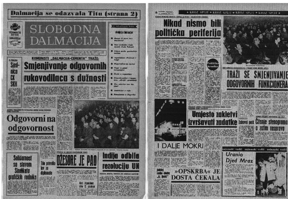
Slika 9: Slobodna Dalmacija, 11. prosinca 1971. godine