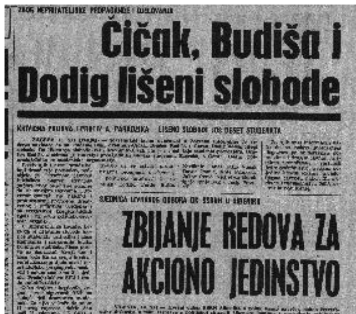
Slika 7: Slobodna Dalmacija, izdanje 13.12.1971.