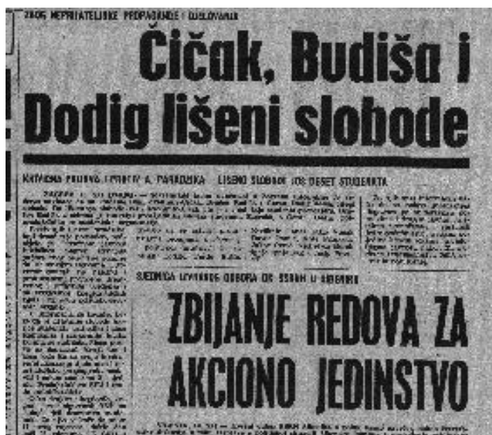
Slika 7: Slobodna Dalmacija, izdanje 13.12.1971.