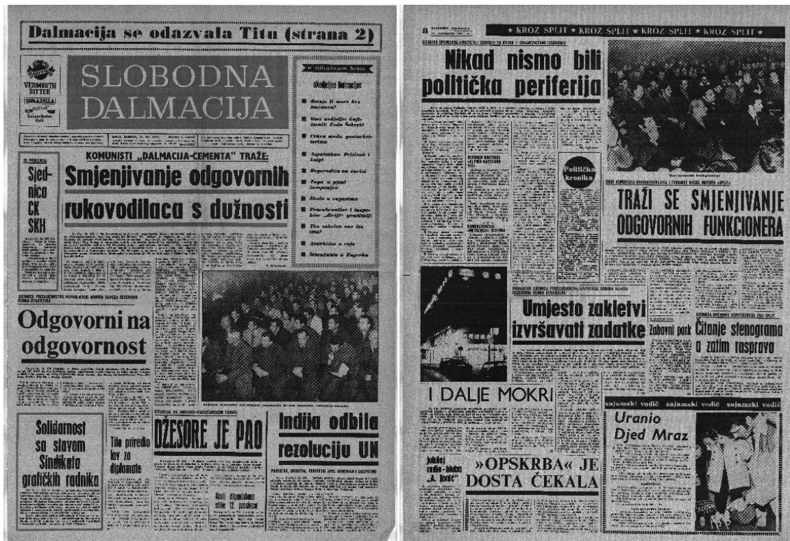
Slika 9: Slobodna Dalmacija, 11. prosinca 1971. godine