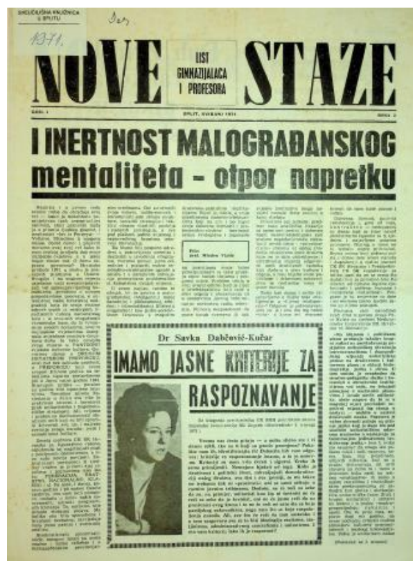
Slika 8: Nove staze, Split, svibanj 1971., br. 2

djelovao je u Splitskom kazalištu i na Dubrovačkom kazališnom festivalu. U svom profesorskom zanatu se istaknuo predavačkim žarom kojim je govorio o hrvatskim glazbenicima i njihovom stilu u glazbi. Smatrali su ga jednim od najboljih poznavatelja kako glazbe tako i povijesti glazbe. Zbog svog djelovanja, načina predavanja je okvalificiran kao gorljivi Matičar. Smatrali su da učenicima približava istaknute hrvatske intelektualce ne bi li ih tako zainteresirao za rad Matice. U razredu je interpretirao tekst Hrvatske domovine ukazujući na estetsku vrijednost i ljepotu glazbene sastavnice. Zbog toga je nakon Karađorđeva bio jedna od meta u Splitu. Doživio je oštru kritiku, a njegov je rad proglašen nacionalističkim zastranjivanjem. UDB-a je inzistirala na tome da ga se udalji iz škole, iz radnog mjesta profesora, što se i dogodilo unatoč protivljenju njegovih kolega prof. Marušića i prof. Zubanovića. Nakon Karađorđeva Nova staze su zabranjene, broj 3 – 4 je uništen u tiskari, a urednici prof. Bošković, prof. M. Mihanović i prof. Vlašić su snosili posljedice svoga uključivanja i djelovanja u Hrvatskom proljeću. 122