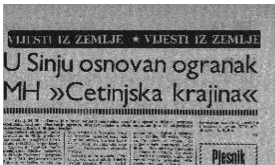
Slika 10: Vijest o osnivanju ogranka MH u Sinju, Slobodna Dalmacija, 25. listopada 1971. godine