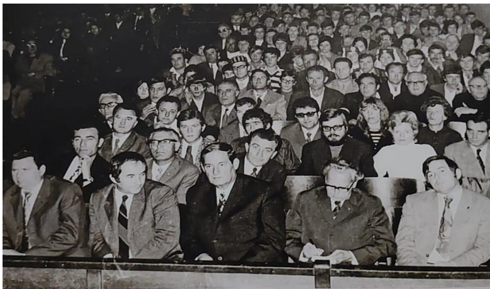
Slika 11: Publika na osnivačkog skupštini ogranka MH u Sinju, 24. listopada 1971. godine