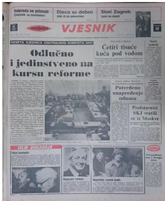
Slika 2: Vjesnik, naslovnica 18. siječnja 1970. godine

Prema nekim ocjenama, X. sjednica CK SKH je pokrenula politiku samostalnog prosuđivanja te je prekinula politiku ritualnog ponavljanja onoga što je zaključivalo jugoslavensko vodstvo. Između ostalog je prekinuta i praksa izbjegavanja suočavanja s međunacionalnim problemima. X. sjednica je otvorila put borbi za jezik, državnosti i samostalnijem gospodarskom razvoju kao i put slobodnijem političkom životu. Također je uvedena i nova politika koja je izvučena iz kabineta i prebačena na ulice, budući da se sjednica prenosila na televiziji. Jasno se na sjednici osudio centralizam i unitarizam te se jasno založilo za hrvatsku državnost i obranu nacionalnog identiteta. I iako je Dabčević-Kučar u svome referatu osudila i hrvatski nacionalizam, jasnija je nacionalna politika dobila masovnu podršku. Uz medije su pokrenuti i masovni zborovi na kojima se raspravljalo o pokrenutim pitanjima. Protiv navedene politike je bila Srbija, kao i Srbi u Hrvatskoj. 56