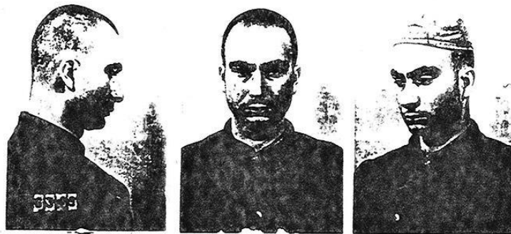
Slika 5: Slika s uhićenja, Dražen Budiša

S. Dabčević-Kučar se također našla pod istragom. Provedena je partijska istraga pred komisijom na čelu koje je bio Mirko Mečava, član CK SKH. Iz CK SKJ je isključena 8. svibnja 1972. godine zajedno s M. Tripalom, P. Pirkerom i M. Koprtlom. Dabčević-Kučar je u tim danima, u njezinom domu, posjetio kolega s Ekonomskog fakulteta, kojeg navodi pod inicijalima I. V. Zamolio ju je da pristane da se njezino ime, kao jednog od autora, izbriše s udžbenika za političku ekonomiju. Zahvaljujući Titovoj intervenciji, do suđenja visokim dužnosnicima SKH nije došlo. Unatoč tome, među uhićenima su bili savezni zastupnik M. Veselica i Š. Đodan, gospodarski tajnik MH, koji su 23. srpnja 1972. godine isključeni iz SKH. Do siječnja 1972. godine smijenjeno je ili je dalo ostavke oko 400 pristaša vodstva SKH. Smjene su zahvatile najutjecajnija imena iz političkih, vojnih, diplomatskih i novinarskih krugova Hrvatske. Među njima su bili: Miko Tripalo, Savka Dabčević-Kučar, Pero Pirker, Srećko Bijelić, Marko Koprtla, Mirko Dragović, Dragutin Haramdija, Pero Kriste, Slobodan Budak, Božo Novak, Željko Dežmar, Janko Bobetko, Ivan Rukavina, Vlado Lončarić i mnogi drugi. 92