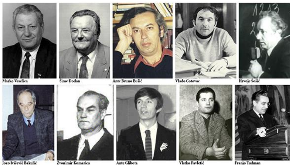
Slika 6: Uhićeni članovi Matice hrvatske