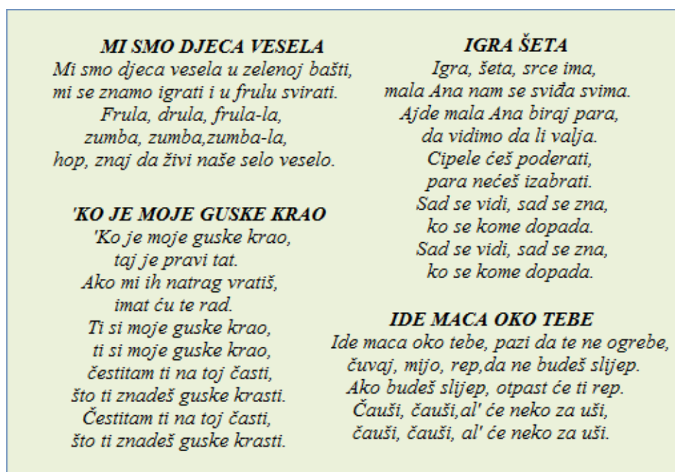
Slika 15. Tekstovi pjesama za dječje igre s pjevanjem (Knežević, 2002; 2012)

S mlađom dječjom plesnom skupinom za početak se izvode različite vježbe s ciljem usvajanja osnovnih formi koje se pojavljuju u narodnim plesovima. To uključuje hodanje u liniji, vlakiću i krugu uz glazbenu podlogu. Riječ je o osnovnim elementima bez kojih se ne može krenuti učenje koreografije. Ovaj, tzv. pripremni, dio obično je kratak i traje između jednog i tri sata poduke, ovisno o samoj djeci i njihovoj sposobnosti savladavanja navedenih vještina. Potom se kreće s aktivnim radom na koreografijama i pripremi za Božićni koncert.