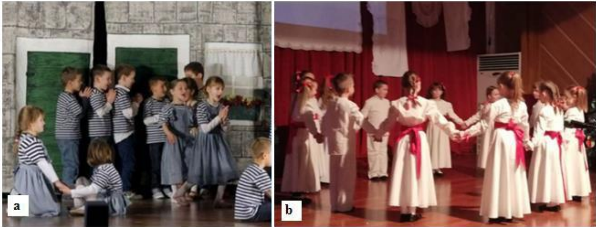
Slika 21. Improvizirane dalmatinske (a) i slavonske (b) nošnje dječjih vrtićkih skupina

haljinama za djevojčice ukrašenim crvenom vrpcom oko struka te bijelim košuljama i hlačama za dječake (Slika 21).