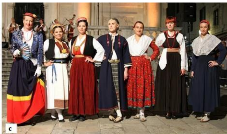
Slika 7. Tradicionalne nošnje Splita (a), Suska (b) i Dubrovnika (c)