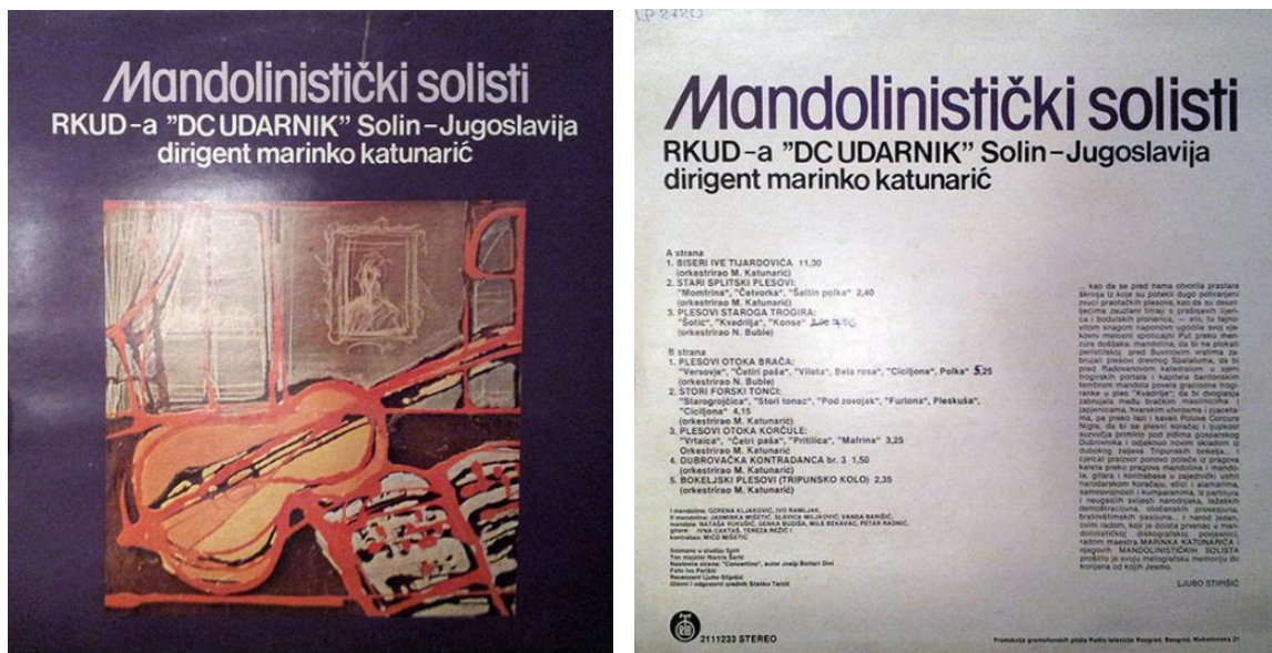
Slika 10. Izgled albuma mandolinističkih solista iz 1982. (Discogs, 2022)