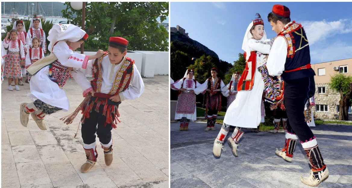
Slika 1. Prikaz kola u kojem plesači poskakuju u zrak s obje noge (Varenica, 2019)

se plesalo, izvođenje kola bilo je pod strogom kontrolom tadašnjih svećenika. Istovremeno na području Dubrovnika počinju se otvarati prvi zanati za izradu narodnih nošnji.