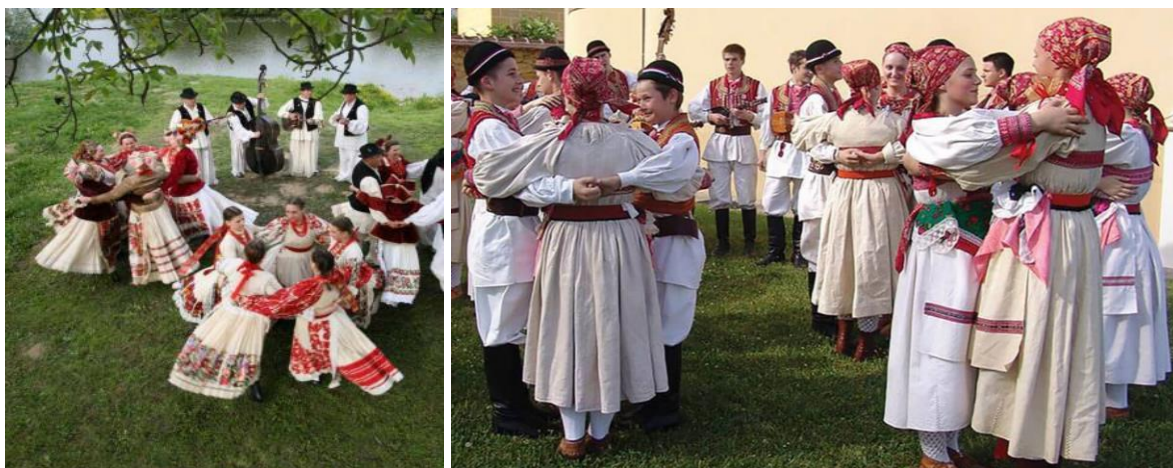
Slika 4. Drmeš u manjim zatvorenim kolima