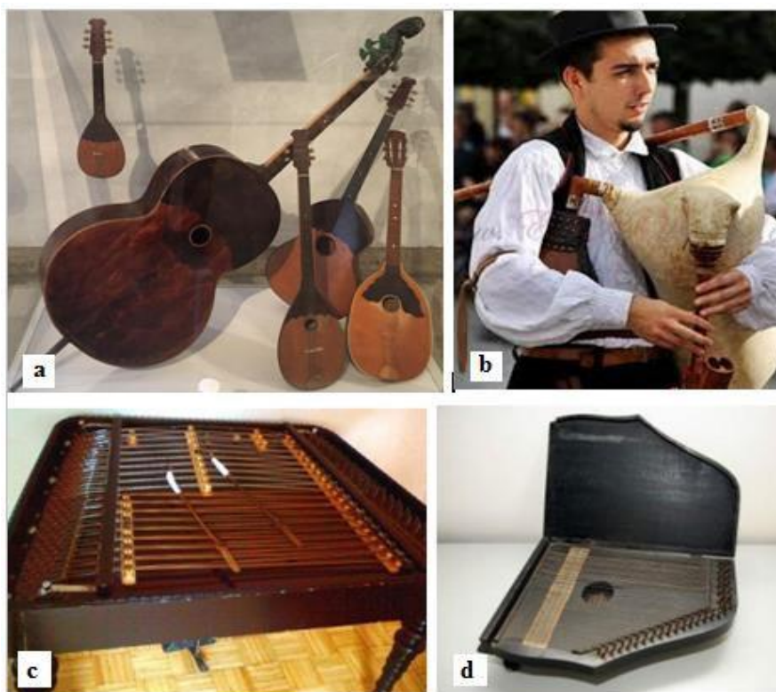
Slika 5. Tambura (a), gajde (b), cimbal (c) i citra (d) (Tatai, 2021)

S obzirom na to da nisu stilovi plesa u potpunosti isti u cijeloj Panoniji, drmeš je podijeljen na drmeš s blagim i drmeš s oštrim titrajima. Potonji je prisutan u Podravini gdje se pleše iznimno oštro, unutar zatvorenih, većih ili manjih kola, a plesači su međusobno povezani držeći se za ruke na način da prva osoba provlači ruke iza leđa jedne i ispred trbuha druge osobe koja se nalazi neposredno do njih hvatajući se za ruke treće osobe u krugu. Dok se ples izvodi, plesači se kreću u smjeru kazaljke na satu (Hrvatski folklor, 2022; Ivančan, 1996).