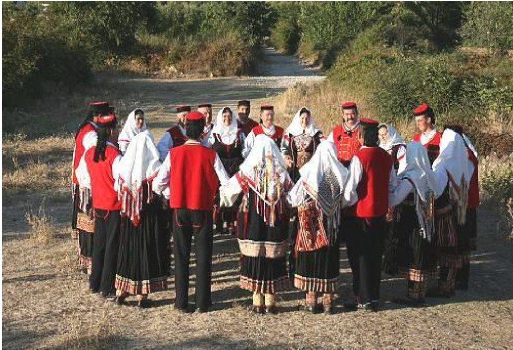
Slika 2. Nijemo kolo (UNESCO, 2011)

Naposljetku je potrebno spomenuti i nijemo kolo , još jedan proizvod hrvatske kulturne baštine smješten na UNESCO-vu listu od 2011. (UNESCO, 2011; Ministarstvo kulture i medija, 2022), za koje se još uvijek ne može sa sigurnošću tvrditi kad se prvi put pojavilo (Službene mrežne stranice Grada Vrlike, 2019), premda Ivančan (1985) njegovu pojavnost veže za srednji vijek prije pojave prvih zapisa o narodnom plesu u Hrvatskoj.