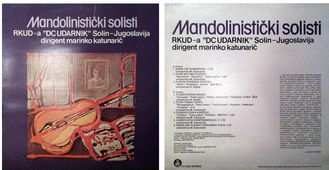
Slika 10. Izgled albuma mandolinističkih solista iz 1982. (Discogs, 2022)