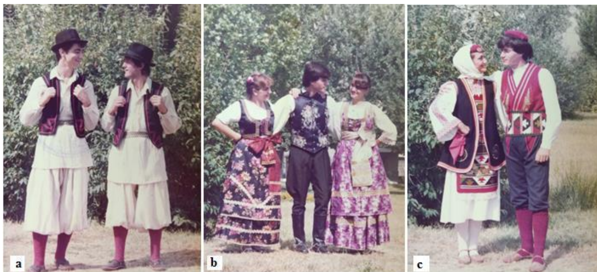
Slika 13. Banatska (a), bunjevačka (b) i vrlička (c) nošnja u posjedu KUD-a Salona

koreografije Ero s onoga svijeta . Banatska nošnja u KUD je stigla 1977., a bunjevačka 1983. Slika 13 prikazuje neke od nošnji koje je KUD Salona posjedovao u to vrijeme, a fotografije članova prvog ansambla u nošnjama snimljene su 1985.