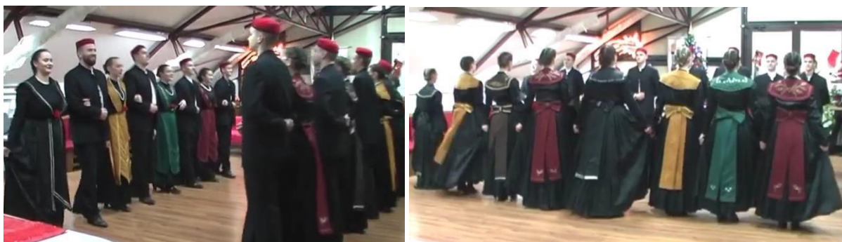
Slika 12. Stari splitski plesovi (KUD Salona, Facebook, 2022)

drugu iza leđa. Plešu lagano se tresući i prvo se razdvajaju jedni od drugih, a potom približavaju jedni drugima ( Slika 12 ). Slijede okreti u mjestu, pljesak rukama te ponovno razdvajanje i ples u parovima.