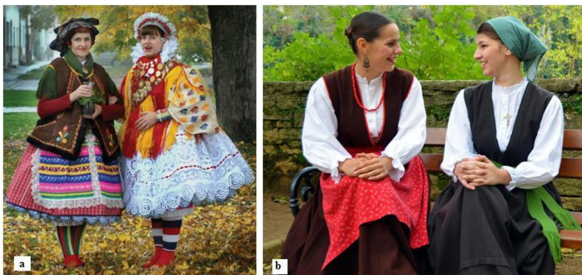
Slika 9. Bizovačka (a) i istarska (b) nošnja (Španiček, 2010; Folklorno društvo Pazin, 2022)

Narodne nošnje Alpske zone najbolje se mogu opisati nošnjama njezinih dviju najvećih regija – Hrvatskog zagorja i Istre. Na Slici 9 prikazana je bizovačka nošnja i nošnja središnje Istre. Bizovačka ženska nošnja, za razliku od ostalih nošnji Zagorja, kraća je i seže do koljena, suknje su vezene i imaju više slojeva, a gornji dio tijela prekriven je šarenim prslucima uz dodatak oplećka koji se nosi oko vrata i koji na sebi može imati ukrase i dukate ili biti bez njih. Na nogama se nose specifične šarene čarape izrađene od vune (Španiček, 2010). S druge strane, nošnja središnje Istre u potpunosti je suprotna bizovačkoj. Riječ je o skromnim odjevnim predmetima koji uključuju jednostavne bijele bluze, fačole (odjevni predmet koji se oblači preko bluze i seže do stopala, a pojavljuje se u većem broju boja od kojih svaka označava status ženske osobe – udovice nose crni, udane žene zeleni, slobodne djevojke crveni itd.), traveršu (pregača), a na stopalima su im najčešće opanci ili drvene cokule koje su se svojevremeno koristile tijekom rada u polju (Folklorno društvo Pazin, 2022).