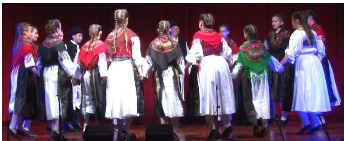
Slika 17. Srednja dječja plesna skupina pleše Dječje plesove iz Međimurja na Završnom koncertu 11. lipnja 2022.

Primjerice, na Završnom koncertu iz lipnja 2022. izveli su dvije koreografije. Koreografiju Stari splitski plesovi izveli su zajedno s dječjim ansamblom, a koreografiju Dječji plesovi iz Međimurja izveli su samostalno ( Slika 17 ). S potonjom su koreografijom nastupili i na 10. županijskoj smotri dječjeg folklora u Kaštel Sućurcu.