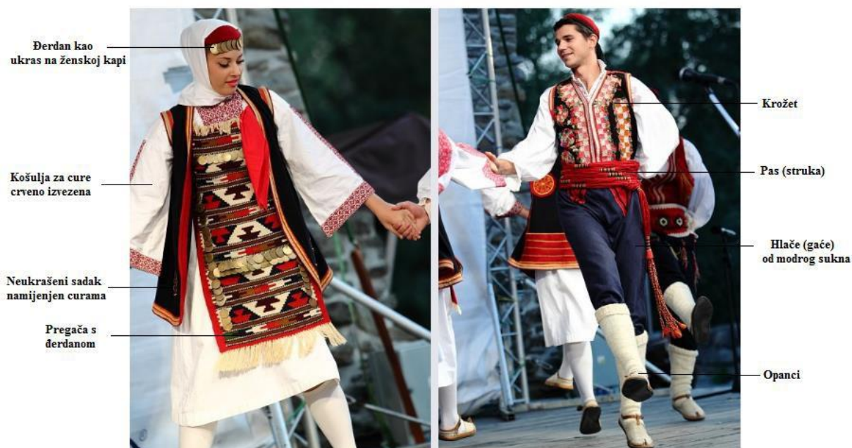
Slika 6. Vrljička muška i ženska nošnja

crvenim koncem, dok je košulja namijenjena udanim ženama izvezena modrim koncem. Drugi je primjer sadak, odjevni predmet bez rukava koji se oblači iznad košulje. Cure nose potpuno neukrašene sadake, a kad su spremne za udaje, na njih se stavljaju prvi ukrasi, dok su oni za žene bogato ukrašeni (Turistička kultura, 2009).