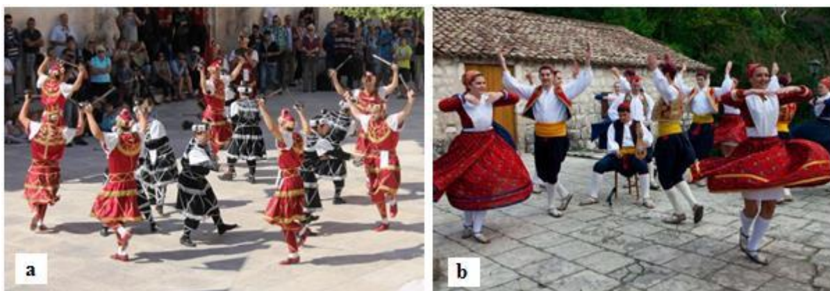
Slika 8. Moreška (a) i lindo (b)

Premda se na području Jadranske zone plesao veliki broj narodnih plesova, najistaknutiji su moreška i dubrovačka poskočica, danas poznata kao lindo. Moreška ( Slika 8.a ) je narodni ples u obliku viteške igre i borbe s mačevima. Na Jadranu se počela izvoditi za vrijeme 16. stoljeća, a najučestalija je u priobalnim dalmatinskim gradovima, posebno u Dubrovniku i Splitu. Moreška je ples poprimljen pod utjecajem turske najezde, a pri plesanju uloge su raspodijeljene na Turke (u crvenim odorama) i Maure (u crnim odorama). Turci su predvođeni kraljem Osmanom, Mauri crnim kraljem Morom, a okosnica plesa jest borba za djevojku bulu koju su Osmanu oteli Mauri (Maljković i sur., 2016: 258–261). S druge strane, lindo ( Slika 8.b ) je izuzetno ritmičan ples koji se izvodi uz pratnju lijericice, u parovima i uz usmjeravanje kolovođe koji se koristi glasnim povicima kako bi rasporedio parove (Travirka, 2005).