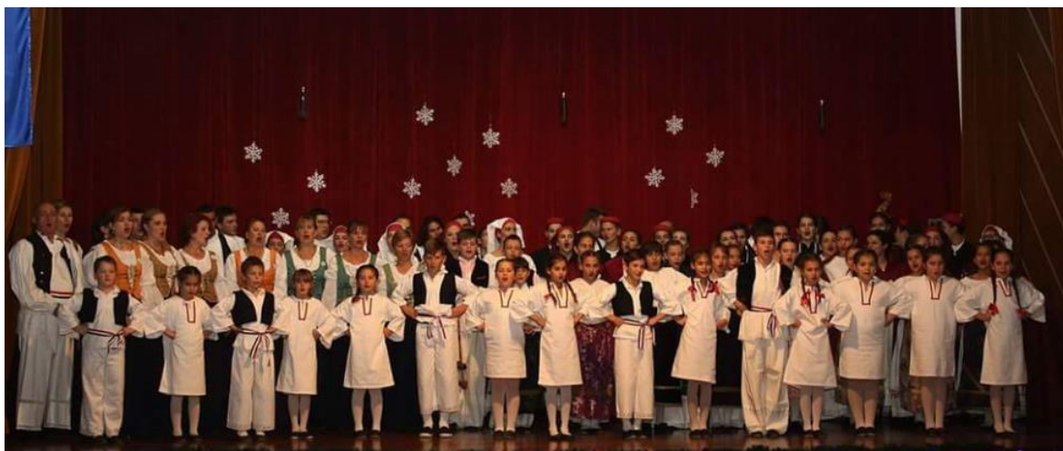
Slika 14. Narodna nošnja za najmlađu plesnu skupinu

KUD posjeduje i dječje nošnje. Postoje tri vrste dječjih plesnih skupina razvrstanih prema dobi u najmlađu, srednju dječju plesnu skupinu i dječji ansambl (o čemu se detaljnije govori u sljedećem poglavlju) od kojih su za posljednje dvije skupine (djecu starijeg uzrasta) osigurane nošnje koje imaju i članovi prvog ansambla, dok najmlađa skupina ima samo jednu nošnju, prikazanu na Slici 14 .