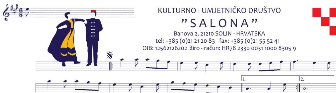
Slika 11. Logo KUD-a Salona (KUD Salona, Arhiva)

Međutim, raspad bivše države i ratna zbivanja na početku Domovinskog rata utjecala su na odluku vodstva da KUD jedno vrijeme prestane s radom. Navedena pauza trajala je od travnja 1991. do prosinca 1992., a početkom 1993. KUD ponovno počinje s radom i posljednji put mijenja naziv u KUD Salona, koji je zadržan do danas (KUD Salona, Arhiva), a čiji je logo prikazan na Slici 11 . Prema riječima Nebojše Bobana, do rata društvo nije imalo stalan prostor i probe su se održavale na različitim mjestima uključujući staro kino u Majdenu, dom u Mravincima, školske dvorane i staro kino u Svetom Kaju. Probe se danas održavaju na stalnoj adresi društva, u centru Solina.