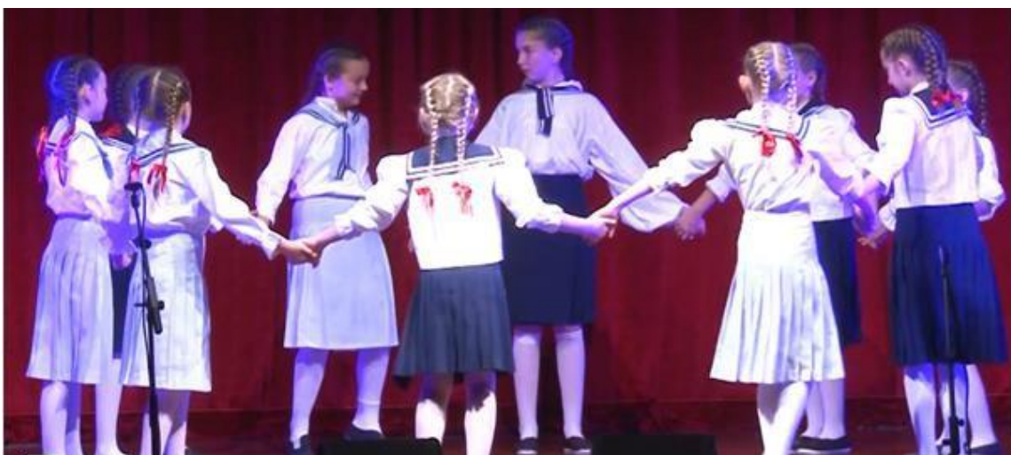
Slika 16. Kolo, kolo, bit će pir u izvedbi mlađe dječje plesne skupine na Završnom koncertu dječjih folklornih skupina

Pripreme za Završni koncert obično uključuju izvedbu velikog broja igara s pjevanjem. Za koncert održan 11. lipnja 2022. odabrano je ukupno 11 igara s pjevanjem, šest tradicionalnih za Dalmaciju i pet tradicionalnih za Posavinu, čiji se popis nalazi u Tablici 13 .