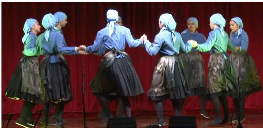
Slika 18. Dječji ansambl izvodi Ražanačko kolo na Završnom koncertu 11. lipnja 2022. (KUD Salona, Arhiva)

Kad prijeđu u dječji ansambl, djeca su spremna na učenje svih koreografija koje izvodi prvi ansambl. Ovo uključuje većinu koreografija ranije prikazanih u Tablici 8 . Za razliku od srednje plesne skupine koja uči tek nekoliko odabranih koreografija, dječji ansambl uči ih sve. Osim toga članovi dječjeg ansambla imaju sve nošnje koje ima i prvi ansambl. Na Slici 18 prikazani su članovi dječjeg ansambla dok plešu Ražanačko kolo u prikladnim nošnjama, a s istom su koreografijom nastupili i na 10. županijskoj smotri dječjeg folkloru u Kaštel Šućurcu (KUD Salona, interni podatci).