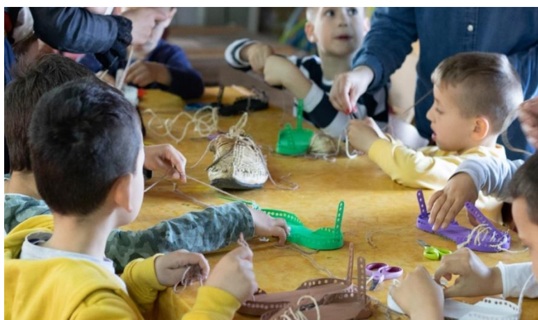
Sika 12. Likovna radionica – izrada opanka