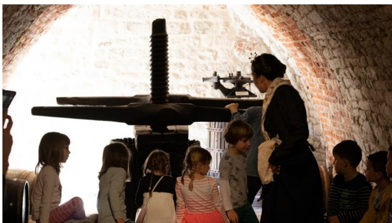
Slika 7. Storytelling- Etnografski muzej u Splitu