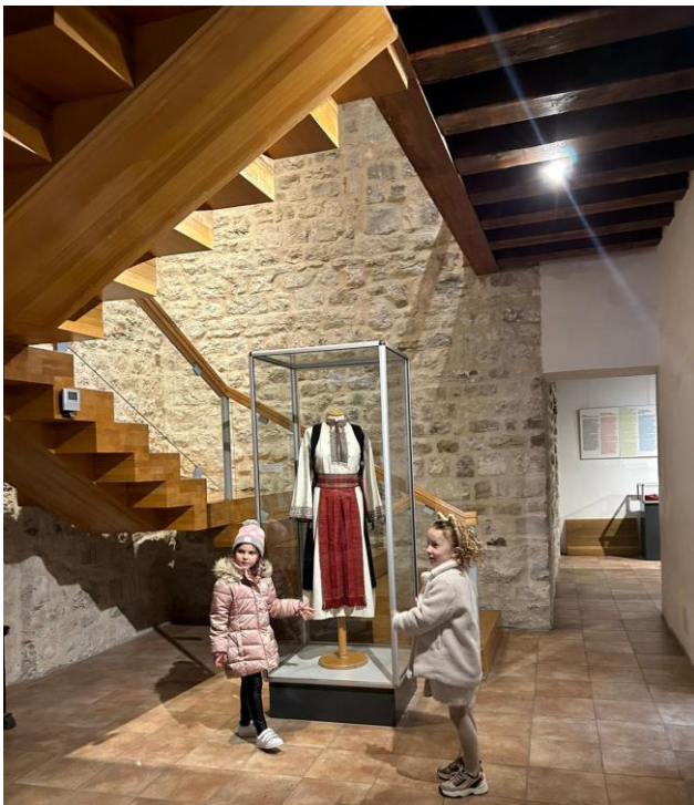
Slika 18. Storytelling- Etnografski muzej u Splitu