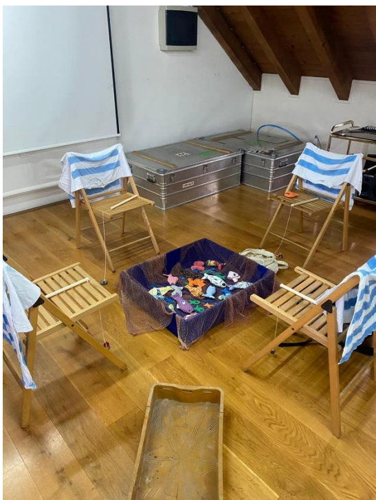
Slika 20. Storytelling- Etnografski muzej u Splitu