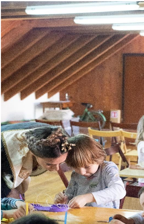
Slika 4. Radionica „Šalturica Biserka“

Na ovaj način posjetitelje, a posebno djecu, koja su i glavni fokus ovog diplomskog rada, potiče se na upoznavanje sa kulturnom baštinom na interaktivan i kreativan način, promišljanje o načinima na koje bi je mogli očuvati i osvještavanje o promjeni kulture i običaja kroz vrijeme (Premuž-Đipalo, 2013, 299). Kako bi posjetu muzeju prošao što ugodnije, odgojiteljima i nastavnicima kustosi muzeja savjetuju da prije posjeta upoznaju djecu s ustanovom u koju dolaze, te da ih se uputi u primjereno ponašanje u prostorima ustanove. Sa kustosom se potrebno unaprijed dogovoriti o planiranim aktivnostima kako bi program protekao što ugodnije, a predlaže se i povezivanje usvojenih informacija prilikom posjeta s drugim nastavnim sadržajima. Sve povratne informacije nakon posjeta dobro su došle ( https://etnografski-muzej-split.hr/edukacija ).