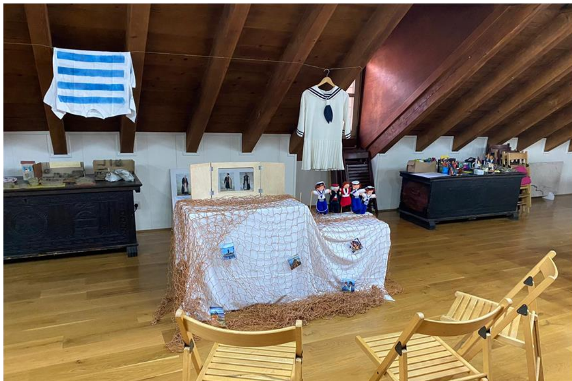
Slika 26. Radionica „Ribar Jure“ – dramski centar