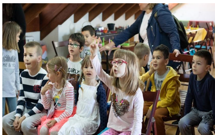
Sika 15. Likovna radionica – pitalica o nošnjama