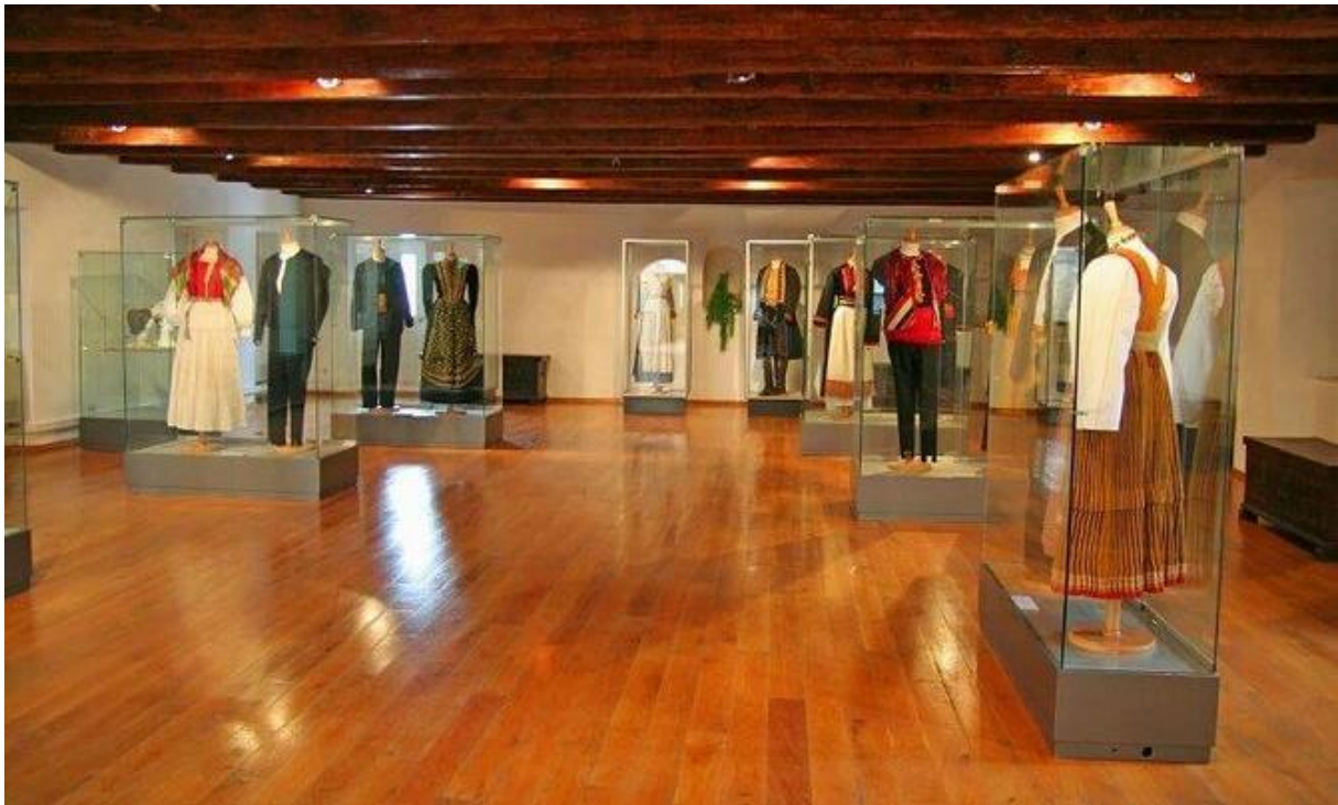
Slika 3. Tradicionalne Dalmatinske odore