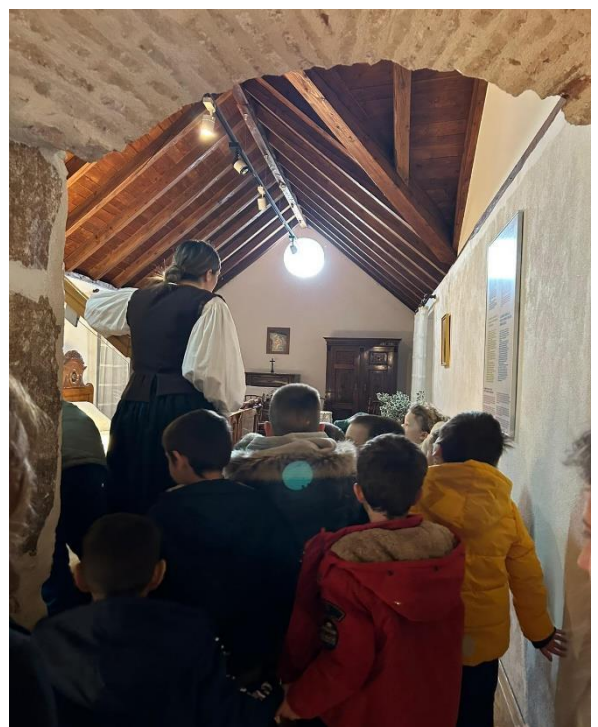
Slika 19. Storytelling- Etnografski muzej u Splitu