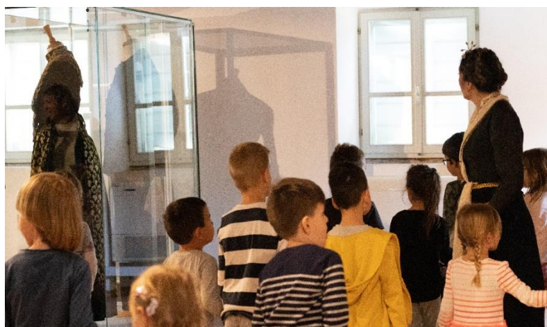
Slika 9. Storytelling- Etnografski muzej u Splitu