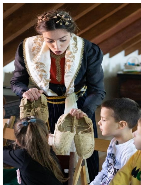
Sika 11. Sinjski opanak