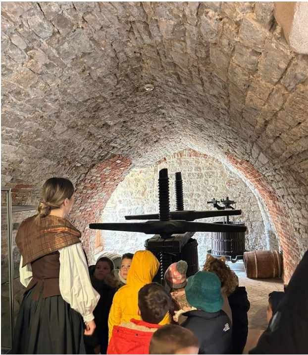
Slika 16. Storytelling- Etnografski muzej u Splitu