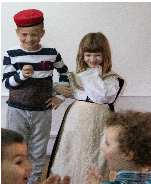
Sika 10. Oblačenje u kaštelansku narodnu nošnju