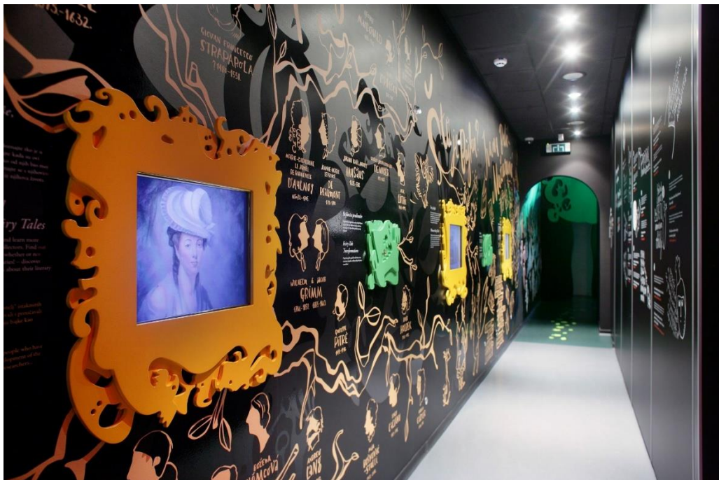
Slika 6. „Ivanina kuća bajke“

„Ivanina kuća bajki“ u svojim prostorima ima stalnu multimedijску postavu, prostor za radionice i suvenirnicu i knjižnicu.