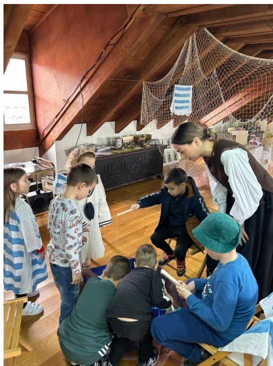
Slika 21. Storytelling- Etnografski muzej u Splitu