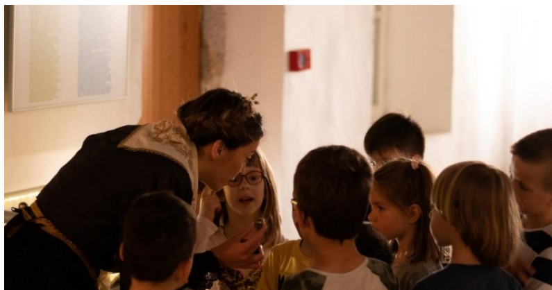
Slika 8. Storytelling- Etnografski muzej u Splitu