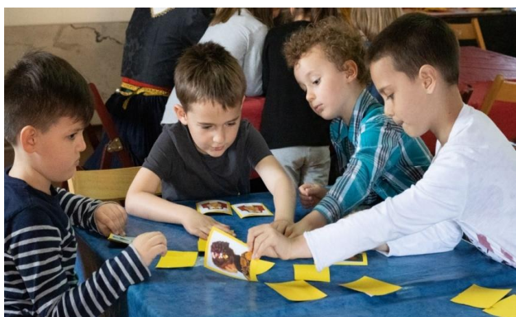
Sika 14. Likovna radionica – memory „Hrvastke narodne nošnje“