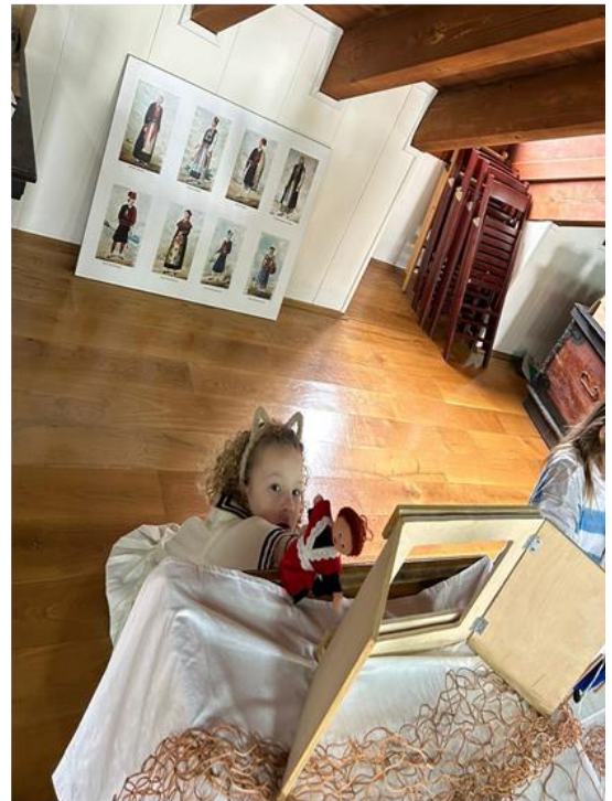
Slika 25. Radionica „Ribar Jure“ – dramski centar