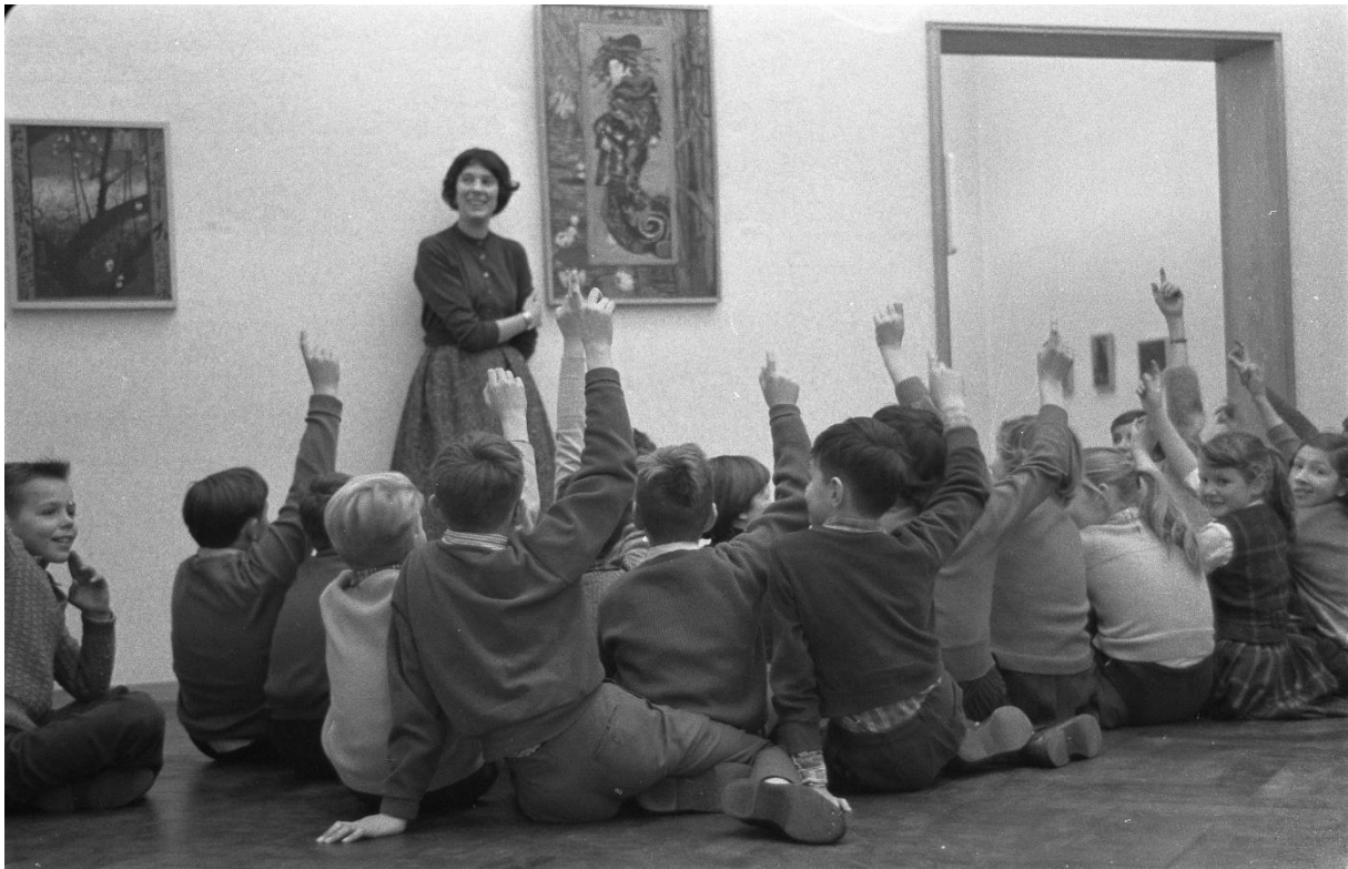
Slika 2. Muzejski pedagog s djecom – 1960. Stedelijk Museum Amsterdam

Kako bi bio stručan i adekvatno prenio informacije i znanje posjetiteljima, preporučuje se da muzejski pedagog bude fakultetski obrazovana osoba, a poželjno je da posjeduje diplomu iz jedne od muzejskih disciplina, kao što su arheologija, povijest umjetnosti i dr. (Cukrov, 1997, 5-13).