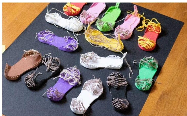
Sika 13. Dječji radovi - opanak