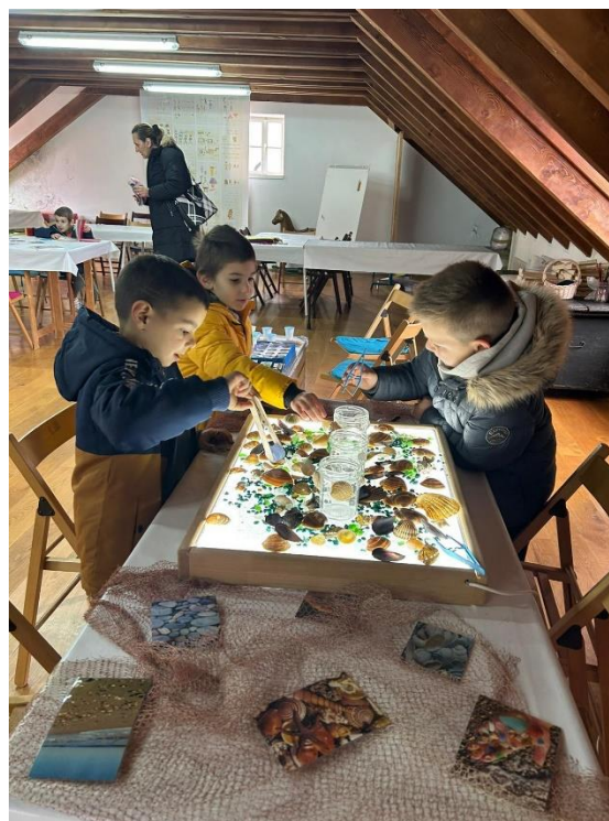
Slika 23. Storytelling- Etnografski muzej u Splitu