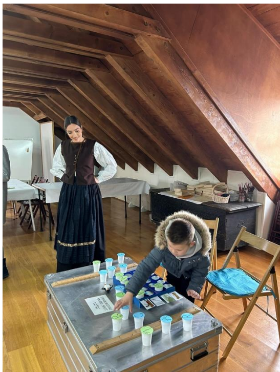
Slika 22. Storytelling- Etnografski muzej u Splitu