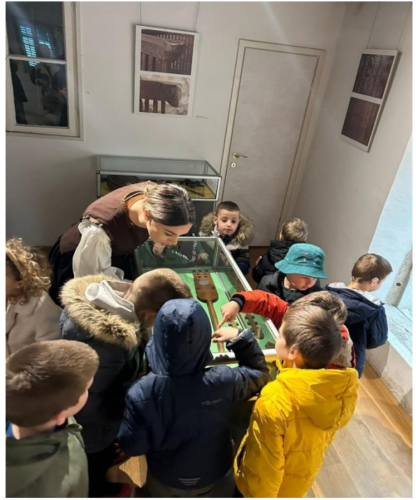
Slika 17. Storytelling- Etnografski muzej u Splitu