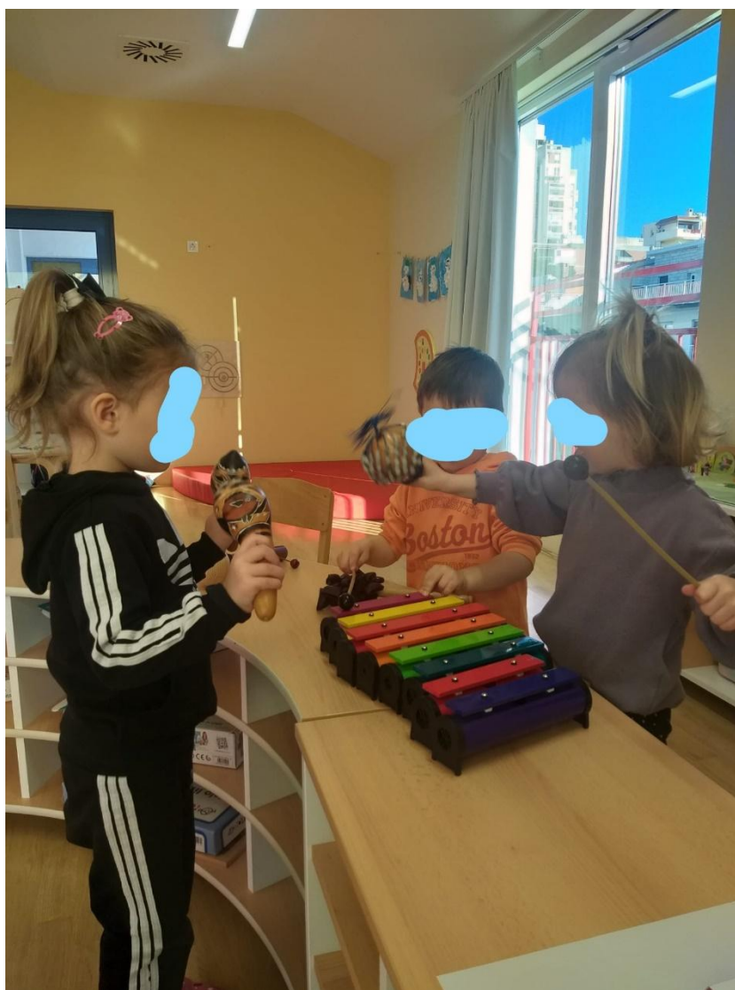
Slika 23. Koncert udaraljka